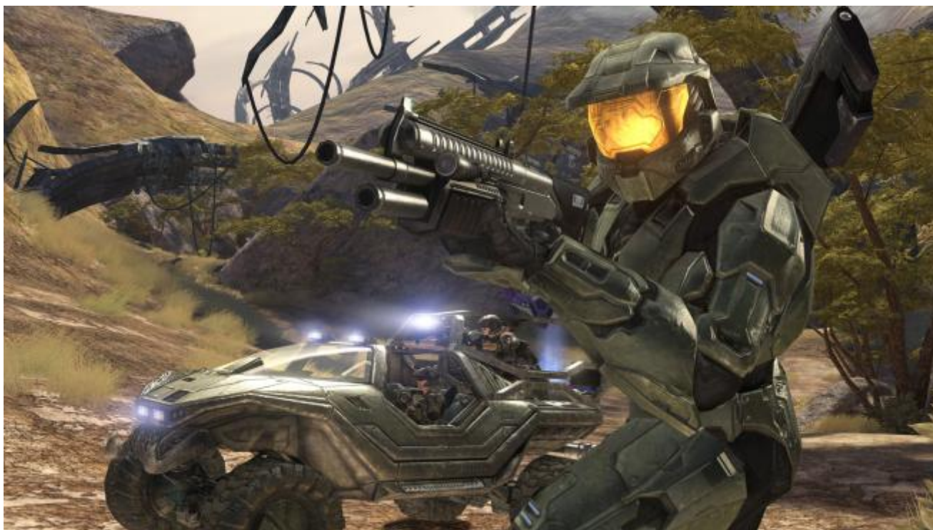
Screenshot from Halo 3: http://www.hightech-edge.com/halo-3-game-review-video/1426/

Perciò la lettura proposta sul rapporto tra interfaccia e database si può sintetizzare come segue: