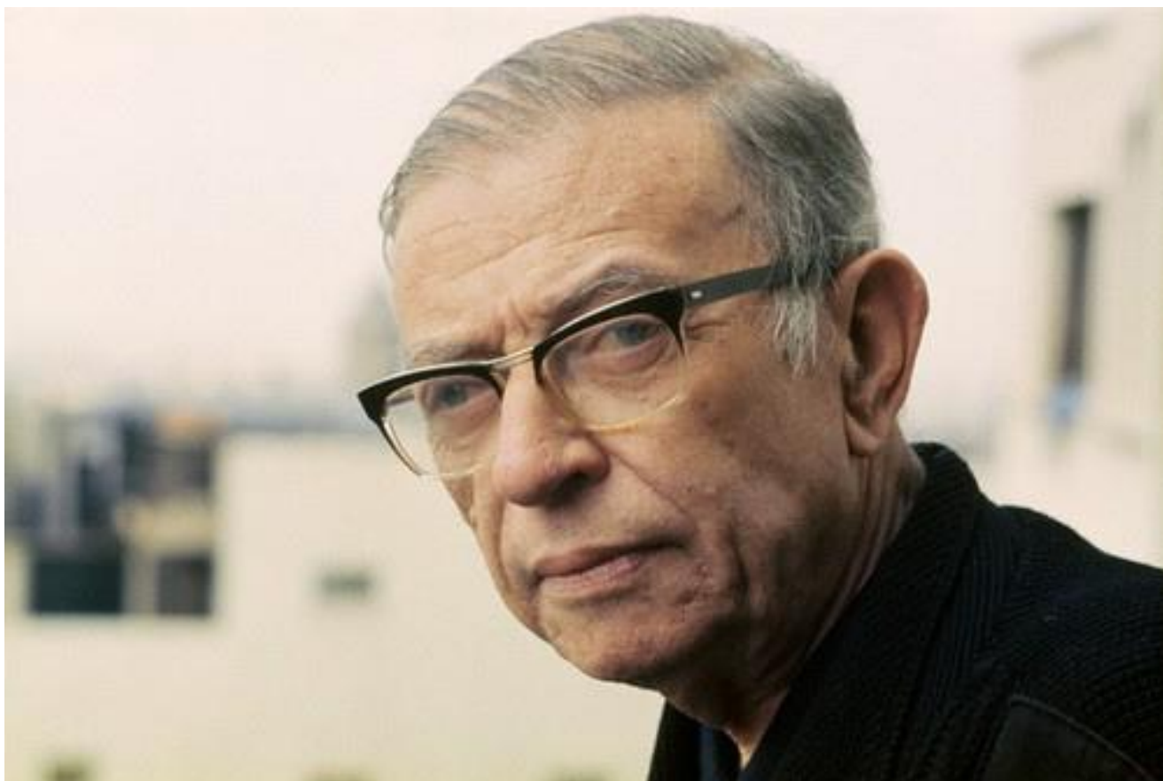
Jean Paul Sartre

Nella rilettura kojèviana della Fenomenologia , la dialettica della storia si fonda sul desiderio di riconoscimento. Il desiderio è desiderio dell'altro, di ciò che l'altro desidera ed insieme desiderio che l'altro ci desideri: "umano è desiderare quel che desiderano gli altri", ad anticipare il desiderio mimetico di Girard. Da Marx Kojève trae un'antropologia secolarizzata in cui, attraverso la Lotta ed il Lavoro, si compie la trasformazione che, liberando il Servo dalla natura, lo libera dalla sua natura di Servo. Si tratta (lo noterà Derrida) di rifondare in senso non metafisico la "realtà umana", come farà Sartre: L'Essere e il nulla (1943) accoglie la lezione di Kojève per cui la relazione con la mera oggettività rischia di annullare l'uomo nelle cose, di sprofondarlo nella "nausea". La coscienza scopre la propria autenticità solo quando è vista dall'Altro, come nelle famose pagine de L'essere e il nulla dedicate alla vergogna.