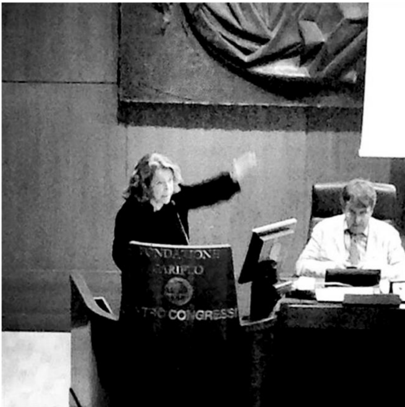
Andrée Ruth Shammah

La parola d'ordine è, ovviamente, trasparenza; ma ancora non viene chiarito come un simile auspicio possa diventare realtà concreta. Tra le buone intenzioni vanno menzionati anche la volontà di rendere più semplice l'accesso ai finanziamenti per le nuove compagnie e l'incentivo previsto per chi ospita artisti sotto i 35 anni. E ancora: la messa in rete dei circuiti regionali; l'apertura alle residenze; un incoraggiamento concreto all'internazionalizzazione e alla mobilità artistica.