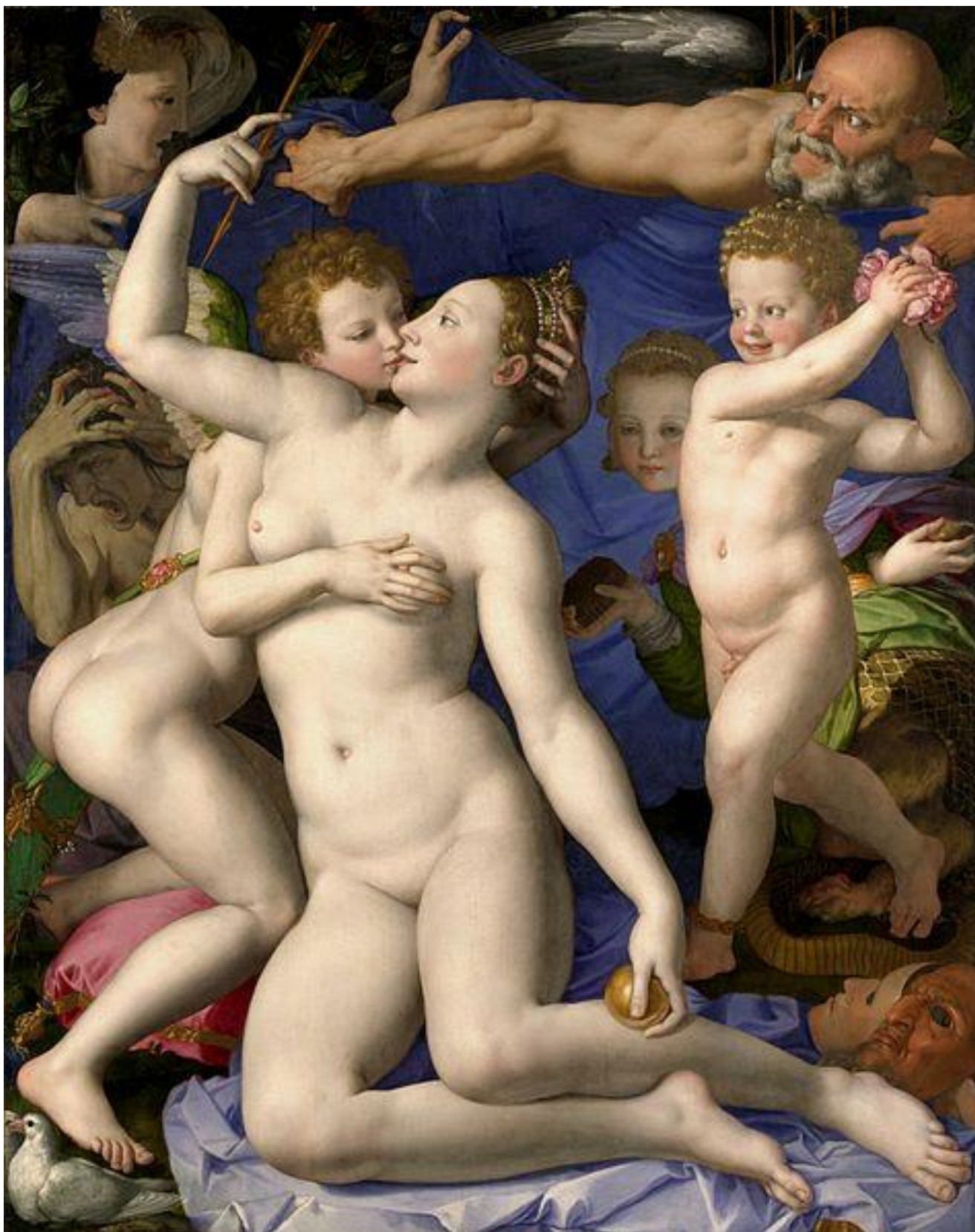
Bronzino (Agnolo di Cosimo), Allegoria del trionfo di Venere (1540-1545)

Molto spesso, il tema dell'opera era difficile da decifrare, e gli spazi e le figure dipinti erano incoerenti o molto distorti, come ad esempio è il caso di La Madonna dal collo lungo (1534-1540) del Parmigianino, o l' Allegoria del trionfo di Venere (1540-1545) del Bronzino. Perciò, in un certo senso, le rappresentazioni manieriste tendono a spostare l'attenzione dal nucleo più importante, o pertinente, a sezioni confuse, altamente finzionali e distorte della composizione.