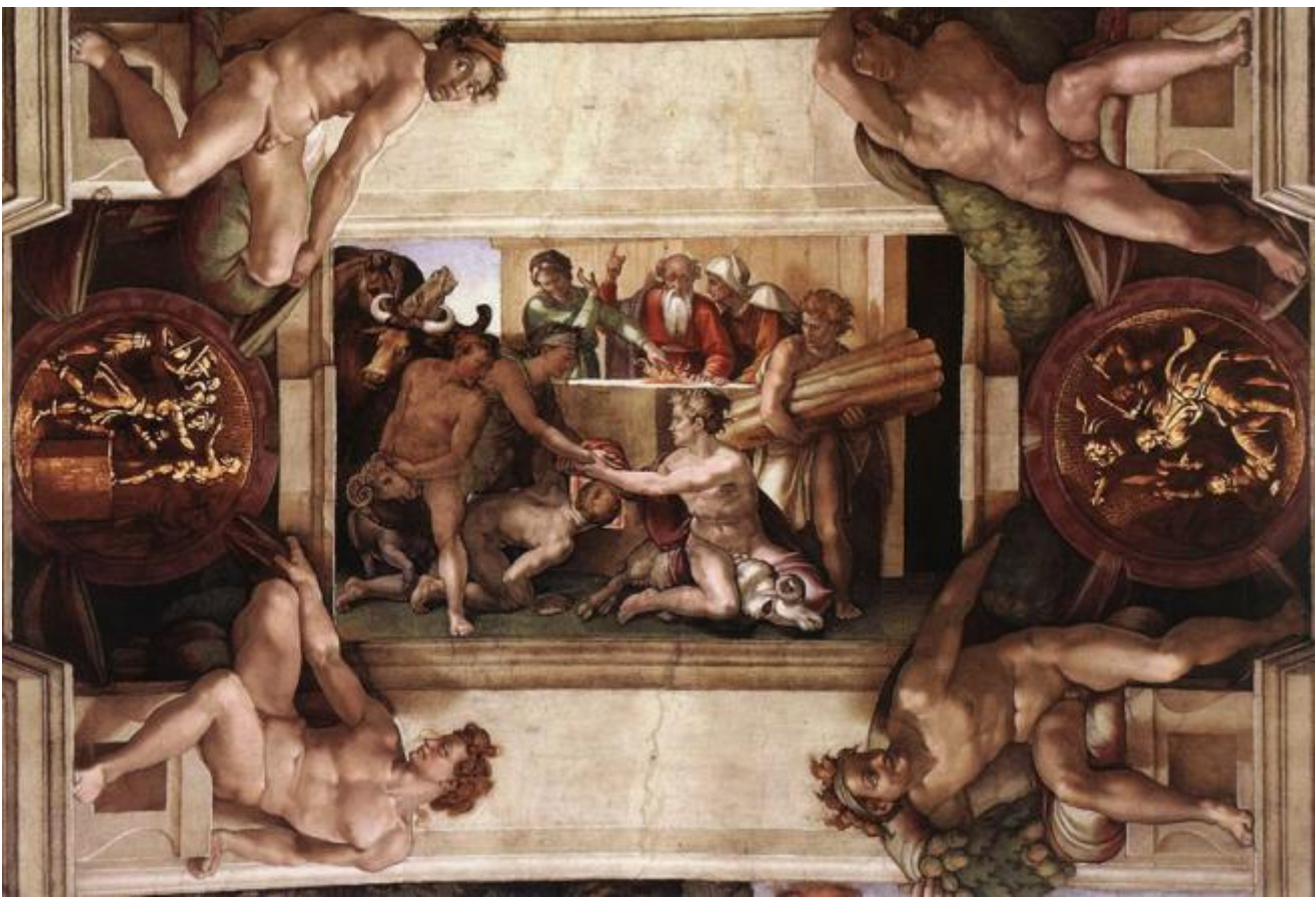
Michelangelo Buonarroti, Cappella Sistina (Ignudi) (1508-1512)

Si può fare poi un parallelismo con l'evoluzione della rappresentazione dello spazio nella storia dell'arte occidentale, e considerare che l'OS1 corrispondeva al periodo dell'uso della prospettiva gerarchica nella storia della pittura (medievale), nella quale gli oggetti si rappresentavano secondo la loro importanza e significato, senza cercare di trasmettere un senso realistico dello spazio. L'OS8 invece è più vicino al Rinascimento e all'invenzione della prospettiva lineare da parte di Filippo Brunelleschi (1377-1446) e della sua codifica scientifica da parte di Leone Battista Alberti (1404-1472).