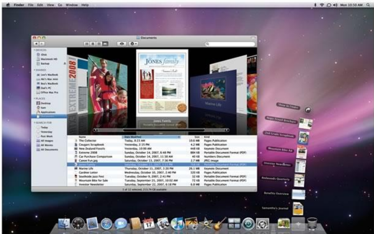
Mac OSX Leopard

Seguendo la linea di pensiero esposta sopra, dal Mac OSX in poi, comincia quello che può facilmente identificarsi come il “periodo manierista dei sistemi operativi”. Se il Manierismo nelle arti visive ebbe le sue ragioni di esistere e certamente non può essere giudicato come giusto o ingiusto, nemmeno è il caso per i sistemi operativi; tuttavia, trattandosi di una interfaccia attraverso la quale potenzialmente tutte le nostre produzioni culturali vengono filtrate oggi – cinema, musica, testi, comunicazione, etc. etc. ( Manovich 2001: 75 ), questa situazione appare meno innocente, e deve sicuramente essere considerata con più attenzione.