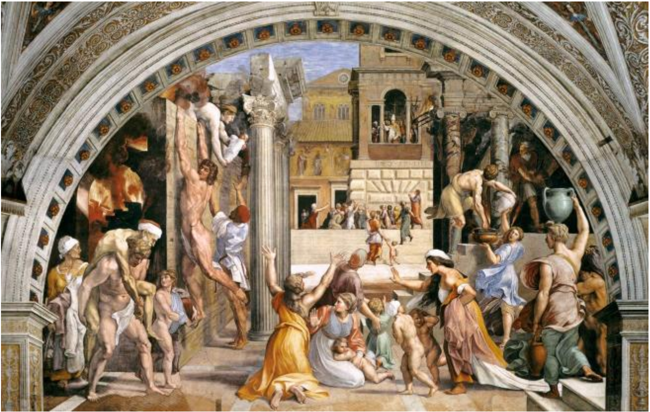
Raffaello Sanzio, Incendio di Borgo (1514). Stanze Vaticane, Roma.

Ma una delle caratteristiche principali del Manierismo, oltre al grande virtuosismo, è lo spostamento dell'azione principale all'interno della composizione in una posizione secondaria in relazione al tema dell'opera, o persino verso il fondo, come per esempio succede nell' Incendio di Borgo (1514) di Raffaello Sanzio in una delle Stanze Vaticane.