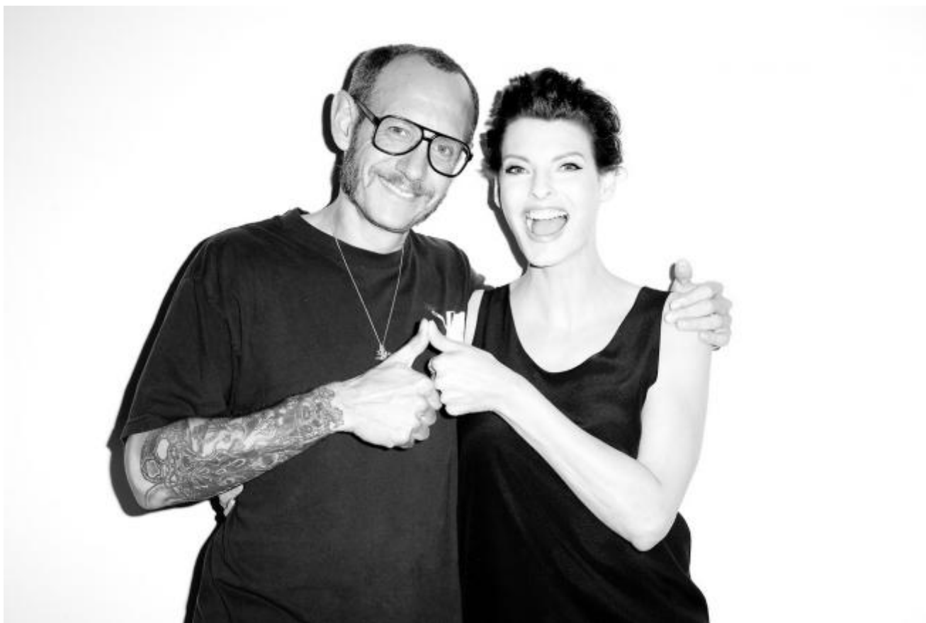
Linda Evangelisti e Terry Richardson.

Cos'è per l'esattezza il mondo di Terry? E' forse il mondo visto dagli occhi disincantati di un teenager? Forse sì. Lui di fatto si comporta in ogni scatto come un teenager che incontra la sua star preferita nei camerini dopo un concerto. Questa sensazione di foto rubata alla star di turno è molto forte nonostante la consapevolezza che Terry Richardson è anch'egli una celebrità.