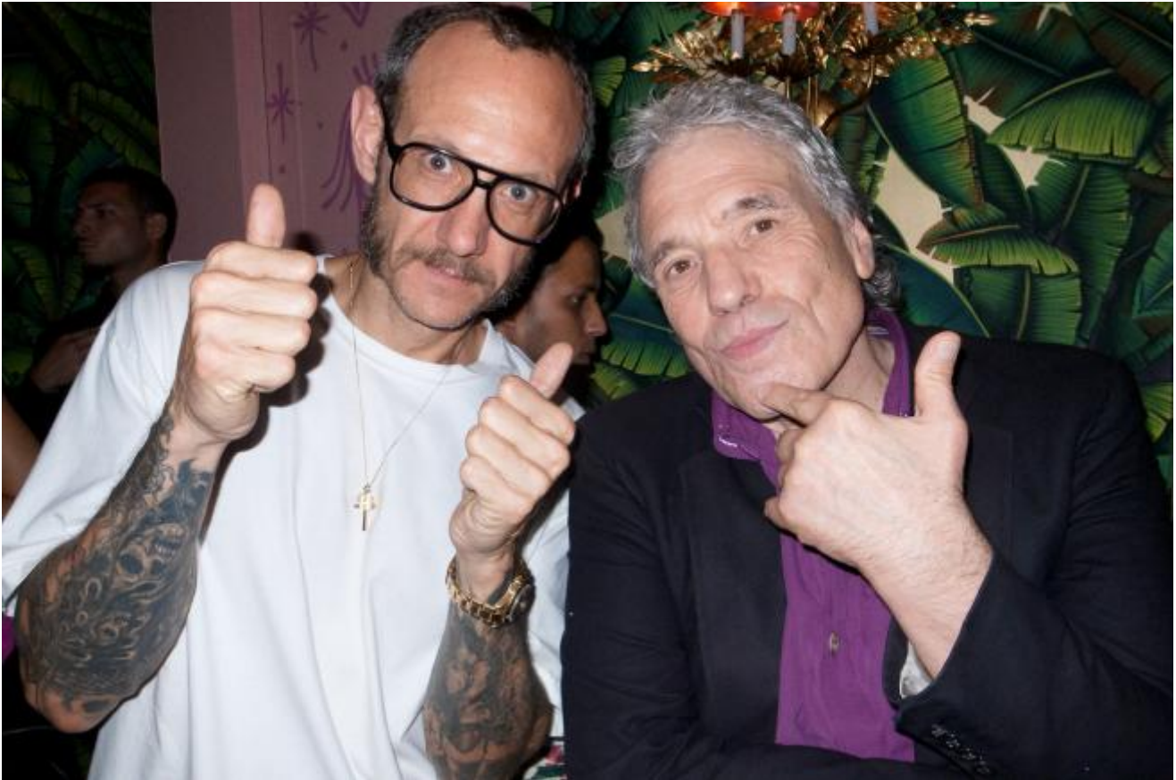
Terry Richardson e Abel Ferrara.

Nei giorni in cui guardavo il suo blog era la volta di Abel Ferrara, Linda Evangelista e Jared Leto. Per tutti e tre abbiamo la stessa sequenza. Prima gli scatti canonici, sostanzialmente delle foto di moda, poi delle foto buffe, quelle che di solito si fanno ai compagni di liceo nelle gite scolastiche, ed infine la solita foto a due, abbracciati e sorridenti coi pollici alzati. Perché questa foto, sempre uguale, ripetuta all'infinito all'interno del blog? Se scorriamo il diario a ritroso nel tempo, si viene presi da una sorta di vertigine.