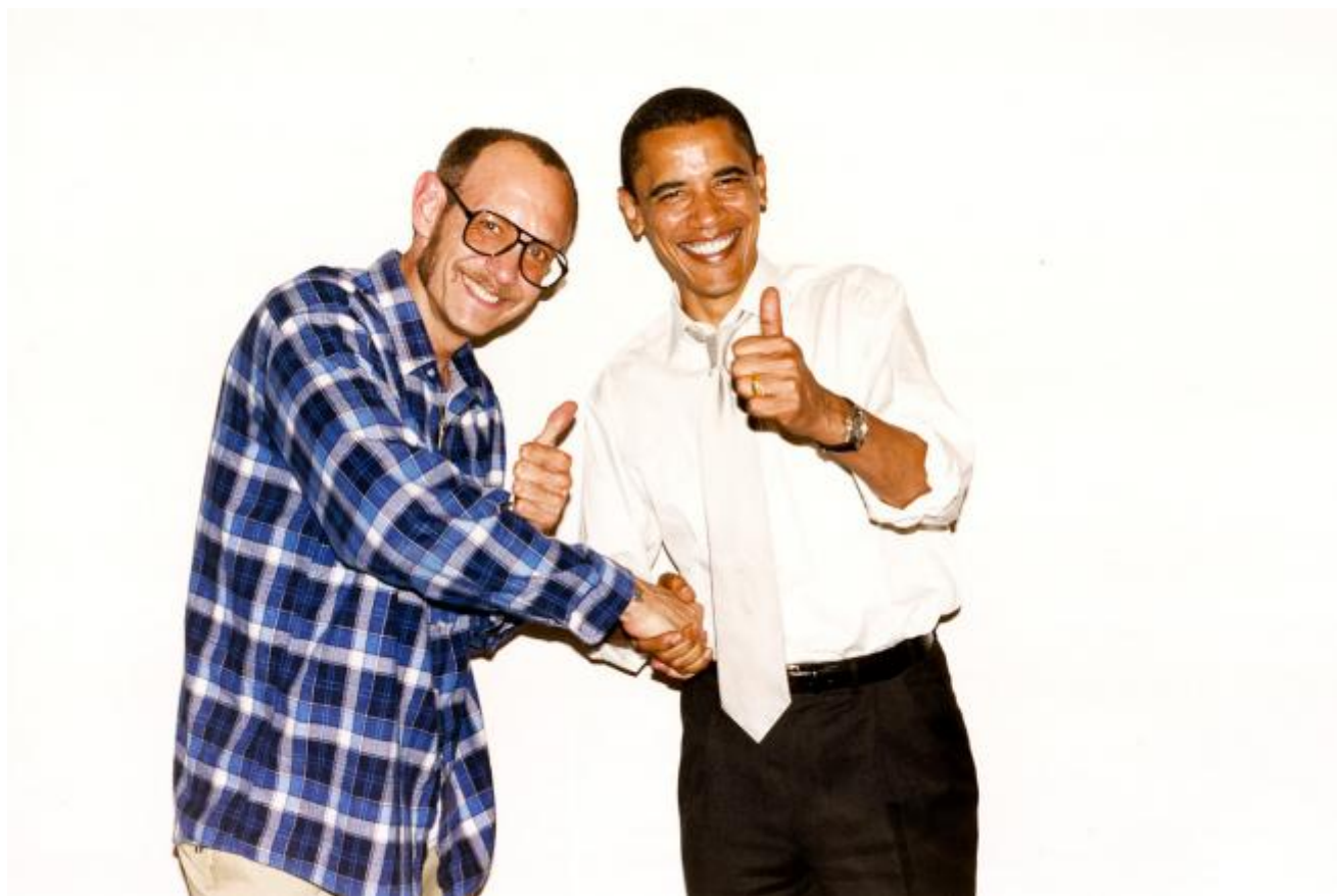
Terry Richardson e Barack Obama.

Cos'hanno in comune Barack Obama, Yoko Ono, Courtney Love, Catherine Deneuve, Paris Hilton e Miley Cyrus? Tutti loro hanno fatto una foto accanto a Terry Richardson, un uomo di mezza età che al loro fianco appare sempre sorridente e con il pollice alzato quasi a dire: "Eccomi qui! Ce l'ho fatta un'altra volta!" Chi è Terry Richardson? Sicuramente un fotografo, un blogger, un ex punk rocker, una figura di punta della cosiddetta scena alternative statunitense.