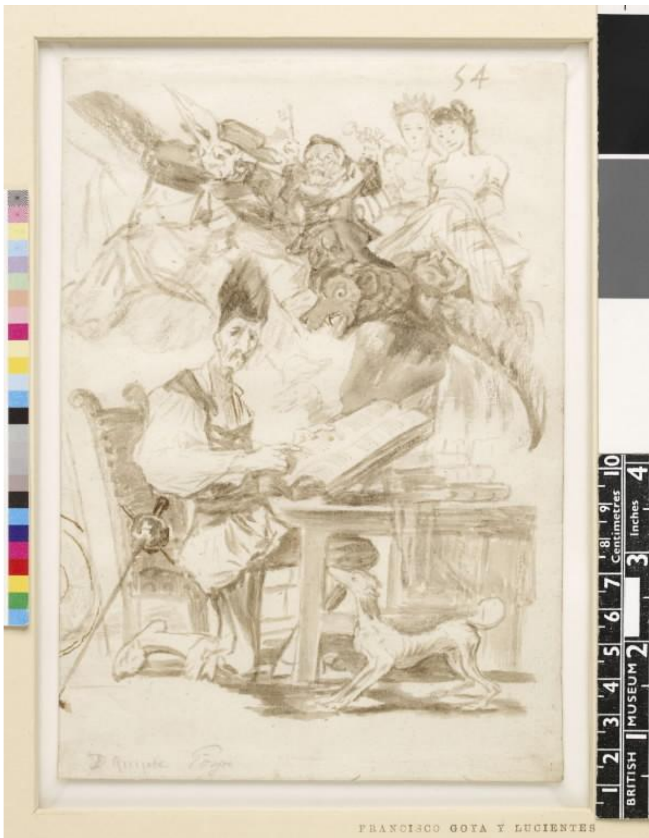
FRANCISCO GOYA Y LUCIENTES