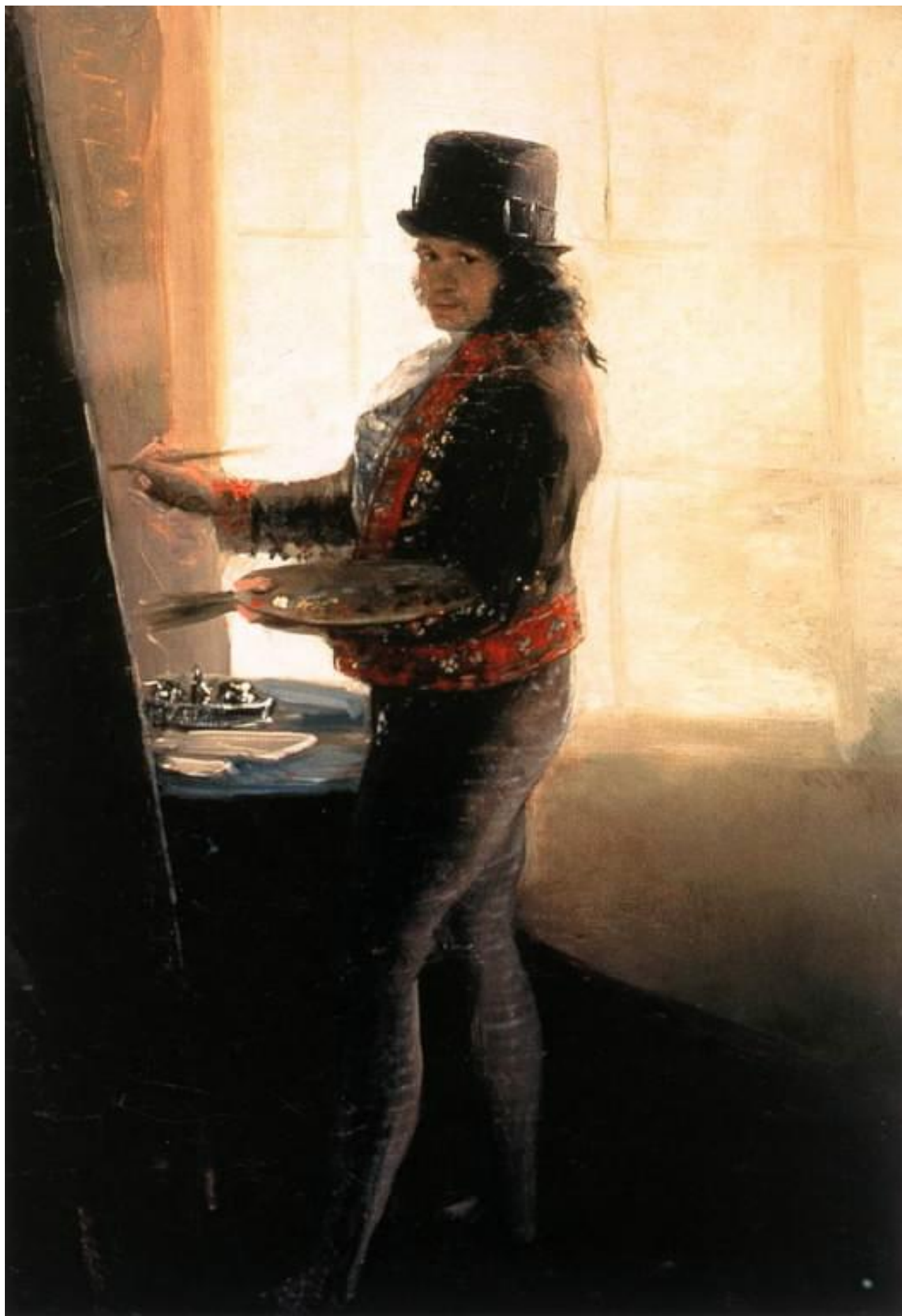
Goya, Autoritratto in piedi