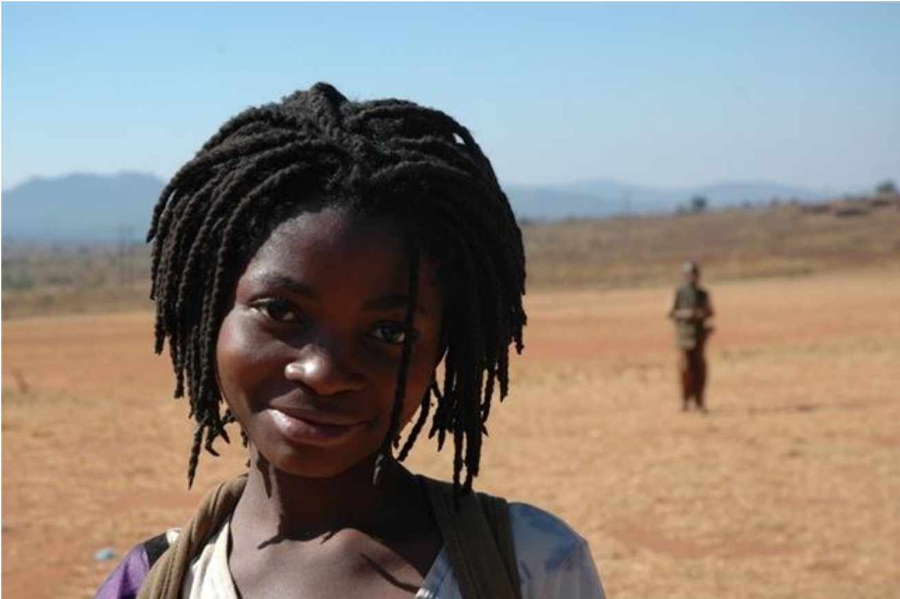
Ryszard Kapu?ci?ski, Dall'Africa

Nel 2002, quando già dirigevo la Bruno Mondadori, mi propose di pubblicare, in coedizione polacca, un suo bellissimo album di foto, intitolato Dall'Africa . Ne scrissi una breve introduzione che gli piacque molto e così mi nominò suo “assistente fotografico”. Organizzammo, nella primavera di quell'anno, una mostra (curata da Iza Wojciechowska) di alcune di quelle foto alla Casa delle letterature, a Roma, nell'ambito della prima edizione del festival “Fotografia” di Marco Delogu. La mostra fu poi invitata a Buenos Aires per un'esposizione alla Fondazione Proa , in occasione di un corso che Kapu?ci?ski doveva tenere a dei giovani gornalisti sudamericani. Mi fece invitare come, appunto, assistente e trascorremmo assieme laggiù due intense settimane.