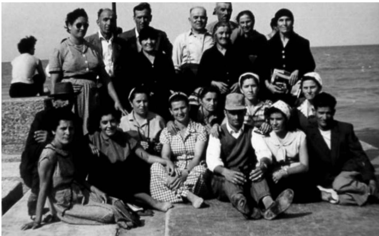
Al mare.

Nel dopoguerra organizzavamo anche i soggiorni estivi dei bambini. Anche lì con una mentalità diversa. Oltre alle colonie che avevamo come Comune di Modena, prendemmo in affitto una trentina di piccoli appartamenti nella zona di Gatteo a Mare, vicino alla colonia, per mandarci le mamme con i bambini piccoli, così noi avevamo più posti per quelli che avevano da sei a dodici. Badavano loro le infermiere e le assistenti sociali e sanitarie. Era un approccio diverso all'infanzia: non solo da un punto di vista assistenziale, ma anche culturale e di avanzamento civile. Ricordo un giorno che andammo a trovare una di queste famiglie, ancora la cosa mi rimane lì, c'era un padre che mi disse: "Signora, sono venuto qui a trovare mio figlio. Lo sa che è la prima volta che vedo il mare?". Eravamo negli anni Sessanta.