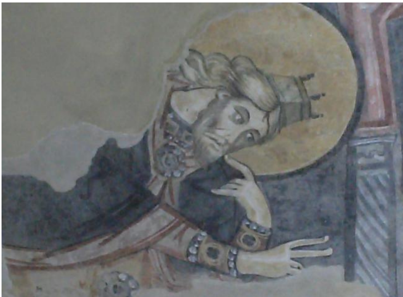
Benevento, chiesa di Santa Sofia, lacerto d'affresco dell'abside sinistro, il Silenzio di Zaccaria