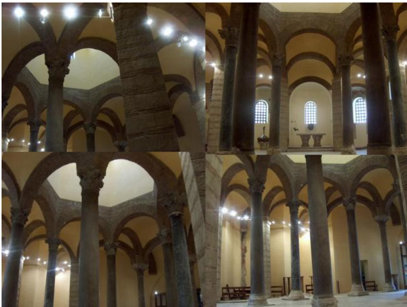
Scorci dell'interno di santa Sofia.

La duchessa di Benevento aveva appena lasciato la chiesa, quando vi fece il proprio ingresso un monaco trafelato che reggeva in una mano, o meglio impugnava, un rotolo di pergamena, segno che doveva essere uno degli amanuensi dello scriptorium , sottoposti all'autorità di Paolo, venuto o mandato in cerca del suo superiore. Guidato dal suono della sua voce, questi raggiunse l'abside sinistro della chiesa e lo chiamò.