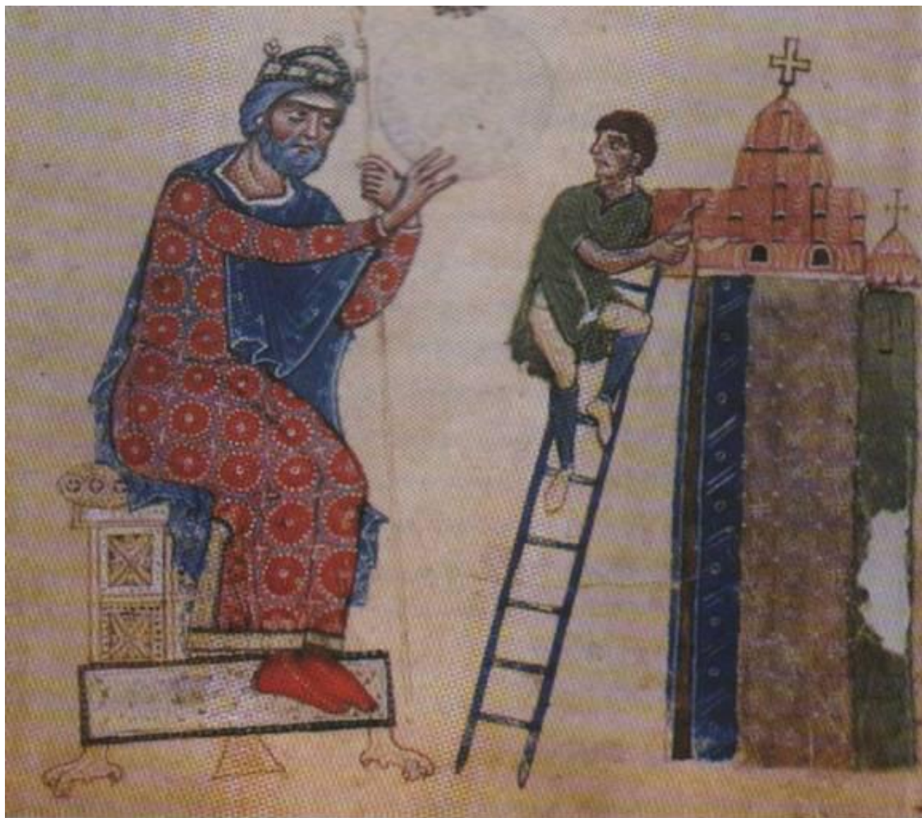
Frontespizio del Chronicon Sanctae Sophiae, (Cod. Vat. Lat. N. 4339, c.281), Roma, Biblioteca Vaticana.

Vi era riprodotto Arechi con indosso una tunica di broccato purpureo damascata in oro, corredata di babbucce, esse pure scarlatte, e di un manto blu cobalto intessuto di fili dorati. Sul capo sfoggiava la corona tempestata di gemme che si era appena fatto realizzare a Costantinopoli quale emblema della carica principesca che si apprestava ad assumere (e che la miniatura già gli conferiva). Era raffigurato nell'atto di impartire indicazioni ad un mastro costruttore che, girato ad osservare il suo principe, era pronto ad apportare modifiche ad un modellino in miniatura della chiesa di santa Sofia, del tutto identico all'originale. Anche il volto del duca-principe somigliava molto a quello vero, tanto che Paolo ne rimase impressionato.