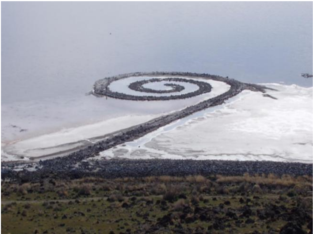
Robert Smithson, Spiral Jetty , 1970

Era un movimento che aveva dentro una certa critica al progresso, o quantomeno un certo disappunto di fronte al potere dell'uomo. Erano anni, quelli, in cui nasceva l'embrione di quella critica alla modernità che fu poi, sull'onda della crisi petrolifera, l'albore del postmodernismo. Oggi risulta vagamente reazionaria, ma va detto che fu per quasi vent'anni il pensiero culturale predominante. A torto o a ragione, poco importa.