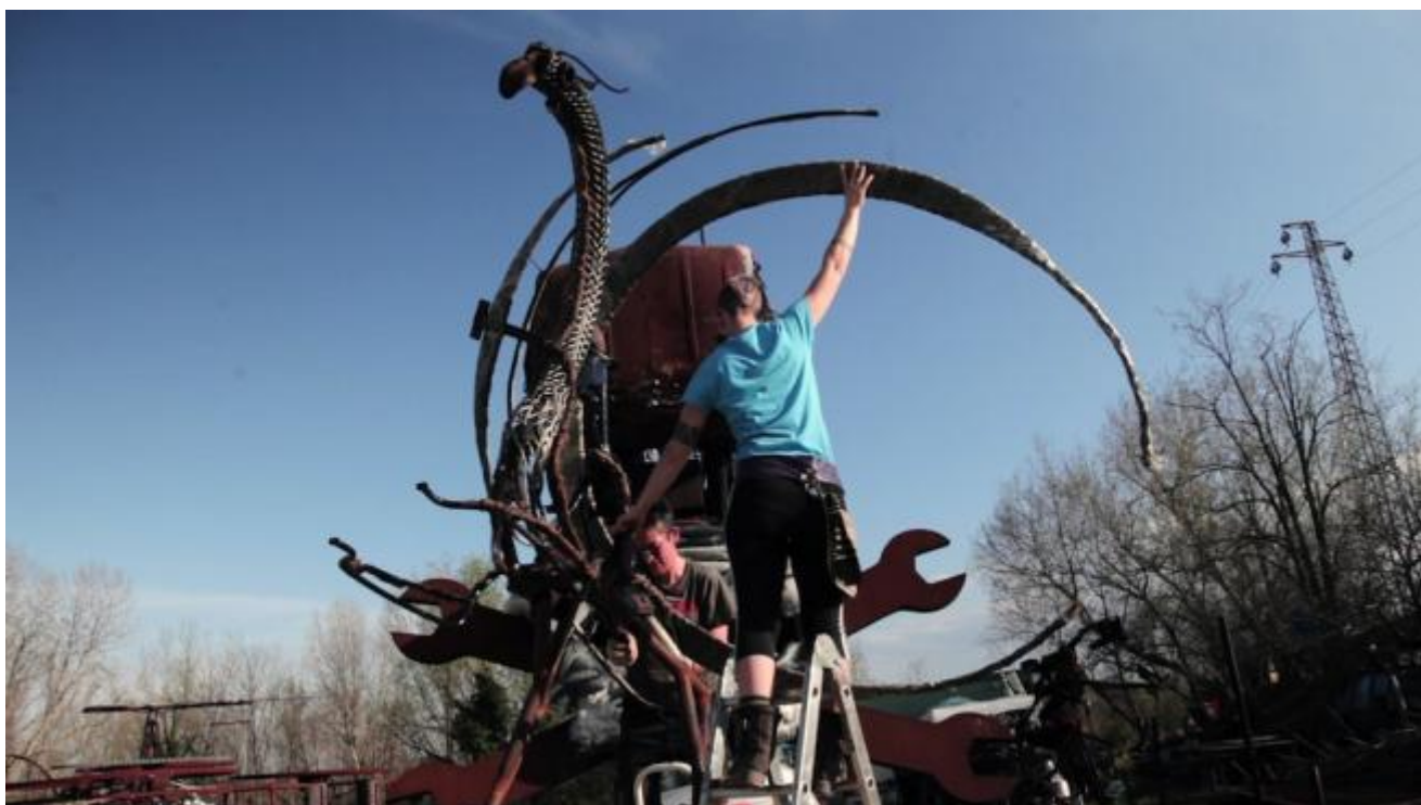
frame dal video di Zimmerfrei

Ecco il senso del film, dichiarato dalla direttrice del festival, Silvia Bottioli: lavorare sull'idea di città, cercando altre possibilità rispetto ai modelli consueti. E ora l'esperimento di Mutonia è a rischio: nell'assenza della politica, la causa di sgombero è andata avanti e a inizio estate è arrivata la notifica. In un modo usato spesso nel Nord Europa per smantellare comunità anomale: con ingiunzioni individuali, per cui non si può montare un caso politico, ma ognuno deve difendersi in proprio.