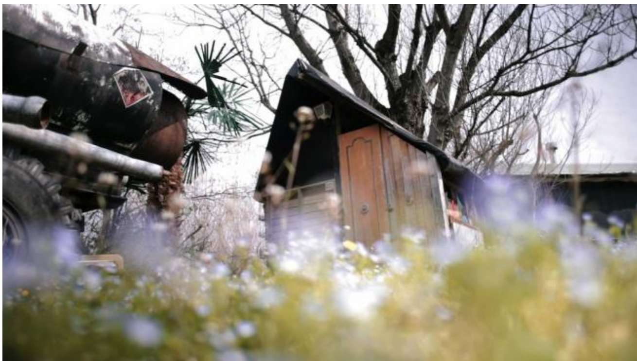
frame dal video di Zimmerfrei

La comunità, naturalmente, negli anni è cambiata: “Abbiamo cercato di capire cosa c’è di diverso oggi nella loro vita rispetto a quella dei paesani. Abbiamo osservato i bambini: per loro è normale attraversare i gruppi familiari. Il campo è tutto uno: si svegliano in una casa, mangiano in un’altra, qualcuno li porta a scuola, poi passano dal padre e dalla madre, poi... È una comunità di stretto vicinato, non un condominio. In fondo fanno le stesse cose di chi vive a Santarcangelo. Le case le considerano appena piccole pellicole per ripararsi. ‘Ma noi viviamo fuori’ dicono. Il fiume per loro è quello che era per i santarcangiolesi cinquanta anni fa: ci vai a giocare, a portare gli animali, a raccogliere. Quando racconti questo a Santarcangelo scateni i ricordi: eh, io giocavo scalzo sul fiume, mio figlio non lo farebbe mai... Il campo respira: ci sono sempre nuovi arrivi, nuove accoglienze e partenze. Una regola, non scritta, esiste: devi essere in grado di farti le cose che ti servono. Devi saper usare le mani. Altrimenti non duri”.