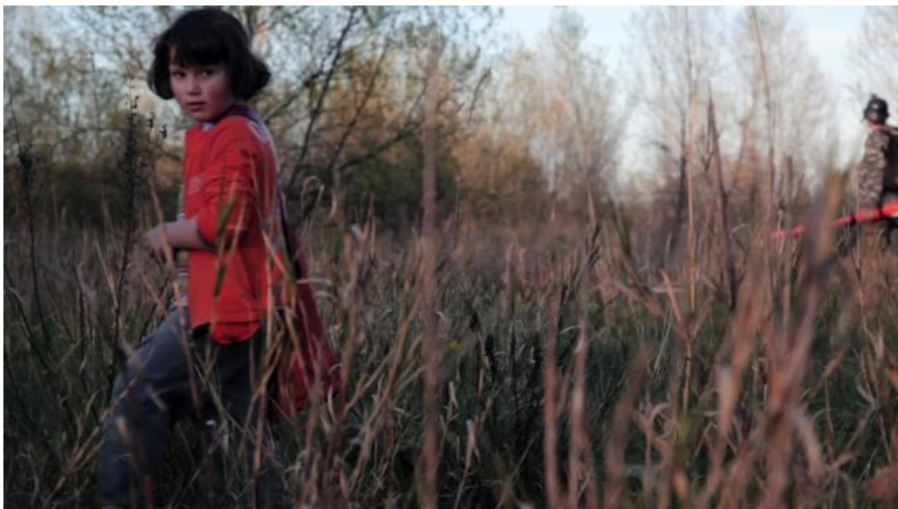
frame dal video di Zimmerfrei

Ecco il senso del film, dichiarato dalla direttrice del festival, Silvia Bottioli: lavorare sull'idea di città, cercando altre possibilità rispetto ai modelli consueti. E ora l'esperimento di Mutonia è a rischio: nell'assenza della politica, la causa di sgombero è andata avanti e a inizio estate è arrivata la notifica. In un modo usato spesso nel Nord Europa per smantellare comunità anomale: con ingiunzioni individuali, per cui non si può montare un caso politico, ma ognuno deve difendersi in proprio.