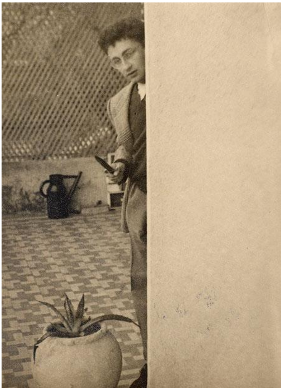
Cannes Villa Meteko, avant 1950

Un'ampia selezione di questo archivio, finora inedito, è collocato al centro della mostra Guy Debord. Un art de la guerre (fino al 13 luglio alla Bibliothèque nationale di Parigi), disposto su alte pareti trasparenti a spirale. Un maelstrom d'inchiostro. Debord, che aveva la precauzione di non sottolineare né annotare i libri che leggeva, trascriveva i passaggi che lo colpivano su diversi taccuini, divisi per soggetto: "Poésie etc.", "Machiavelli et Shakespeare", "Hegel", "Historique", "Philosophie, sociologie", "Marxisme", "Stratégie, histoire militaire". Le pagine di questi taccuini non costituiscono quindi un semplice cabinet de lecture né una mera sezione documentaria dell'esposizione, di quelle che ne riempiono i "parerga", sale cieche ai margini del percorso da vedere solo se restano tempo ed energie. Questa sala, da cui irradiano le singole sezioni di Un art de la guerre , ne è la macchina motrice, quasi un viaggio all'interno del cervello dello stesso Debord, che Philippe Sollers ha designato come "una biblioteca ambulante".