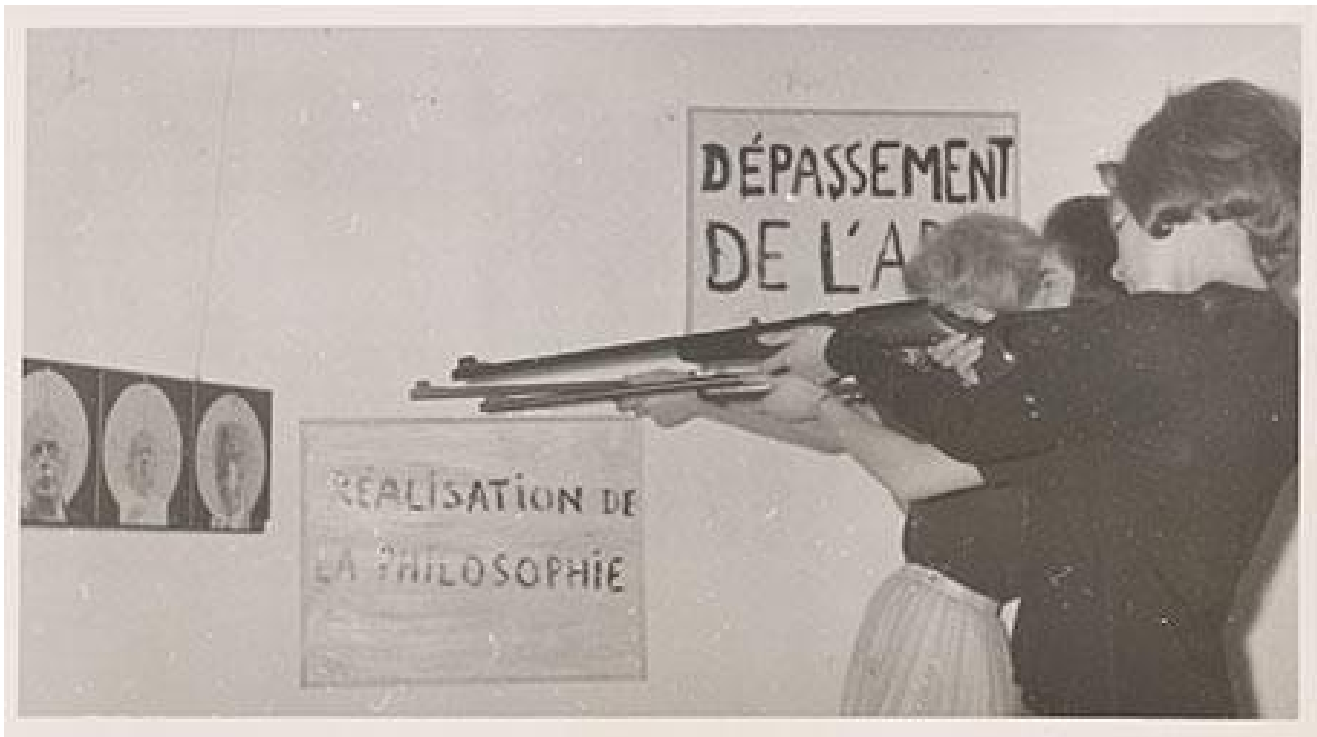
Destruktion RSG-6, Galerie EXI, Odense, giugno 1963

Questo visual turn sembra contraddire le intenzioni di Debord che, dopo la conferenza di Göteborg dell'agosto 1961, sente la necessità di ricalibrare gli obiettivi del movimento su un piano più politico – un putsch nella cultura. Lo spettacolo del rifiuto deve ora lasciar spazio a un più radicale rifiuto dello spettacolo. Guai a trasformare la distruzione dello spettacolo in un'opera d'arte.