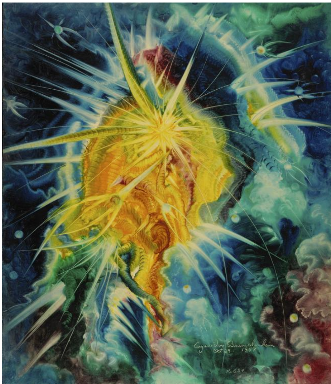
Eugene Von Bruenchenhein

La Biennale curata da Massimiliano Gioni rappresenta in questo senso un ulteriore passo verso l'ibridazione tra la tradizionale forma del museo e la mostra temporanea: del primo, nelle due sedi dell'Arsenale e dei Giardini, presenta la struttura nettamente profilata, la tendenza a stabilire percorsi obbligati in spazi rigorosamente ordinati, l'organizzazione discorsiva tanto più efficace quanto meno vistosa; della seconda, il ricorso costante alla sorpresa, al gioco degli accostamenti inediti, l'andamento rizomatico, l'esotismo intellettuale, un gusto insieme cool e sofisticato che tocca il suo apice nell'inclusione delle numerose figure di outsiders , negli accostamenti inusuali e nei recuperi inaspettati.