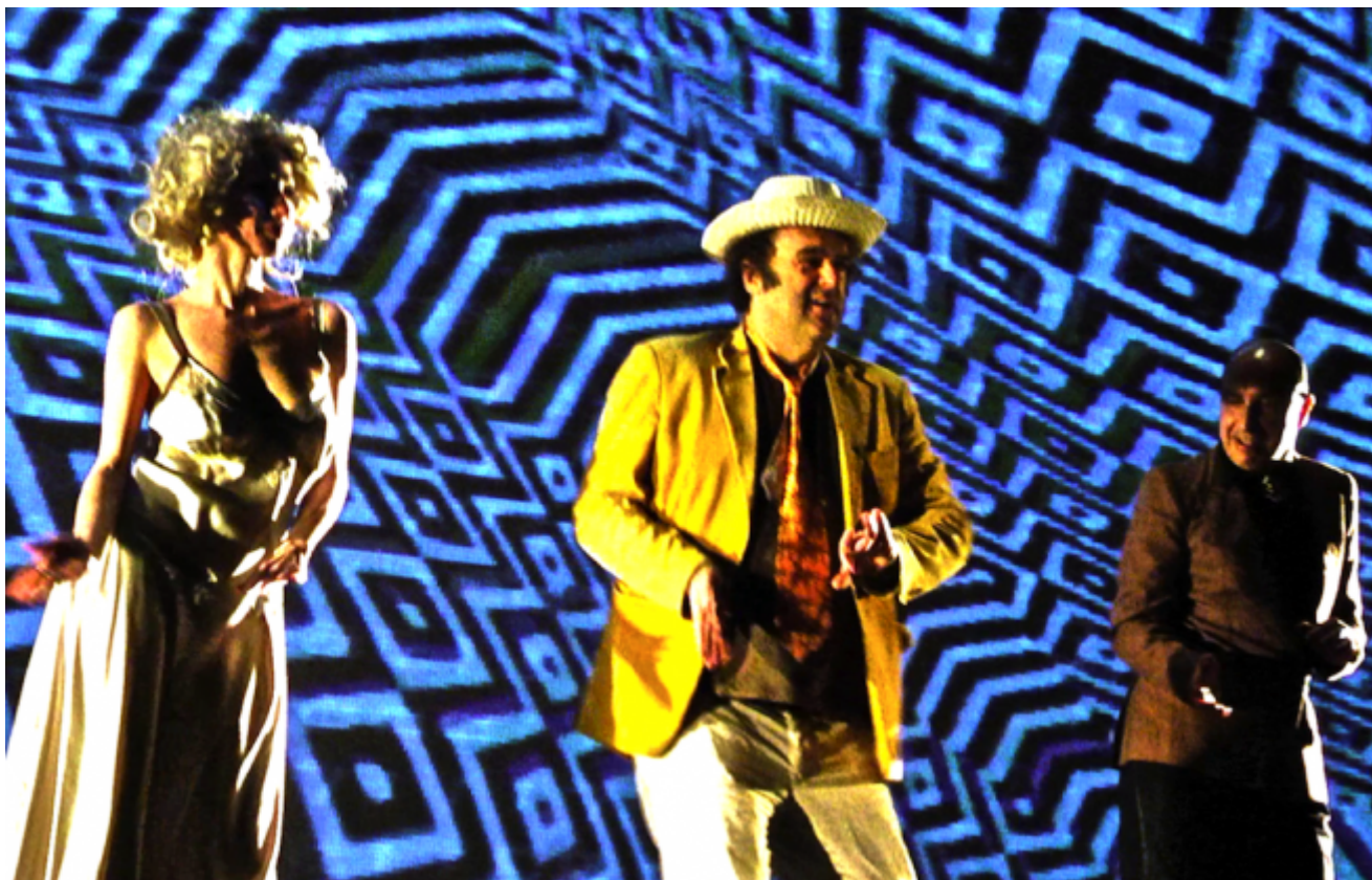
ph. di Mario Brenta e Karine De Villers

E poi, subito dopo, il circo e i ragionamenti riprendono, tra John Baez e l'utopia dei figli dei fiori, Oscar Wilde e il rock neo-melodico napoletano, i caroselli e i pensieri urlati a alta voce., la rivoluzione e il fallimento di ogni rivolta che non sia individuale come grida nel famoso Marat Sade di Peter Weiss, volti d'Africa e una disperata voglia di strappare il tempo al buio imminente.