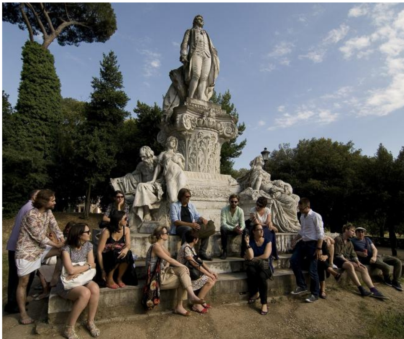
Promenades, 2012, ph. Giorgio Benni