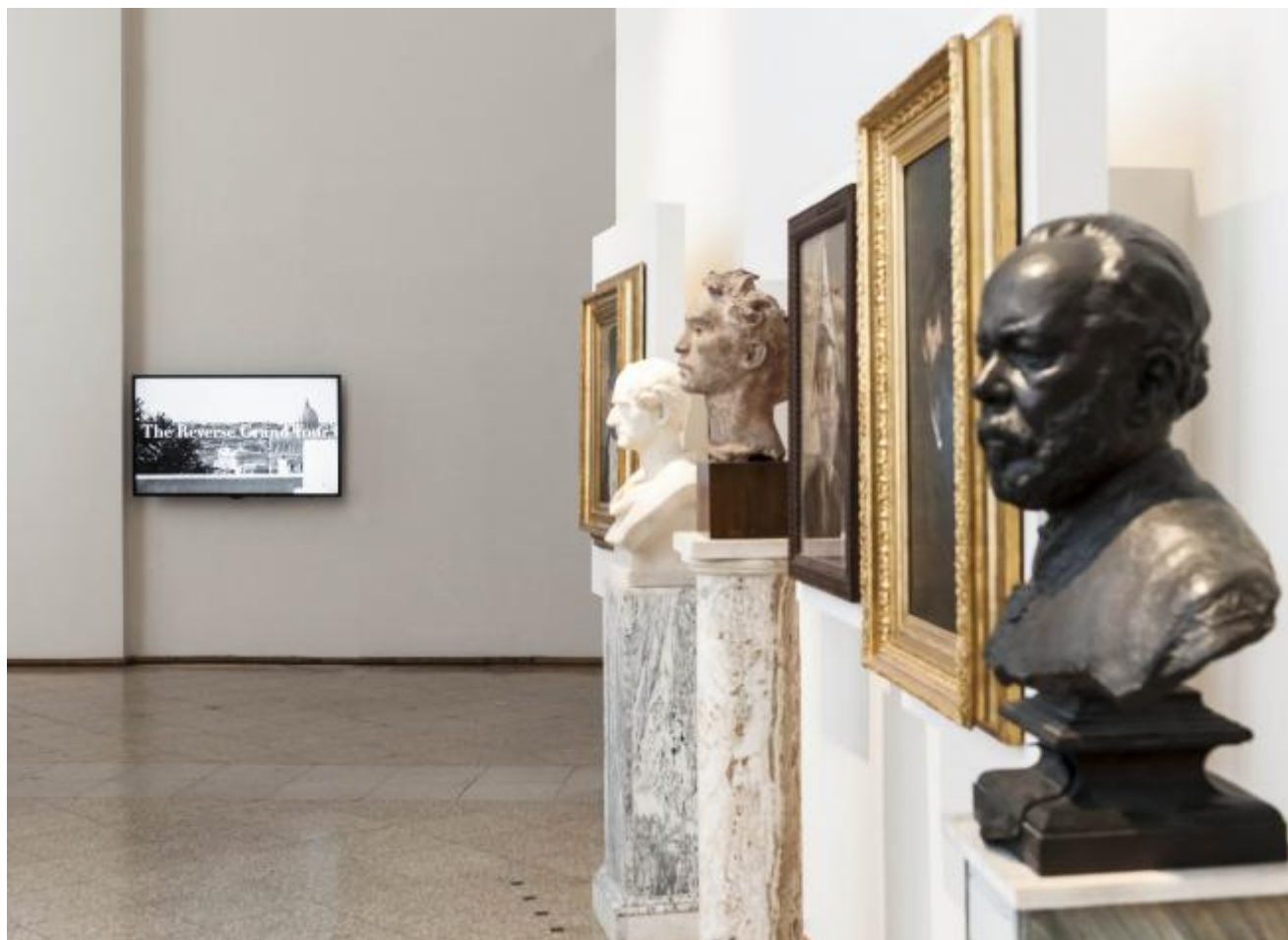
The Reverse Grand Tour, 2012, GNAM

Sembra esserci una soglia molto sottile tra il sistema teatrale, la narrazione e la messa in scena di certe confidenze, ma come avviene il passaggio dalla dimensione individuale a quella comunitaria?