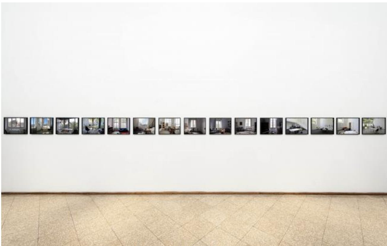
Vedute, 2012, GNAM, ph. Sebastiano Luciano

Al mezzo video, che come hai detto è la cifra stilistica che ti accompagna sin dagli esordi, hai poi aggiunto altre espressioni formalmente distinte, nelle quali fai confluire la tua ricerca: la fotografia, il libro d'artista e l'uso del neon come scrittura.