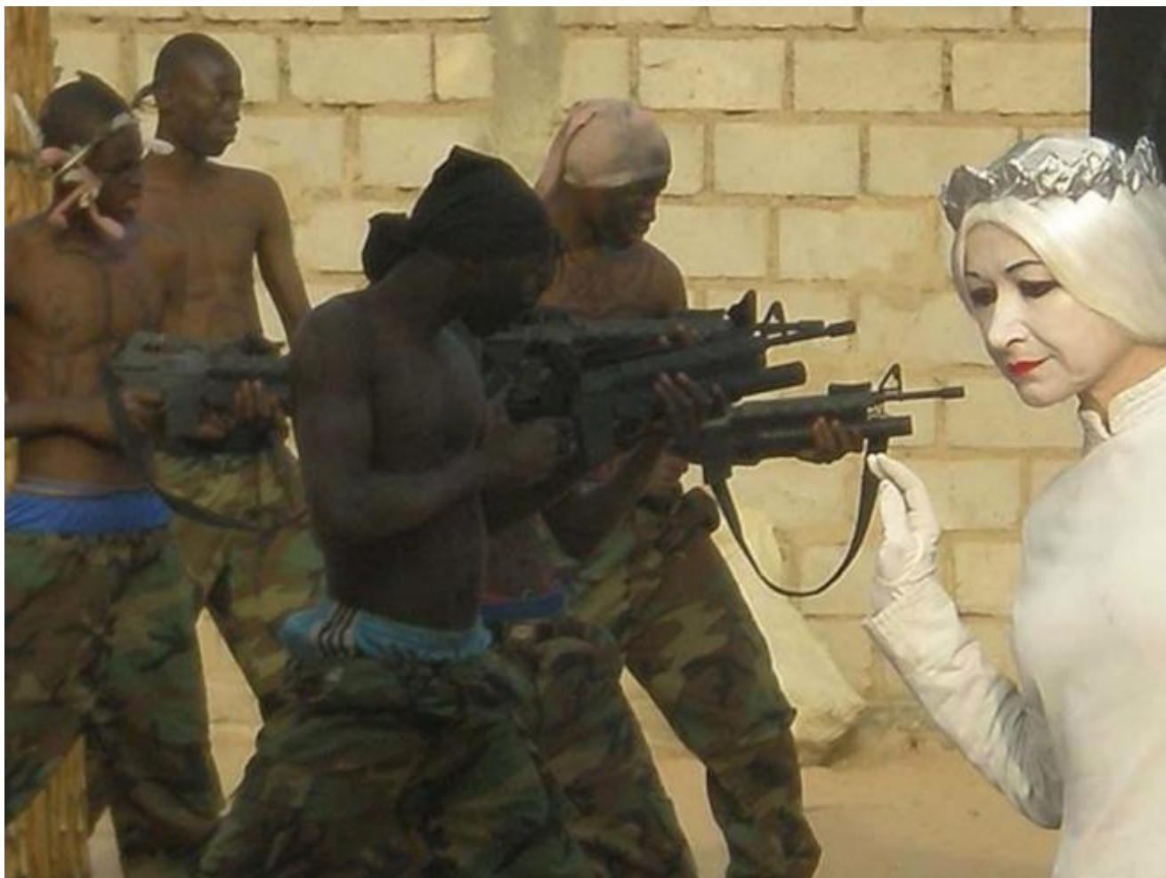
Ubu Buur.

La seconda parte, denominata Canzoniere , dall'andamento più rapsodico e tematico, parte da Campiano e affronta gli spettacoli al femminile dell'attrice, Rosvita , I Cenci , da Artaud, e quelli come L'isola di Alcina dove il dialetto diventa musica, suono, canzone, grido, i molteplici mirabolanti viaggi nell' Ubu roi , per il mondo, con adolescenti romagnoli, delle periferie di Chicago, senegalesi eccetera. Fino a Ouverture Alcina , riscrittura fantasmatica dell'altro lavoro dedicato a una reincarnazione paesana della maga di Ariosto, composto con linee di nitore ed essenzialità orientale.