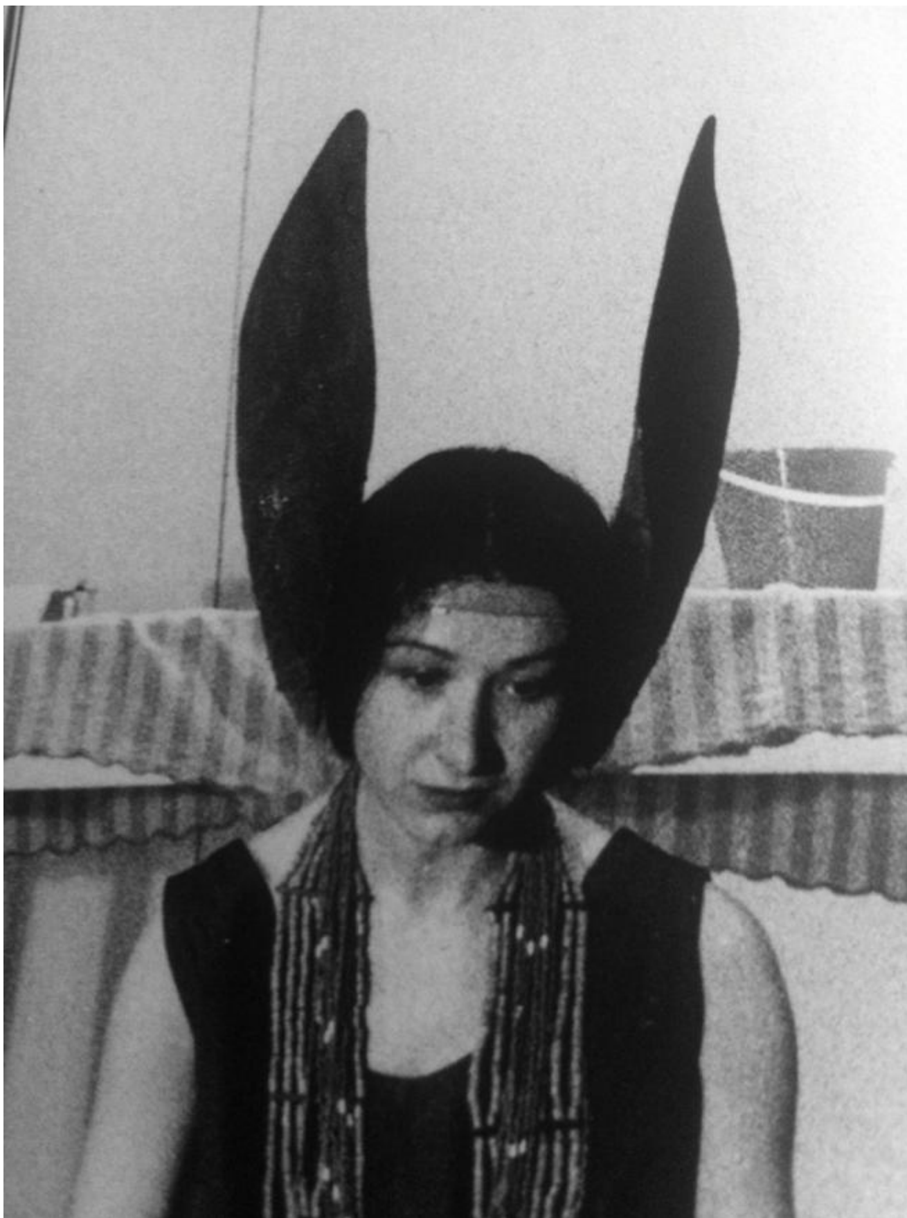
Siamo asini o pedanti.

Il centro, la chiave di interpretazione, sta a metà del volume, dopo una bella e ampia sezione fotografica che prova a ridare presenza a spettacoli svaniti nel tempo. Sta in quel paese di Campiano, nella campagna vicino