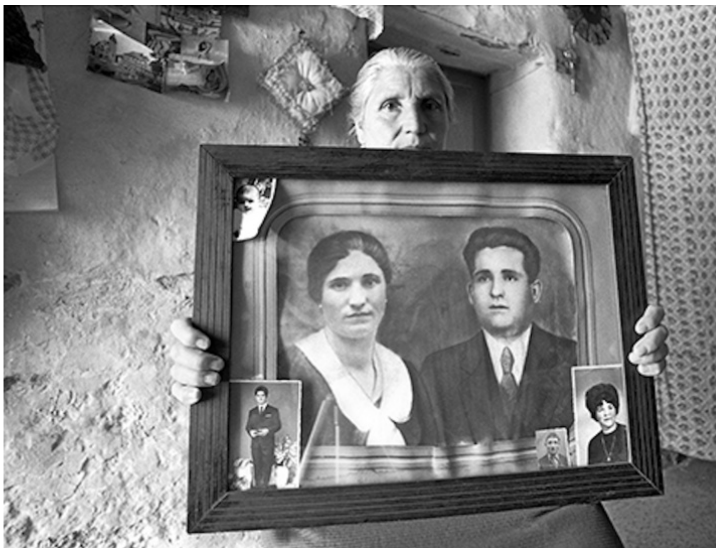
Dalla serie "Ritratti reali", Tricarico 1972.

EG: Partiamo dal tuo lavoro in Basilicata, a Tricarico e Matera. Ci sei andato già nel 1967, poi sei tornato nel '70 e hai iniziato un'investigazione che ti chiedo di descrivere. Ho pensato di iniziare da qui per mostrare come un lavoro sul territorio con un'apparenza documentaria in realtà ha altre valenze estetiche. Ma, prima di tutto, c'era un interesse etnografico da parte tua?