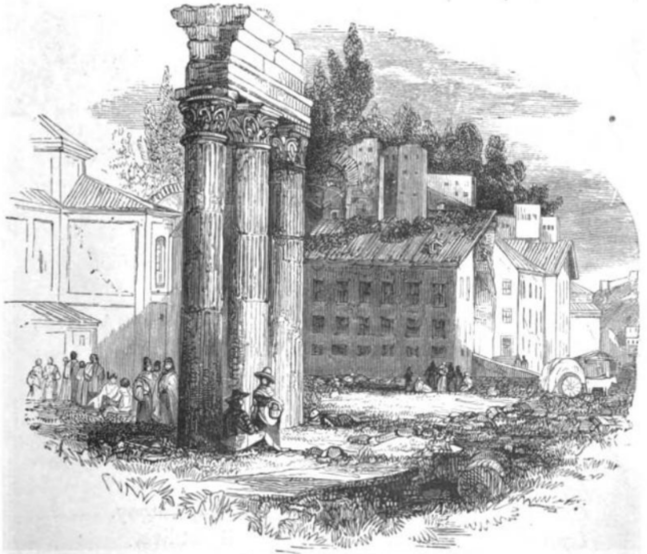
SITE OF THE ROMAN FORUM.