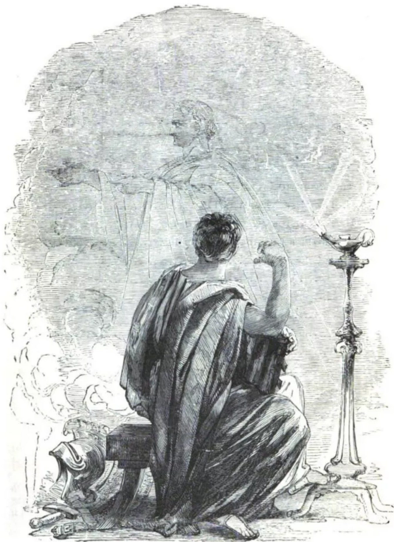
[Act IV., Scene 3.]