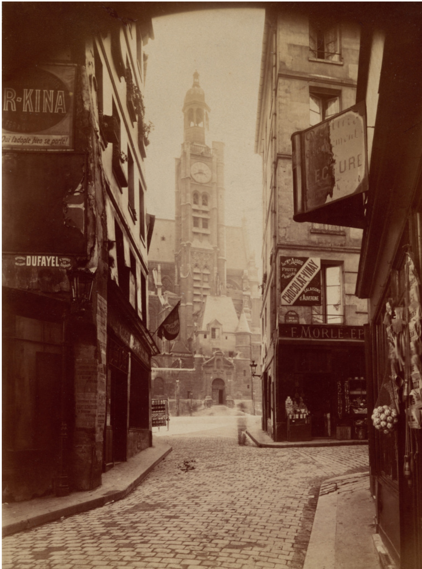
St. Étienne du Mont, rue de la Montagne Sainte Geneviève (St. Étienne du Mont, Montagne Sainte Geneviève Street), Eugène Atget, 1898.