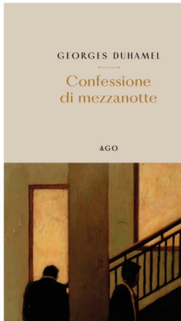
Copertina del libro nell'edizione francese, 1920 e copertina del libro nell'edizione italiana, 2023.

Georges Duhamel, nato nel 1884, scomparso nel 1966, medico-scrittore. Come Céline, Cechov, Bulgakov, Schnitzler. Dopo gli studi e l'esperienza di chirurgo al fronte nel conflitto mondiale, si converte alla letteratura, praticando così due solitudini: quella davanti alla pagina e quella sopra il ventre aperto del paziente. Poeta, romanziere, critico. Illustre uomo di lettere e vincitore del premio Goncourt con Civilisation , reportage autobiografico della Grande Guerra, Duhamel è considerato una voce autorevole della cultura francese, ma il suo riconoscimento ha avuto fasi alterne. Dopo la notorietà nel periodo tra le due guerre, negli anni Cinquanta è stato relegato in una posizione marginale, per essere infine riscoperto solo dagli anni Novanta. Ecrivain engagé , si direbbe, impegnato nel promuovere l'umanesimo contro i pericoli dell'era tecnocratica, spesso mostrando una chiusura eccessiva verso le novità del pensiero e dello stile. E forse proprio questa ostilità verso il contemporaneo lo allontanerà dal pubblico e gli negherà la stima della nuova generazione di scrittori (ad esempio Yves Berger, Paul Léautaud, Gilles Rosset). Gli si rimproverava l'anacronismo. E di aver scritto troppo, troppo in fretta. Di parlare da moralista brontolone. Di essere troppo prudente, mai schierato, borghese in senso sociale. Soprattutto, il suo richiamo all'amicizia e alla vita interiore pareva ridicolo di fronte a una società lacerata dalle trasformazioni.