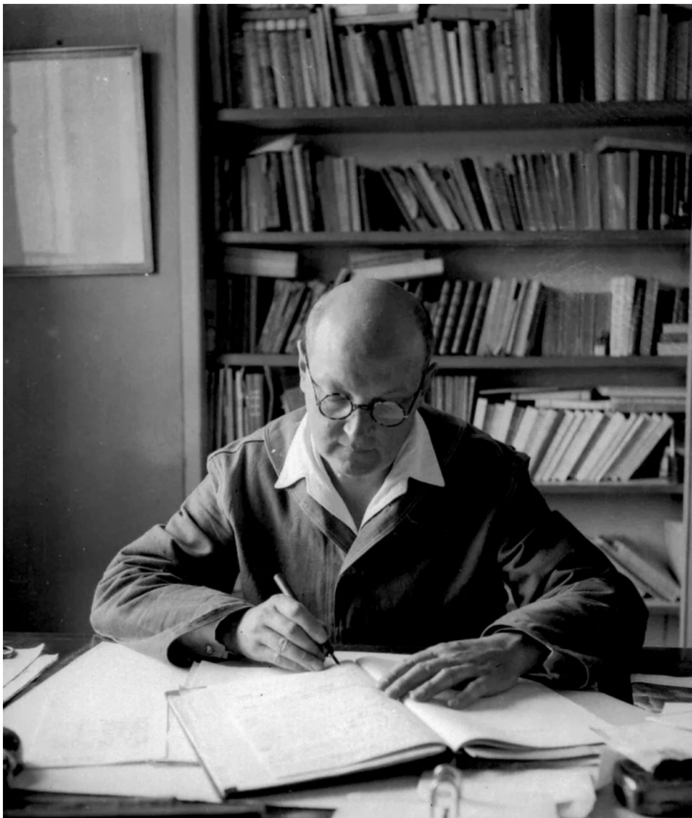
Georges Duhamel, ottobre 1932

E tuttavia, anche le posizioni più critiche concordano su un punto: Salavin è un personaggio memorabile. Vive e sopravviverà. I suoi tormenti sono i nostri, allora come oggi; con lui Duhamel rivela un raro talento nell'esplorare gli snodi complessi della soggettività.