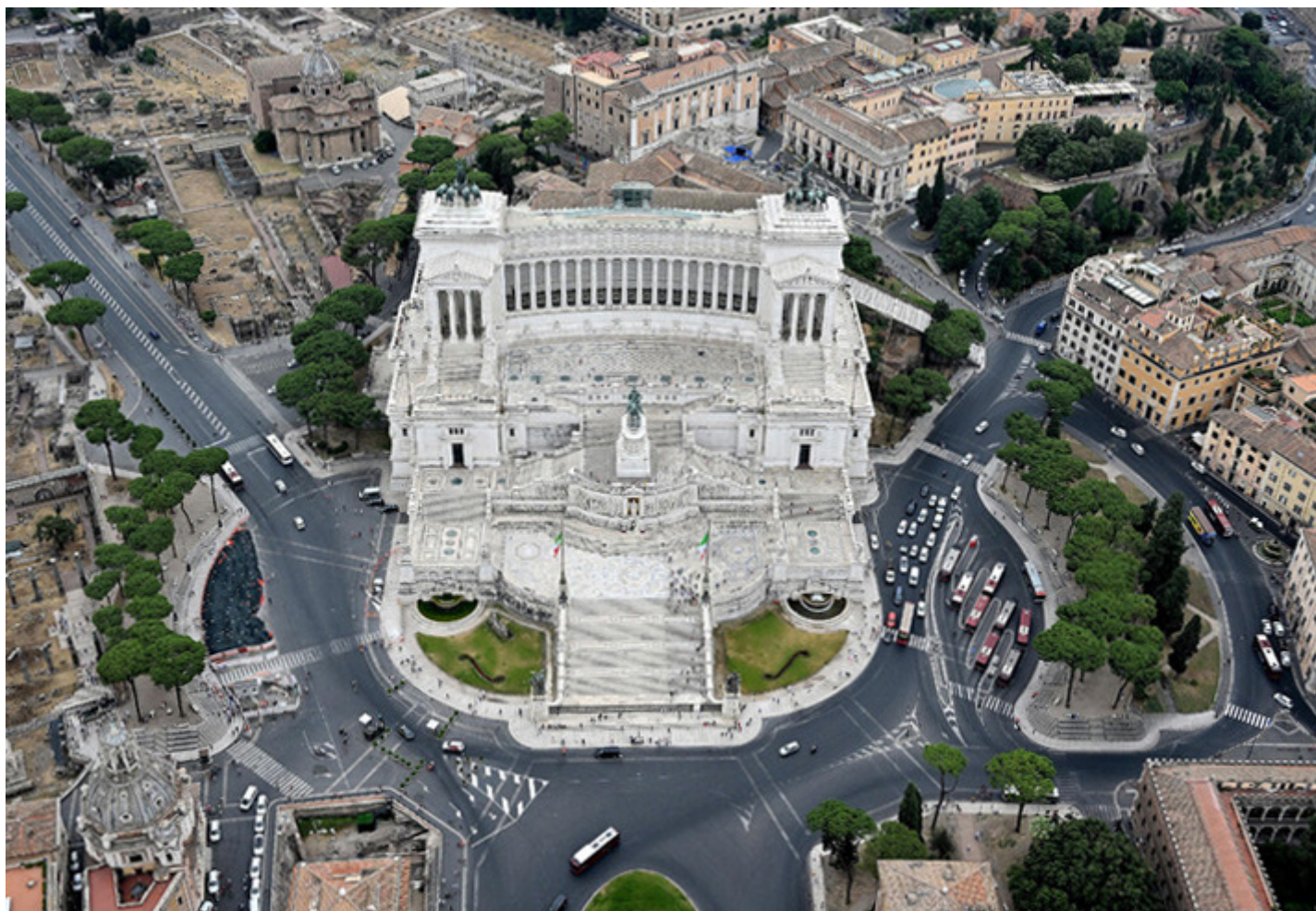
Giuseppe Sacconi, Monumento nazionale a Vittorio Emanuele II , 1895-1935 [inaugurato il 1911]. Roma, piazza Venezia.

Uno dei monumenti neoclassici ben inseriti nello spazio architettonico è il bronzo Napoleone Bonaparte come Marte pacificatore realizzato da Antonio Canova nel 1811, che però precede i moti risorgimentali e la loro statuaria. Dal centro del cortile d'onore del palazzo di Brera a Milano, la statua, fusa utilizzando il metallo dei cannoni dismessi di Castel Sant'Angelo, irradia una maestosa armonia che trova corrispondenza nella composizione architettonica dell'edificio. Non tutti i monumenti dialogano bene con l'architettura e l'urbanistica, per esempio l'ingombrante complesso architettonico del Vittoriano eretto per celebrare Re Vittorio Emanuele II e con lui l'intera stagione risorgimentale.