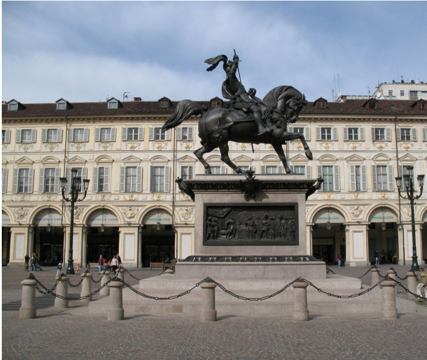
Carlo Marochetti, Emanuele Filiberto di Savoia , detto “Testa ’d Fer”, 1838. Torino, piazza San Carlo.

dalla Testa 'd Fer , fusa in bronzo su base di granito rosa di Baveno. Realizzata dallo scultore Emanuele Marochetti nel 1838, la statua equestre di Emanuele Filiberto di Savoia, eretta in piazza San Carlo a Torino, viene descritta dagli autori in questo modo: «È un monumento che ancora affascina per quel gesto imperioso e regale del duca nel rinfoderare la spada sul precario equilibrio del destriero, tanto focoso quanto improbabile». La scrittura ha un tono elegante e colto, andato perso con i significati delle statue, che formano una popolazione muta, forse ammutolita dall'insipienza dei passanti che le ignorano. Chi mai sarà quel cavaliere o quella figura in finanziaria assorta nei suoi pensieri?