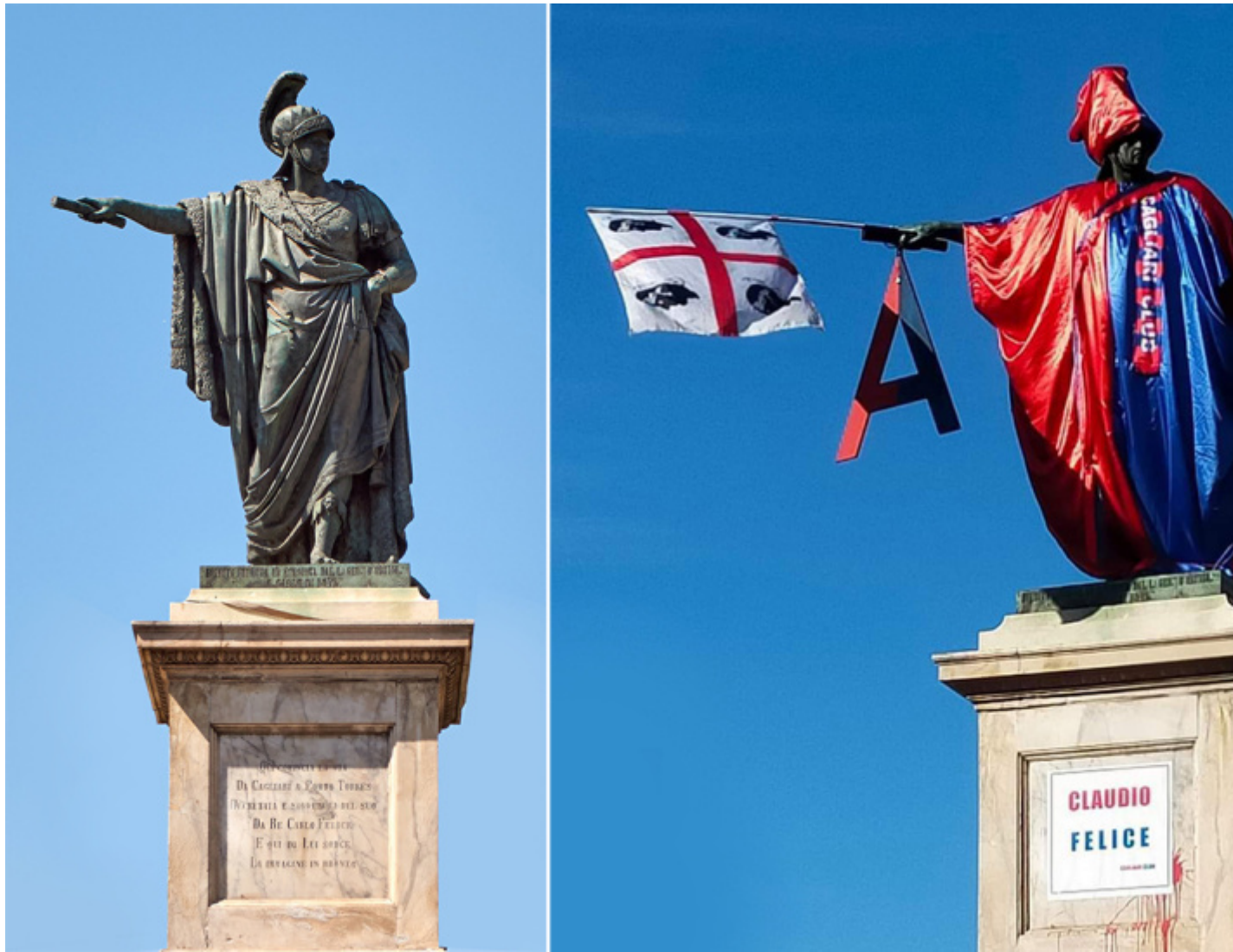
Andrea Galassi, Carlo Felice di Savoia , 1833. Cagliari, piazza Yenne / La statua ricoperta da bandiere del Cagliari Club per la promozione in serie A nel 2023. Con la destra regge una bandiera dei Quattro Mori.

Reale. Nel 2012 gli indipendentisti la ricoprirono con un telo bianco e bandiere con i Quattro Mori. Ora celebra le vittorie calcistiche del Cagliari. La scultura resta, ma la narrazione cambia e con essa il suo significato.