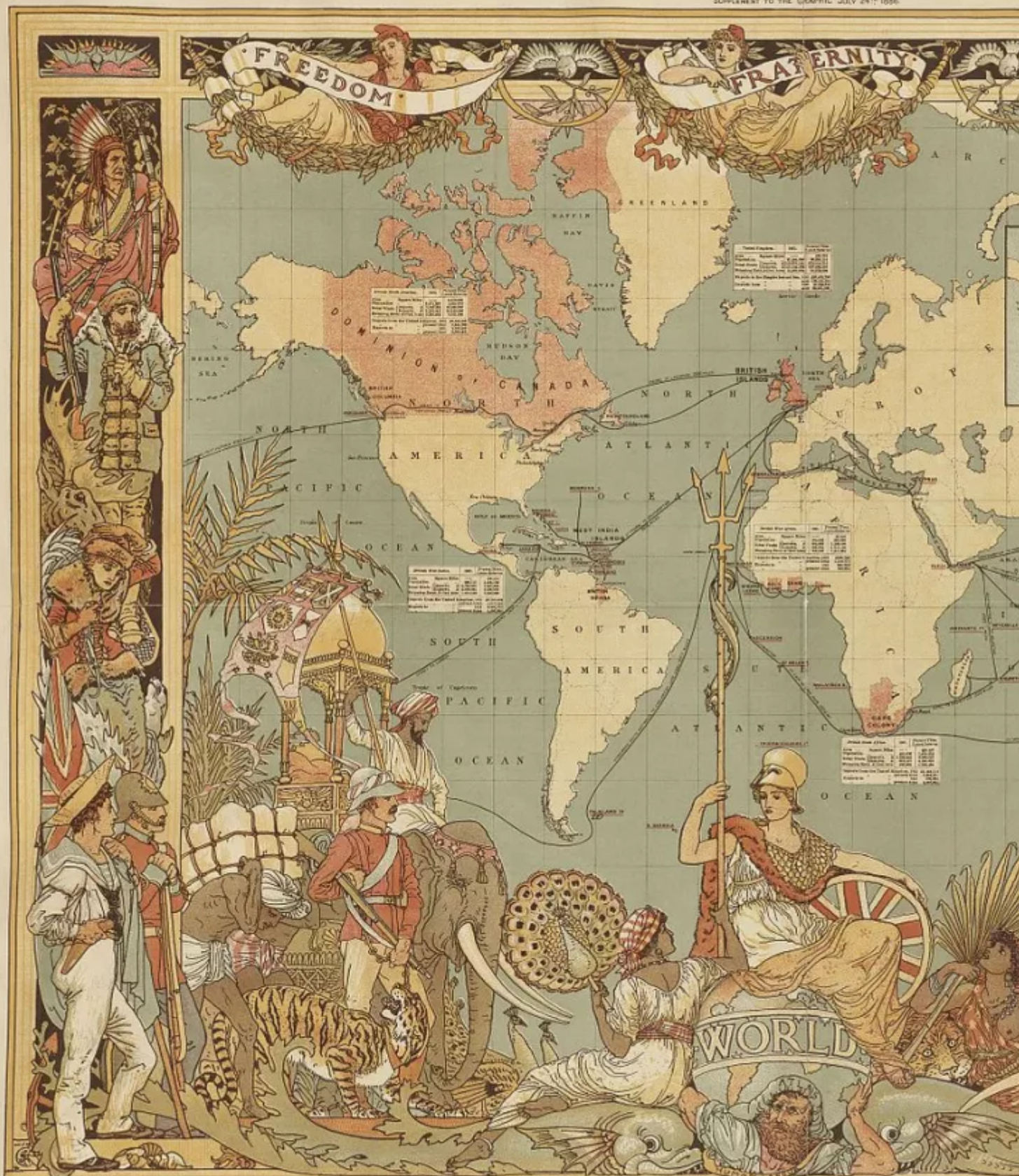
IMPERIAL FEDERATION: MAP OF THE WORLD SHOWING THE EXTENT OF THE BRITISH EMPIRE. STATISTICAL INFORMATION FURNISHED BY CAPTAIN J. C. R. COLING, M.P. FOR KENNERLY R.M.A. BRITISH TERRITORIES