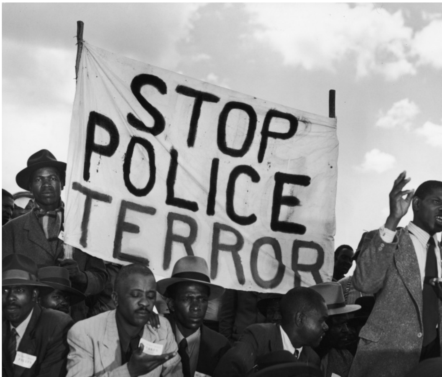
Margaret Bourke-White, Striscione sudafricano “Stop al terrore della polizia” durante un discorso nell’ambito della seconda riunione comunista, 1950, Margaret Bourke-White/The LIFE Picture Collection/Shutterstock.

La grande mostra che celebra la fotografa, Margaret Bourke-White. L’opera 1930-1960 , è curata da Monica Poggi e conta più di 150 immagini, arricchendo il percorso già ben tracciato da Camera legato alla storia delle reporter più importanti della storia della fotografia (ricordiamo le passate su Eve Arnold, Dorothea Lange, Gerda Taro).