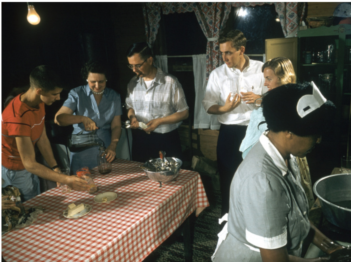
Margaret Bourke-White, In cucina, una donna versa bevande da una brocca di vetro per i membri della sua famiglia mentre una cameriera lava i piatti, Greenville, Carolina del Sud, 1956