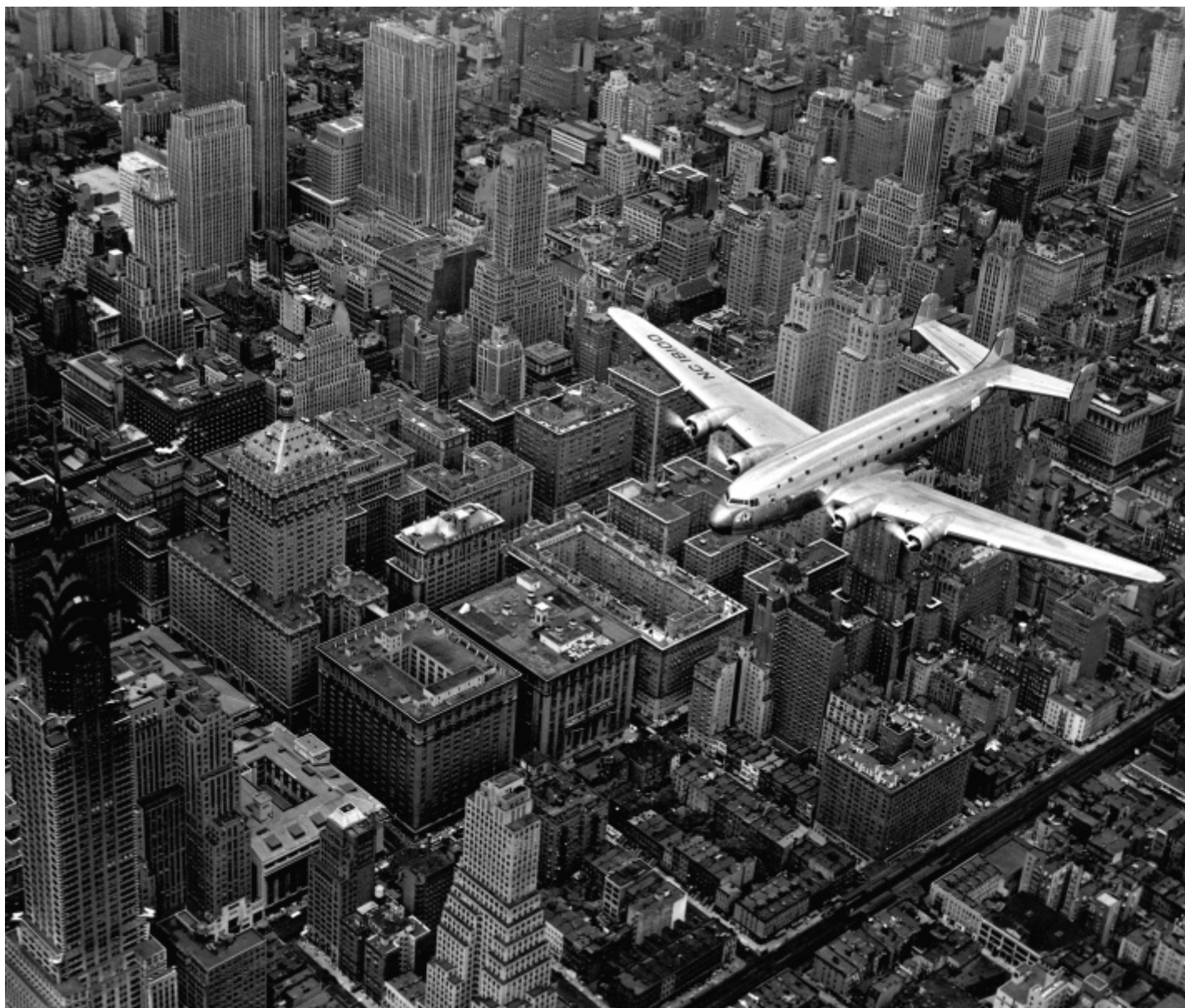
Margaret Bourke-White, Veduta aerea di un aereo passeggeri DC-4 in volo su Midtown Manhattan, New York City, 1939, Margaret Bourke-White/The LIFE Picture Collection/Shutterstock.

Nella sua lunga carriera, bruscamente interrotta negli anni Cinquanta a causa dell'insorgere del morbo di Parkinson, Bourke-White è stata portavoce degli accadimenti più significativi del suo tempo: dai primi attacchi bellici tedeschi contro l'Unione Sovietica, alla liberazione del campo di concentramento di Buchenwald, dalle insurrezioni contro l'apartheid in Sudafrica ai funerali di Mahatma Gandhi, nel 1948. Come fu, anche, ritrattista enfatica e a volte profondamente critica del proprio Paese, dilaniato da divari sociali ed economici. L'ossimoro sostanziale di cui è pervaso l'organismo statunitense è sotto gli occhi di tutti, d'altronde: sotto un cartello che dichiara che l'America possiede "Lo standard di vita più alto del mondo" ("World's Highest Standard of Living!") una fila di afroamericani sfollati a causa delle alluvioni aspetta viveri e vestiti in un'immagine del 1937. Un parallelismo diretto, questo, con quanto si è visto di recente nelle sale di Camera a proposito del lavoro di Dorothea Lange, là dove i lavoratori costretti a migrare in California a causa della Dust Bowl si vedevano sormontati dalle pubblicità sulla comodità del viaggio su rotaie: "Next time try the train!" (La prossima volta prova il treno!).