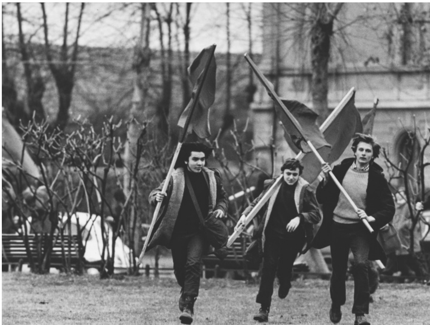
Uliano Lucas, Piazzale Accursio, Milano, 1971.