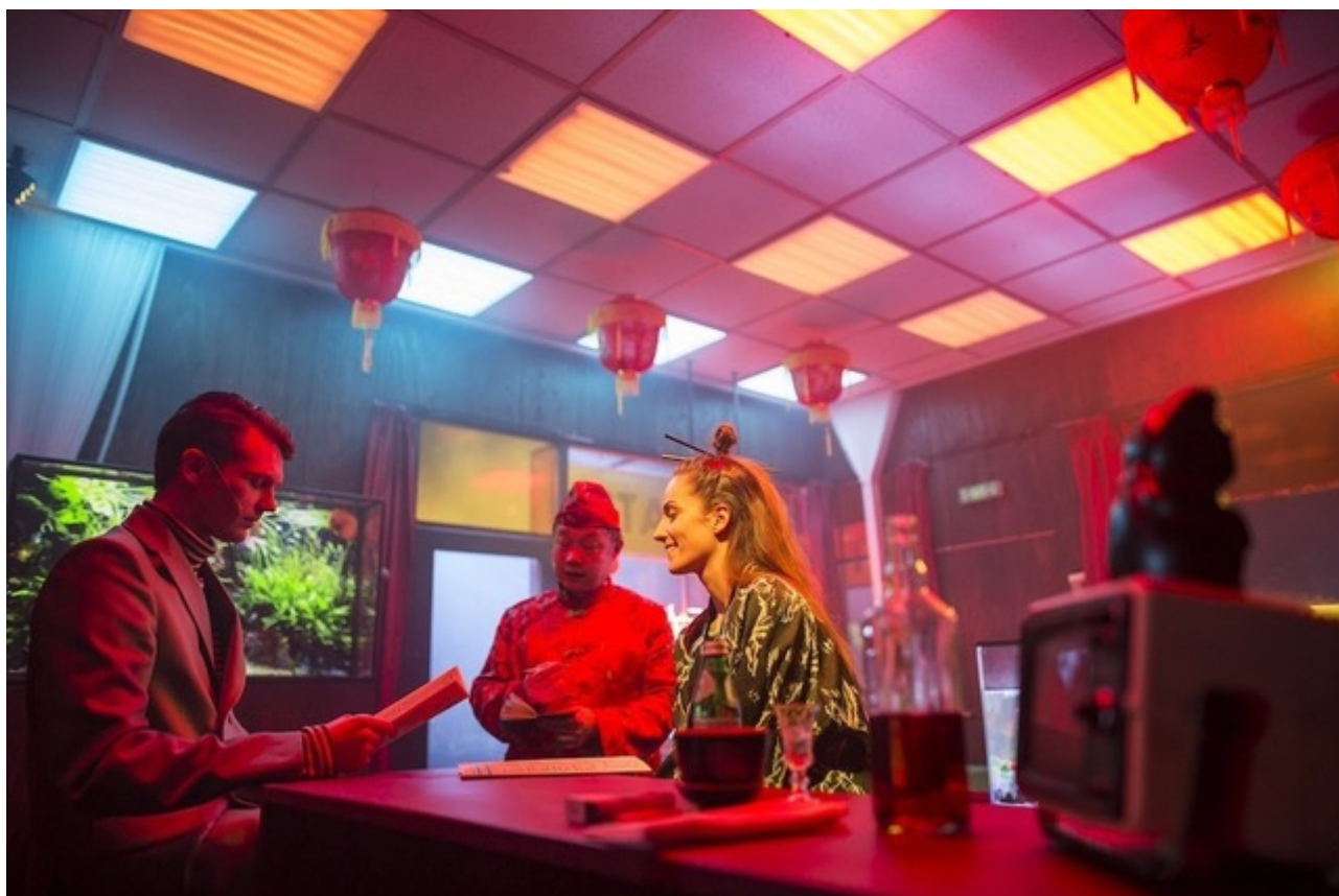
Rohtko, foto di Arturs Pavlovs.

schermi, due dei quali posti ai lati del palco e uno, mobile, a sovrastare tutta la scena. È su questi schermi che sono proiettate le riprese live di quanto accade sul palco: quattro cameramen seguono con acribia le azioni e i volti di uno straordinario gruppo di interpreti, e al contempo restituiscono i dettagli – le stoviglie, il vapore che si solleva dalle pietanze calde, le ombre delle vetrofanie sui tavoli di formica – dell’iperrealistico interno di un ristorante cinese a New York, osservato ora negli anni Sessanta del trionfo dell’espressionismo astratto, ora nei primi decenni di un nuovo millennio ipercapitalista. Eseguito in diretta, il montaggio delle varie sequenze costruisce un film enigmatico, in cui piani temporali differenti si accostano tra loro; al contempo, sul palcoscenico è un teatro antico e sempre nuovo a realizzarsi, secondo le proprie regole di prossemica e movimento, di recitazione e gesto, di macchinaria e artigianato. “Il trucco si può anche vedere, e forse è bene che lo si veda, ma nello stesso tempo l’illusione dev’essere proprio stupefacente”, annotava Tony Kushner negli appunti per la messinscena di Angels in America , e l’arte di Twarkowski mostra ogni proprio inganno, rivela ogni singolo dispositivo umano e tecnico necessario a realizzare un’opera-mondo di fronte alla quale si prova un genuino senso di incanto bambinesco.