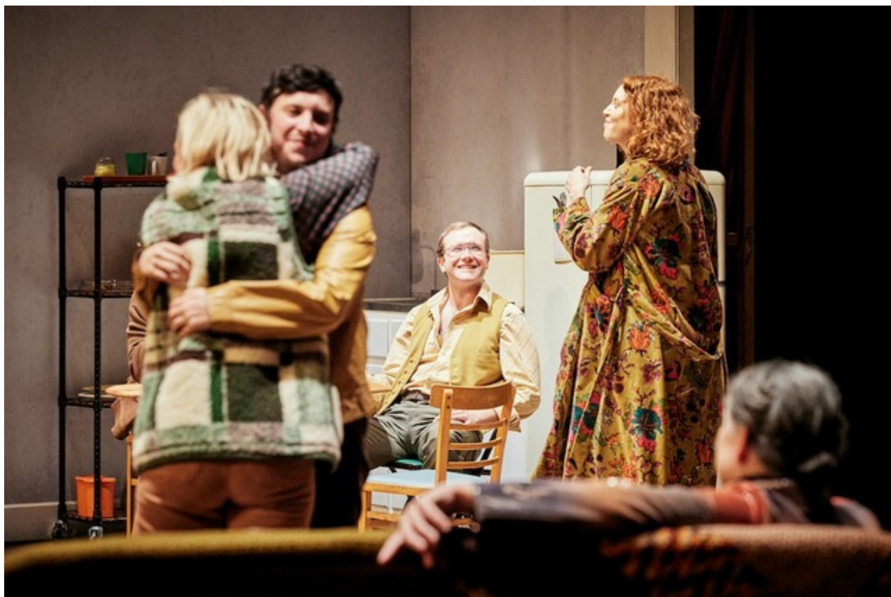
The Confessions, foto di Christophe Raynaud De Lage.