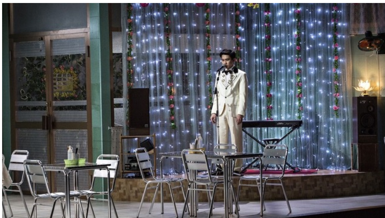
Saigon