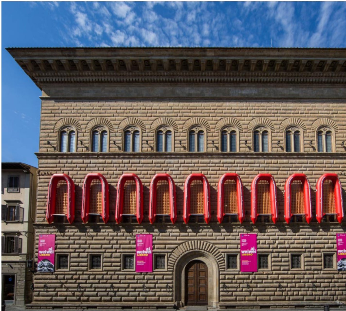
Ai Weiwei, Ai Weiwei. Libero , 2016, Palazzo Strozzi, Firenze.

Crede negli interventi artistici al di fuori delle mura del museo? Se sì, quale senso attribuisce loro?