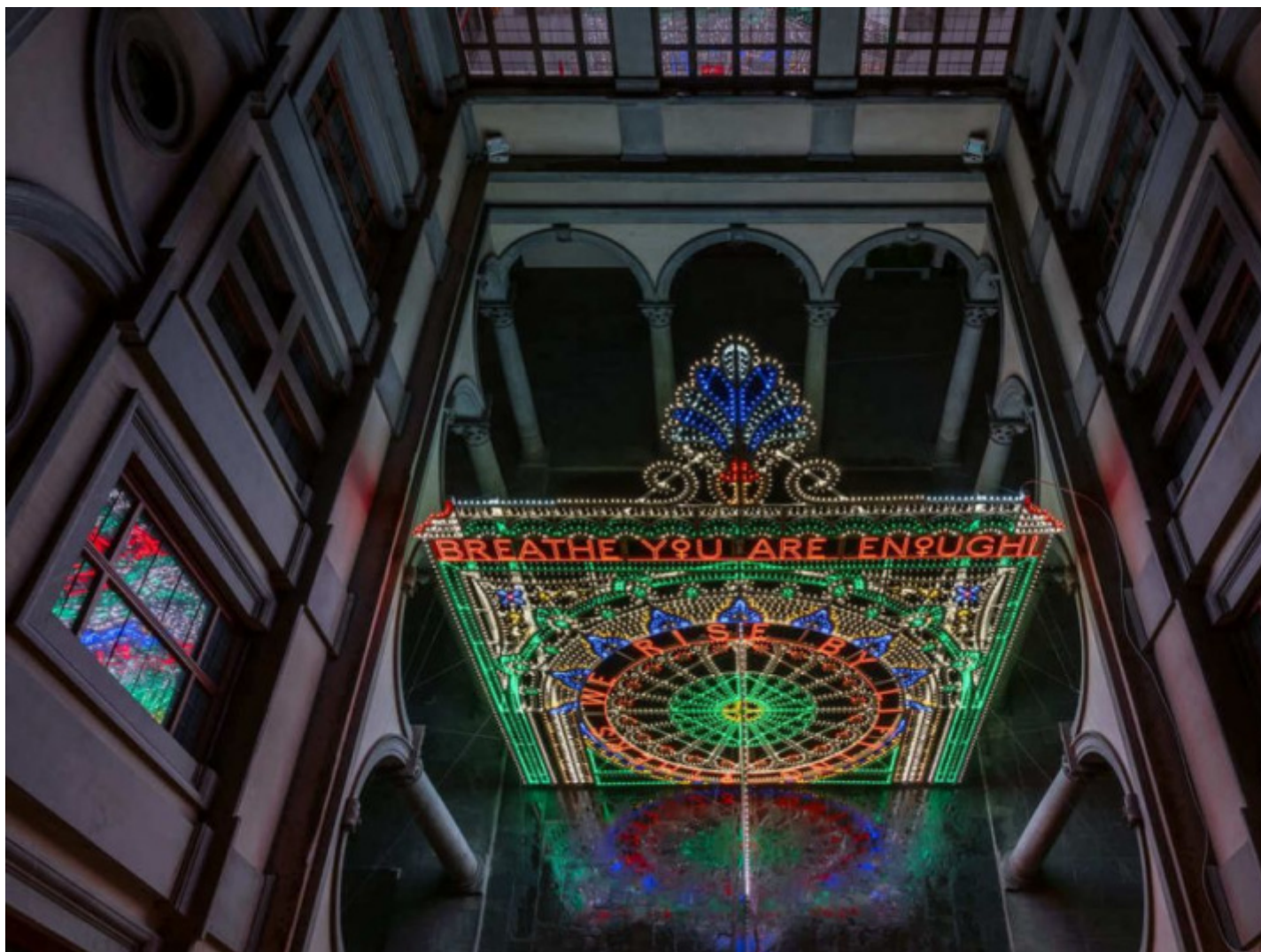
Marinella-Senatore, We rise by lifting others , 2021, Palazzo Strozzi, Firenze.

Si parla molto di ampliare le condizioni di accesso al museo. Come interpreta questa espressione?