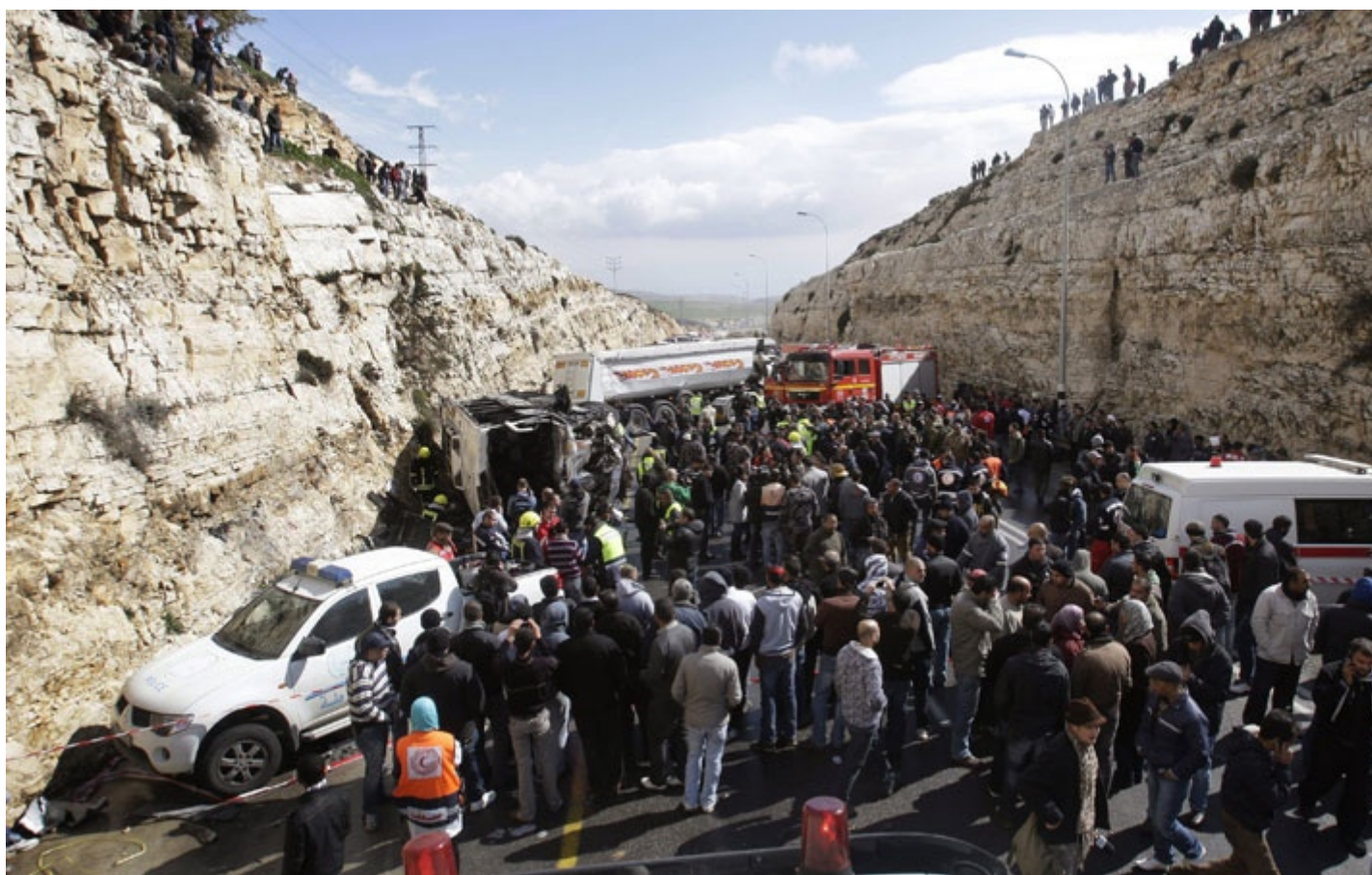
16 febbraio 2012 Jaba Road, la scena dell'incidente.