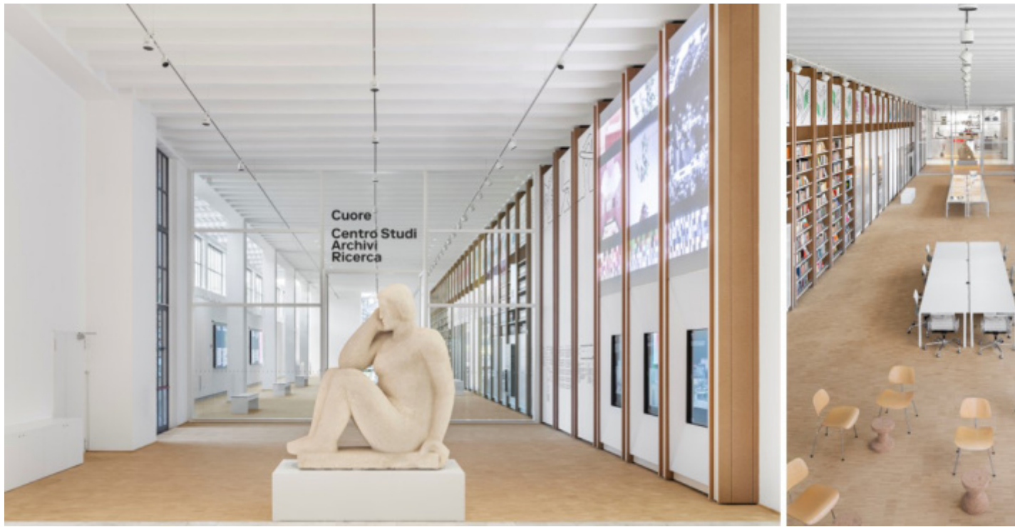
Milano, Palazzo dell'Arte, la nuova sede degli Archivi della Triennale, denominati Cuore - Centro studi, Archivi, Ricerca .

È proprio dagli Archivi della Triennale che sono stati tratti i documenti che hanno permesso ai loro autori di scrivere due libri da poco pubblicati per celebrarne i cento anni: