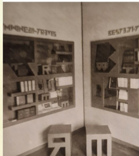
Fortunato Depero, Architettura Tipografica, Padiglione del libro Treves e Bestetti Tuminelli, III Biennale (1927).

A proposito del manifesto di Michele Cascella e Marcello Nizzoli per la IV Biennale del 1930, Piazza ci racconta che “La parte dedicata ai testi è festosa senza rompere l’eleganza formale del manifesto. Il ritmo è dato dalla scelta dei caratteri tipografici (molto probabilmente in legno) geometrici di gusto déco, composti in maiuscolo. Decorativi nel loro disegno, dove molte lettere sono tutte piene, senza gli abituali vuoti, sono come tessere sagomate. [...] E, molto ingigantito, l’arco sembra essere un’anticipazione della facciata di ingresso del Palazzo dell’Arte che verrà inaugurato a Milano” tre anni dopo.