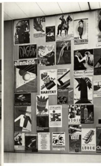
V Triennale, 1933, vedute della mostra della Sezione della Germania, organizzata dalla Deutscher Werkbund di Berlino e dedicata all’arte grafica industriale.