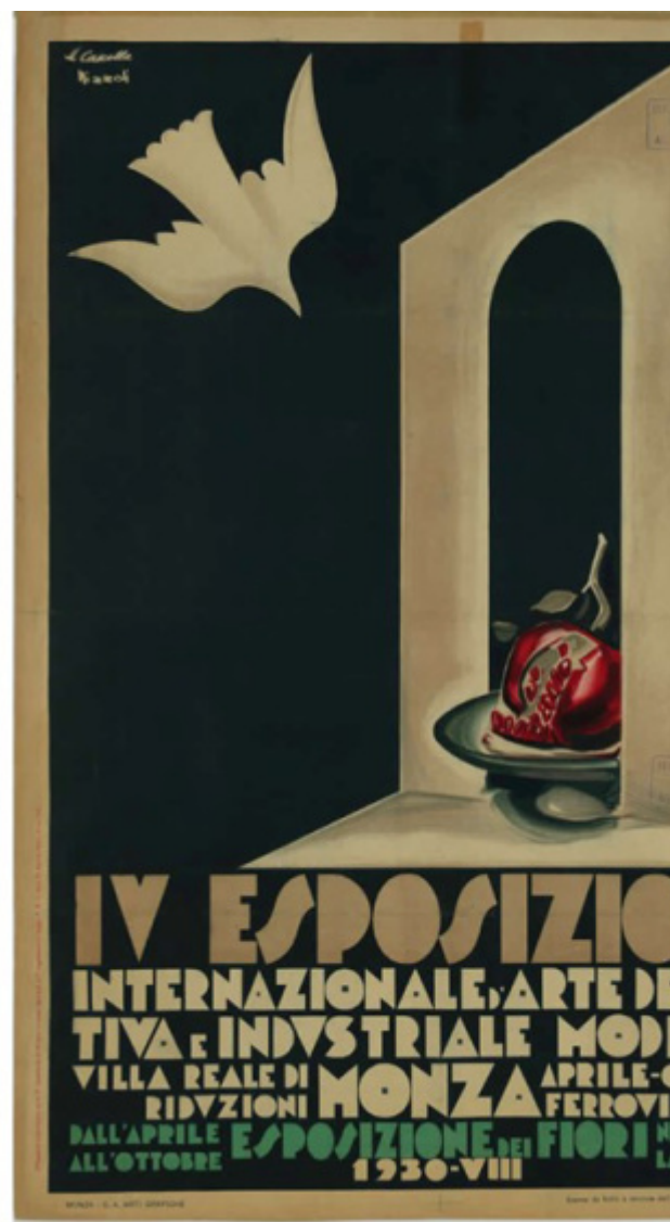
Aldo Scarzella, manifesto della I Biennale delle Arti Decorative, Monza 1923. Michele Cascella e Marcello Nizzoli, manifesto della IV Biennale di Arti Decorative, Monza, 1930.

Nelle note di commento che accompagnano i ventitré manifesti, l'autore non si limita ad una lettura iconografica di ciascuno di essi, bensì si addentra nei segreti della loro realizzazione tecnica fornendo al lettore informazioni, altrimenti introvabili, sui caratteri tipografici scelti dal singolo autore, sulla loro storia e sulle regole compositive che presiedono alla loro impaginazione, facendo di questo libro non soltanto un testo di storia dell'arte e del gusto, ma anche, e soprattutto, una sorta di manuale di storia del carattere tipografico, del lettering, e, più in generale, del linguaggio grafico.