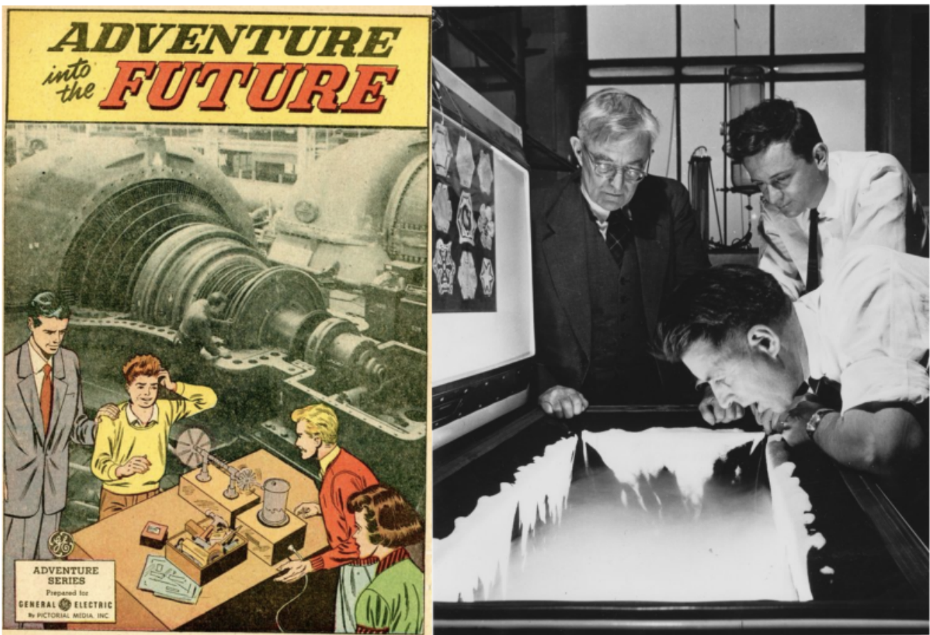
Il premio Nobel Irving Langmuir (con gli occhiali), Bernard Vonnegut e Vincent Schaefer osservano il processo di creazione di neve artificiale nei laboratori della General Electric che, all'epoca, pubblicava una rivista a fumetti, "Avventure nel futuro", per spingere i giovani a interessarsi di scienza.

in perfetto stile americano, con una casa, un giardino, un piano pensionistico, una cucina piena di elettrodomestici GE.