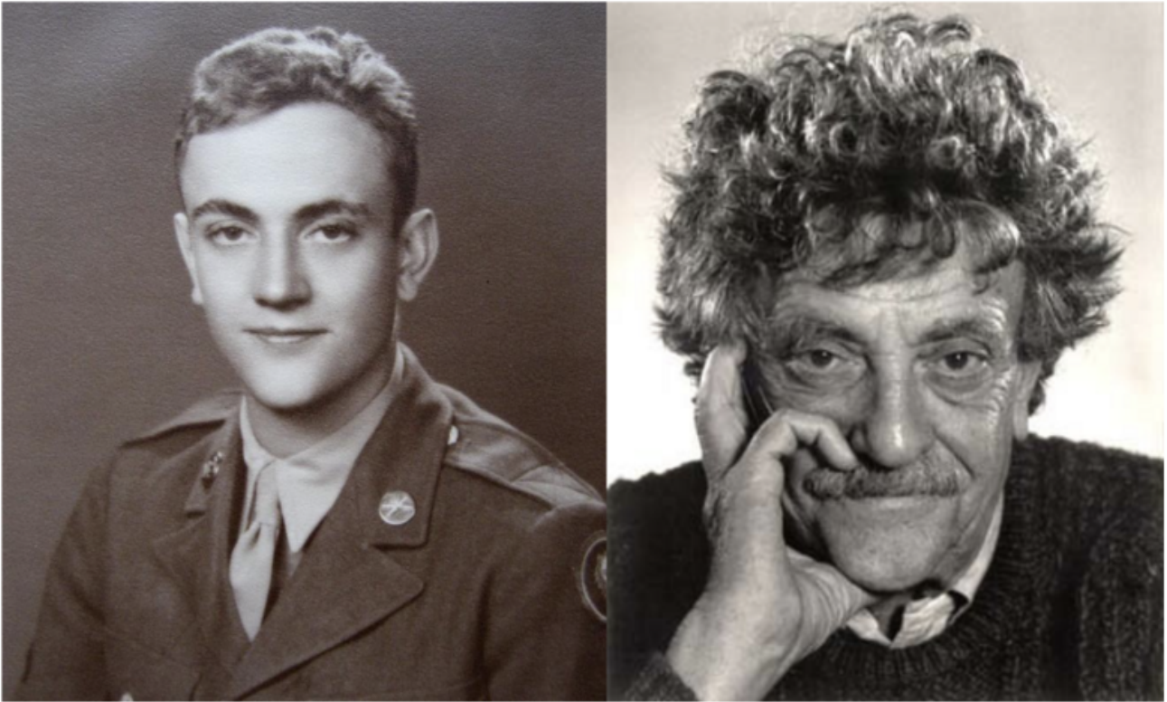
Kurt Vonnegut, durante la guerra, aveva prestato servizio come esploratore del reparto di Intelligence e Ricognizione del 106° Fanteria.