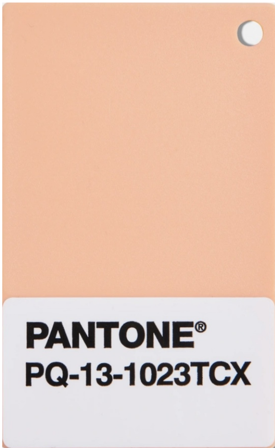
Peach Fuzz 13-1023.

La proposta del colore dell'anno da parte della ditta di colori Pantone.Inc, fondata negli anni Sessanta negli Stati Uniti ( ne abbiamo parlato per il Greenery del 2017 ), determina una serie di scelte non solo nelle aziende partner ufficiali dell'azienda per il 2024 – nel campo del design Motorola, dei cosmetici Shades By Shan, dei