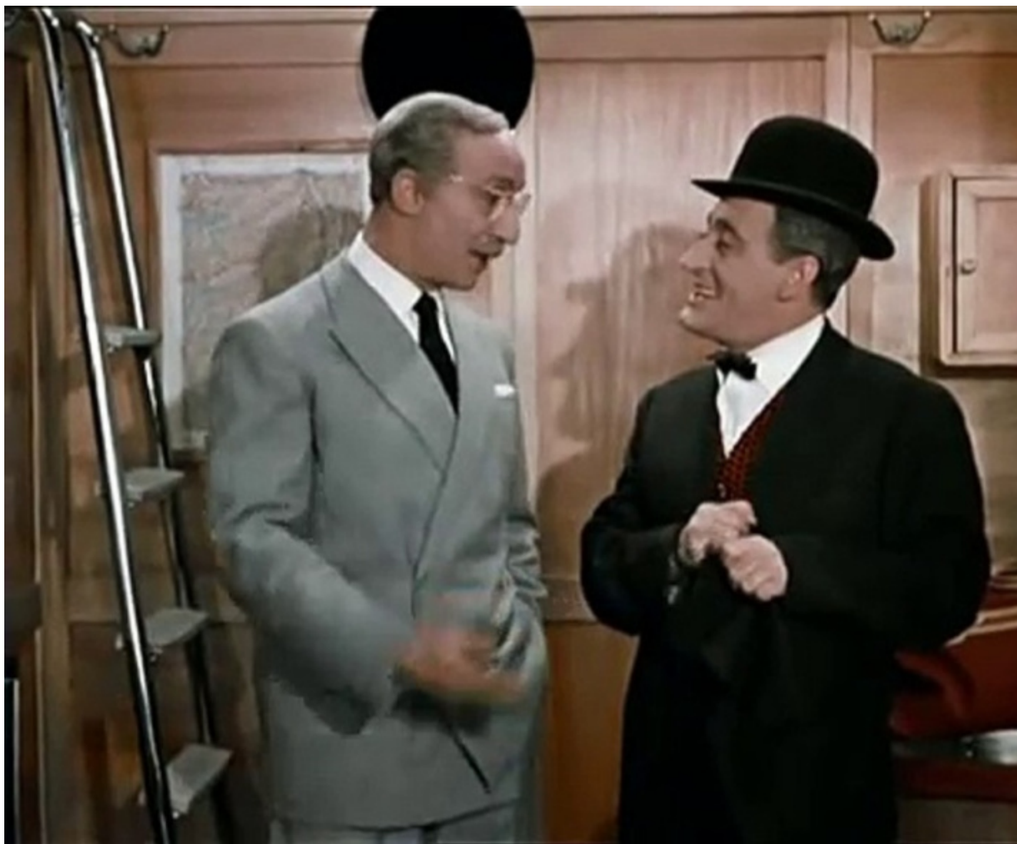
Sketch Totò e l'onorevole.

Però sarebbe un errore madornale pensare che tutto ciò dipendesse dal fatto che allora c'erano alcune personalità geniali e oggi no. Ciò che accadeva in campo teatrale era uno degli effetti di un processo politico e culturale che riguardava tutte le arti e prima ancora tutta la cultura e la società. Gli anni sessanta, almeno fino al '68, sono stati quasi dappertutto e per tutte le arti un crogiuolo di incredibili novità; dunque per pensare in modo costruttivo al presente e al futuro prossimo non basta evocare i caratteri di ciò che ci piacerebbe, dovremmo piuttosto partire dalla conoscenza del campo di forze nel quale oggi ci troviamo e, tenuto conto di quel contesto, prefigurare l'attivazione di nuovi bisogni e desideri.