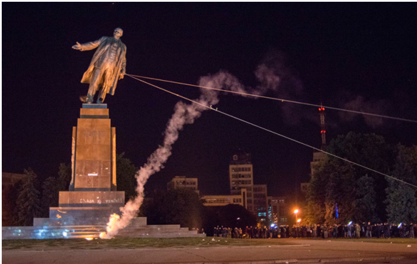
Un momento del Leninopad

Più prorompente che mai viene riposta la questione della sepoltura definitiva di quei resti. Il costo del mantenimento è altissimo e da parte di molti, Chiesa ortodossa in testa, si chiede a gran voce l'eliminazione del problematico reperto. Gli anni successivi allo smantellamento dell'impero sovietico hanno portato a molti esempi di iconoclastia anche nei confronti dei simulacri leniniani. Mirco Carrattieri e Antonella Salomoni parlano di Leninopad (stagione della caduta di Lenin) nell'Ucraina del 1991 e dei successivi anni di rivoluzione.