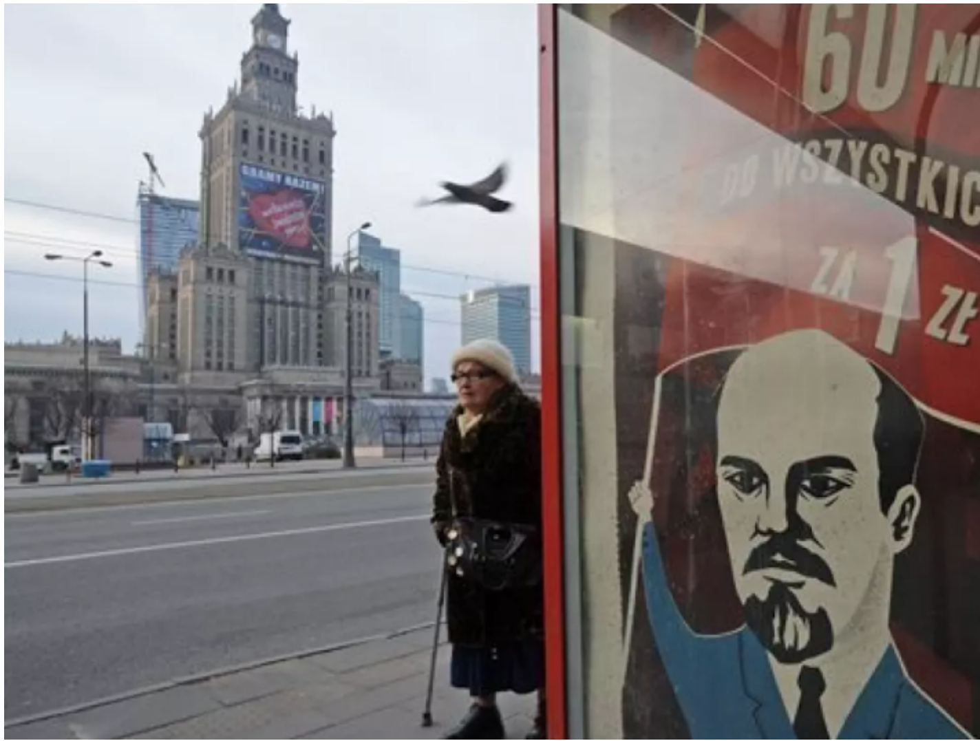
La pubblicità polacca con l'effigie di Lenin del 2013.

Cito, tra le molte, un'installazione del 1998 di Jurij Šabel'nikov e Jurij Fesenko, realizzata per una galleria moscovita: la torta Lenin morto . Una gigantesca torta raffigurante la mummia leniniana conservata nel Mausoleo fu fatta a fette e distribuita tra i visitatori che ebbero l'opportunità di "divorare Lenin", con tutte le implicazioni subliminali che quel gesto poteva racchiudere.