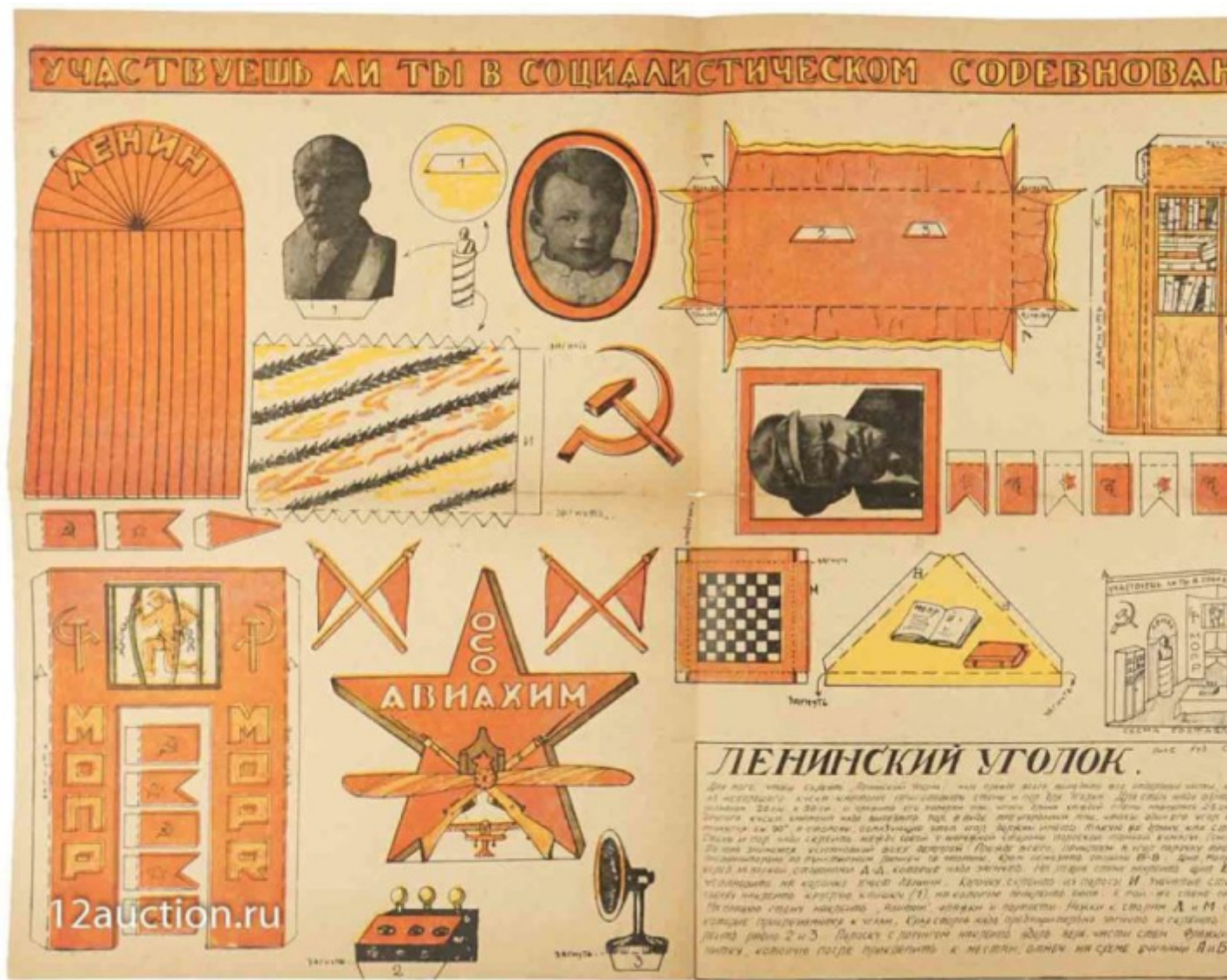
Modello di “angolo leniniano” per bambini da incollare su cartone, ritagliare e costruire.

Nel corso dei decenni successivi la costruzione del mito proseguì senza mai arrestarsi. L'iconografia leniniana conobbe molte fasi, fu raccolta da Stalin per legittimare la propria ascesa al potere, temporaneamente dallo stesso accantonata a metà degli anni Trenta per essere ripescata alle soglie della Seconda guerra mondiale (Grande guerra patriottica per i russi), quando a Stalin fu necessario il supporto ideale di grandi figure del passato, Lenin compreso, per affrontare la problematica situazione. Lenin venne classicamente rappresentato nella sua più specifica posa: in piedi, con il cappotto mosso dal vento, nell'atto di arringare una folla con il braccio proteso a indicare il cammino. L'origine di questo gesto è stata identificata nell'icona della Vergine detta Odigitria, quella in cui regge con un braccio il bambino, senza contatto fisico tra le guance (icona della tenerezza), e tiene l'altra mano protesa in avanti a benedire.