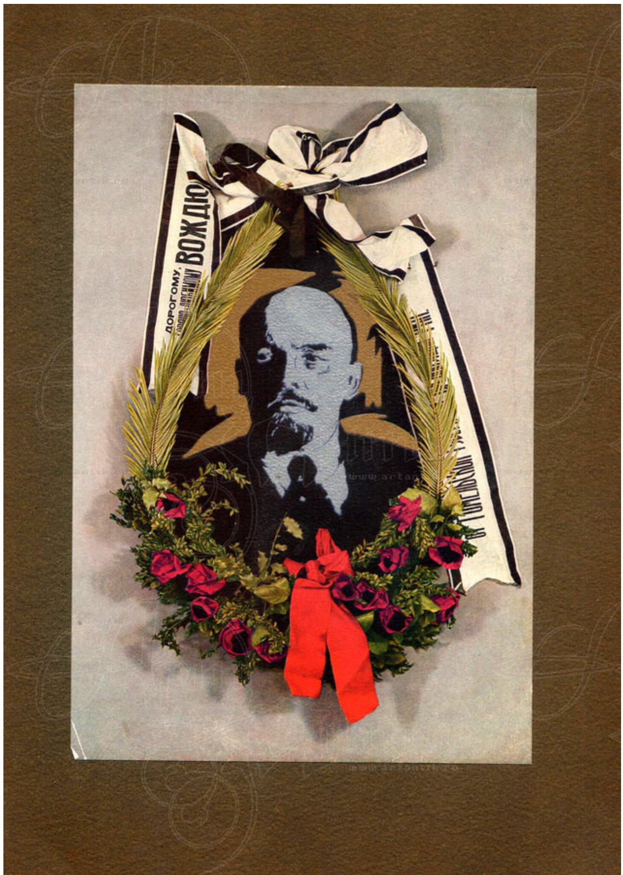
Ritratto di Lenin in stile lubok (stampa popolare)