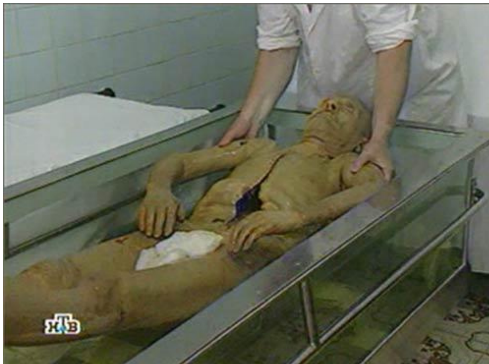
La salma di Lenin al bagno di formaldeide.

In parallelo presero a circolare impietose immagini del cadavere, o di ciò che restava della mummia di Lenin, nudo durante uno dei bagni che ne dovevano preservare l'integrità. Il popolo russo e mondiale poté vedere ciò che si nascondeva dietro l'apparenza impeccabile della salma composta nella semi oscurità del Mausoleo.