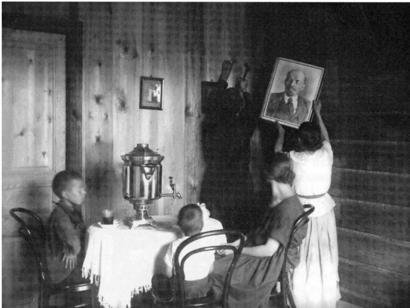
L'“angoletto leniniano” in una casa sovietica

Anche i bambini furono coinvolti in questa operazione e il mito di “nonno Lenin” proliferò assieme a giochi ispirati alla figura del leader scomparso (compreso il gioco al “funerale di Lenin”) e a una serie di narrazioni e trastulli divulgati dalle riviste per l'infanzia.