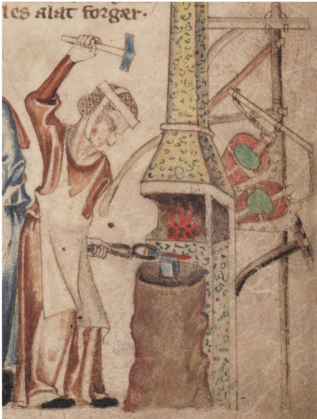
La moglie del fabbro ritratta nella Bibbia di Holkham (1327- 1335 ca.), London, British Library, Add Ms 47682, fol. 31.