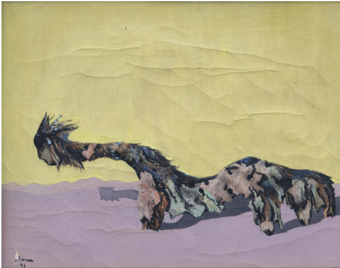
Bona de Mandiargues, S.T. (Radice), 1953, olio su tela, cm 16 x 22 © Sibylle de Mandiargues. Foto Andrea Mignogna