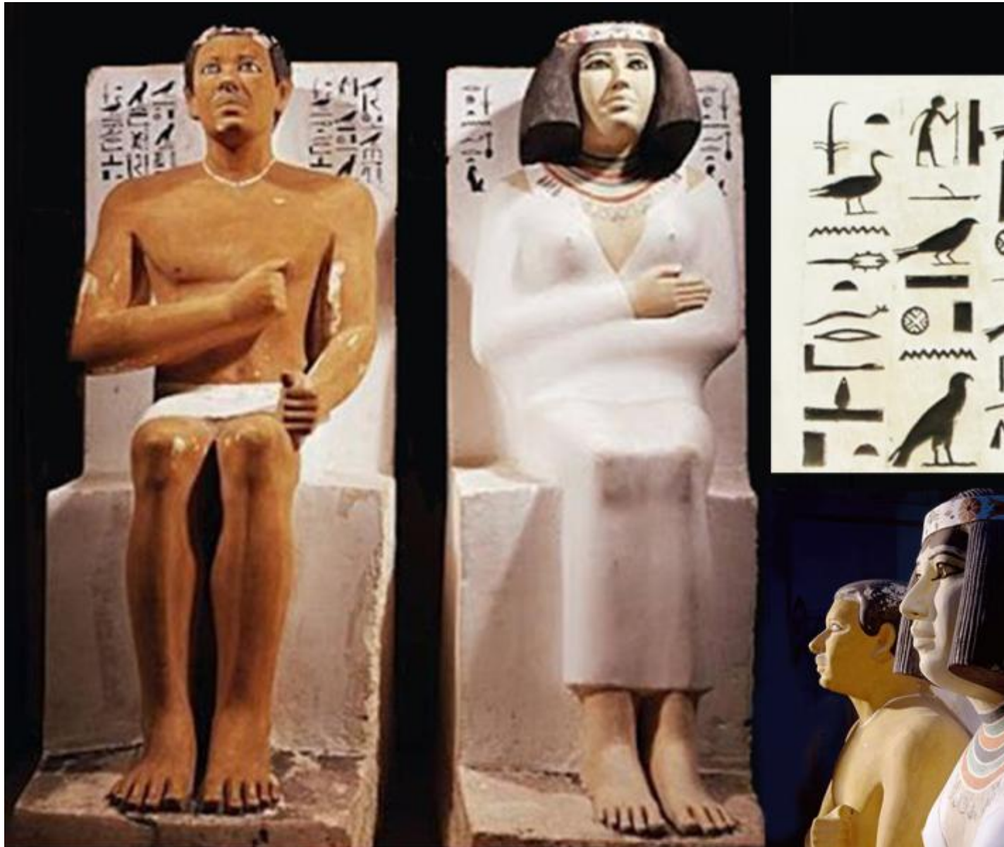
Statue di Rahotep e Nofret (con dettagli), Antico Regno, IV dinastia (2650-2610 a.C.). Museo Egizio del Cairo.