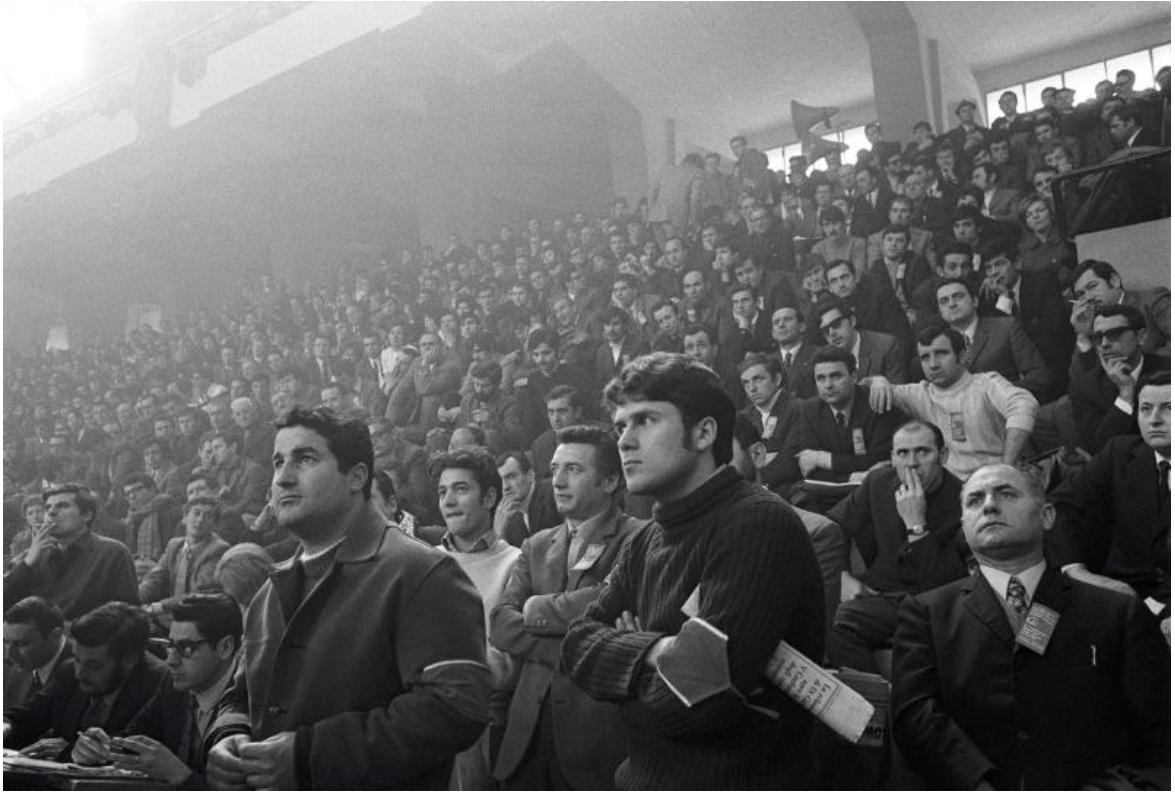
Conferenza dei delegati del PCI, Palazzetto dello sport, Milano, 1970, © Maria Vittoria Backhaus.