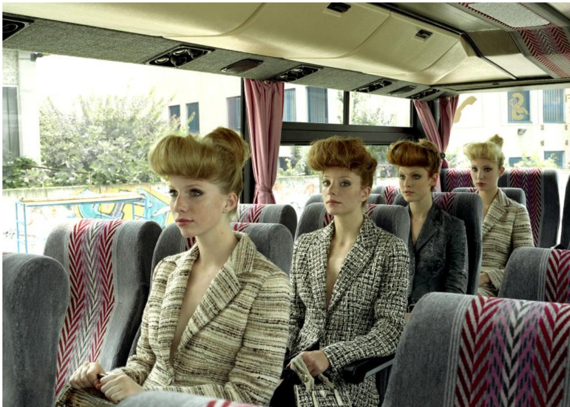
Pullmann, Editoriale Io Donna, Milano 2000, © Maria Vittoria Backhaus.

Io raccontavo il mondo di queste badanti che andavano e venivano da casa loro coi pullman. Lo facevo mentre lavoravo per la moda, così ho pensato che sarebbe stata una buona idea quella di fotografare le modelle su un pullman come fossero badanti, ma con gli abiti firmati. A me hanno sempre detto che sceglievo modelle brutte. Però adesso sono contenta perché vedo che le modelle che ho usato nel 2000 sono ancora attuali. C'è una foto stranissima che avevo dimenticato, di questi ragazzi vestiti di pelle nera, che chiunque direbbe "sono i Måneskin", ma semplicemente non erano ancora nati.