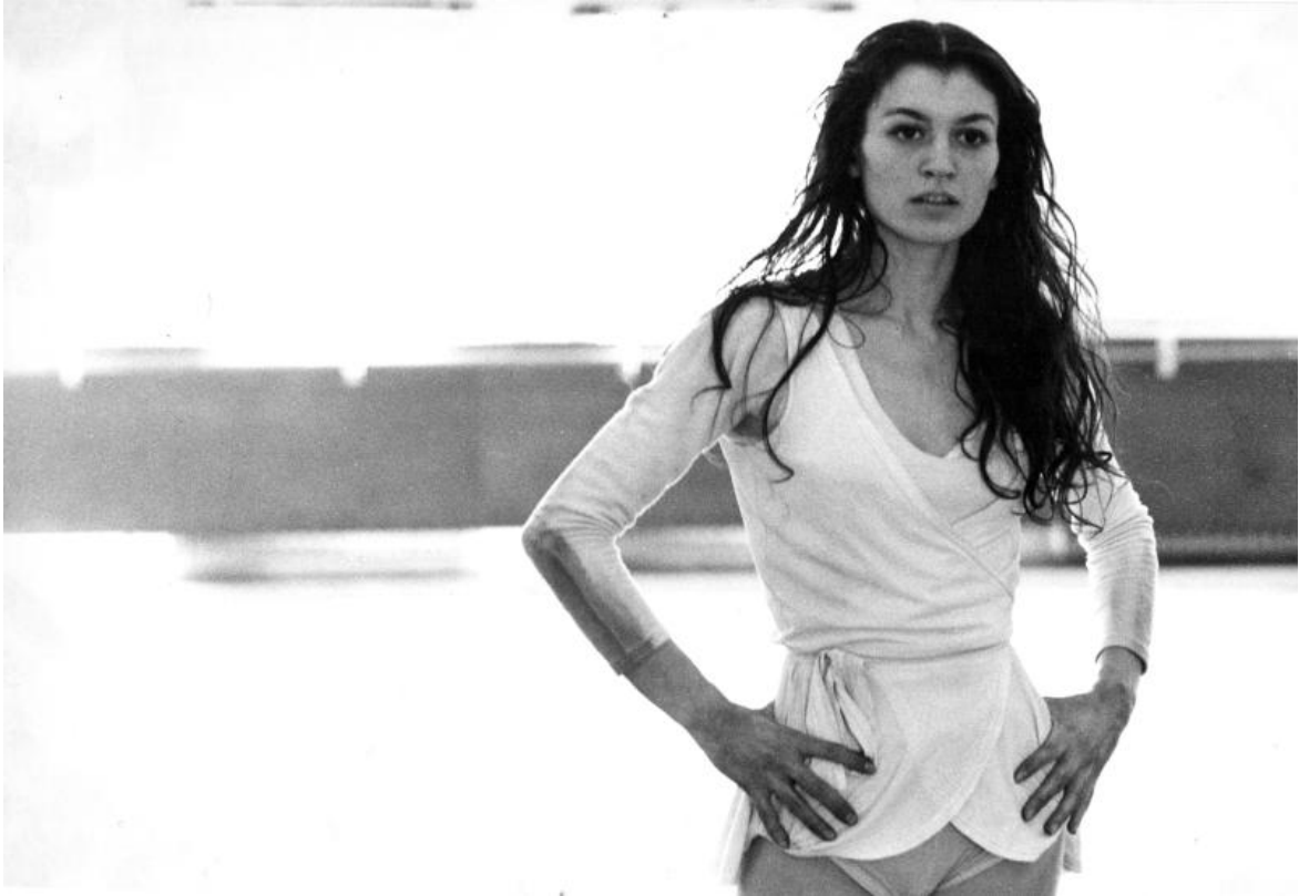
Carla Fracci in prova, Milano, 1965, © Maria Vittoria Backhaus.

cosa. Passando allo studio era un lavoro diverso, perché prima io fotografavo l'esistente e invece in studio non c'è niente, devi inventare tutto, ti trovi davanti a un muro bianco e lì devi fotografare quello che non c'è. Quello che ho cercato di fare, pur facendo la moda e lavorando su commissione per i giornali, è stato raccontare il mio tempo.