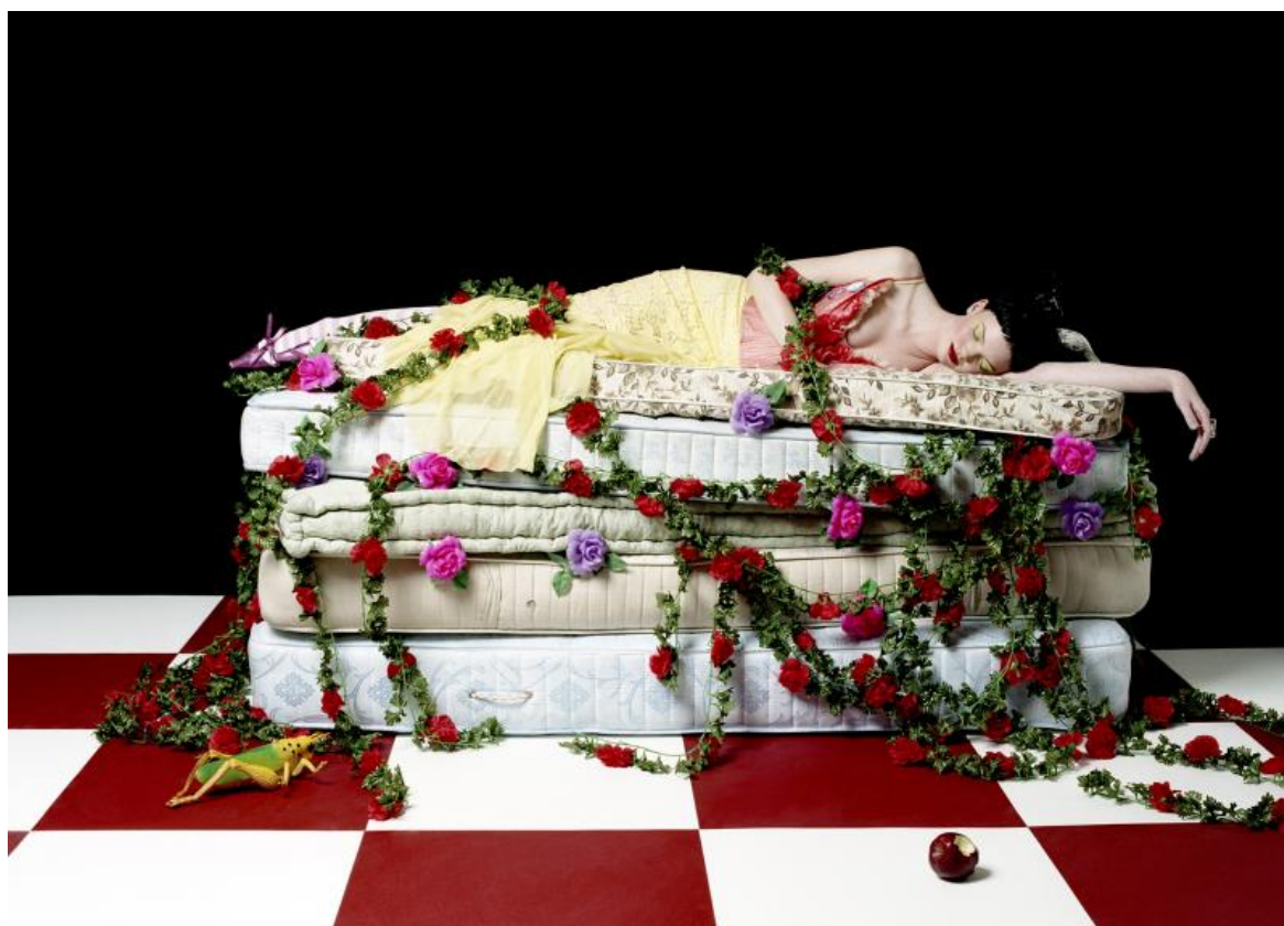
Biancaneve # 1, Milano 2001, Editoriale lo Donna