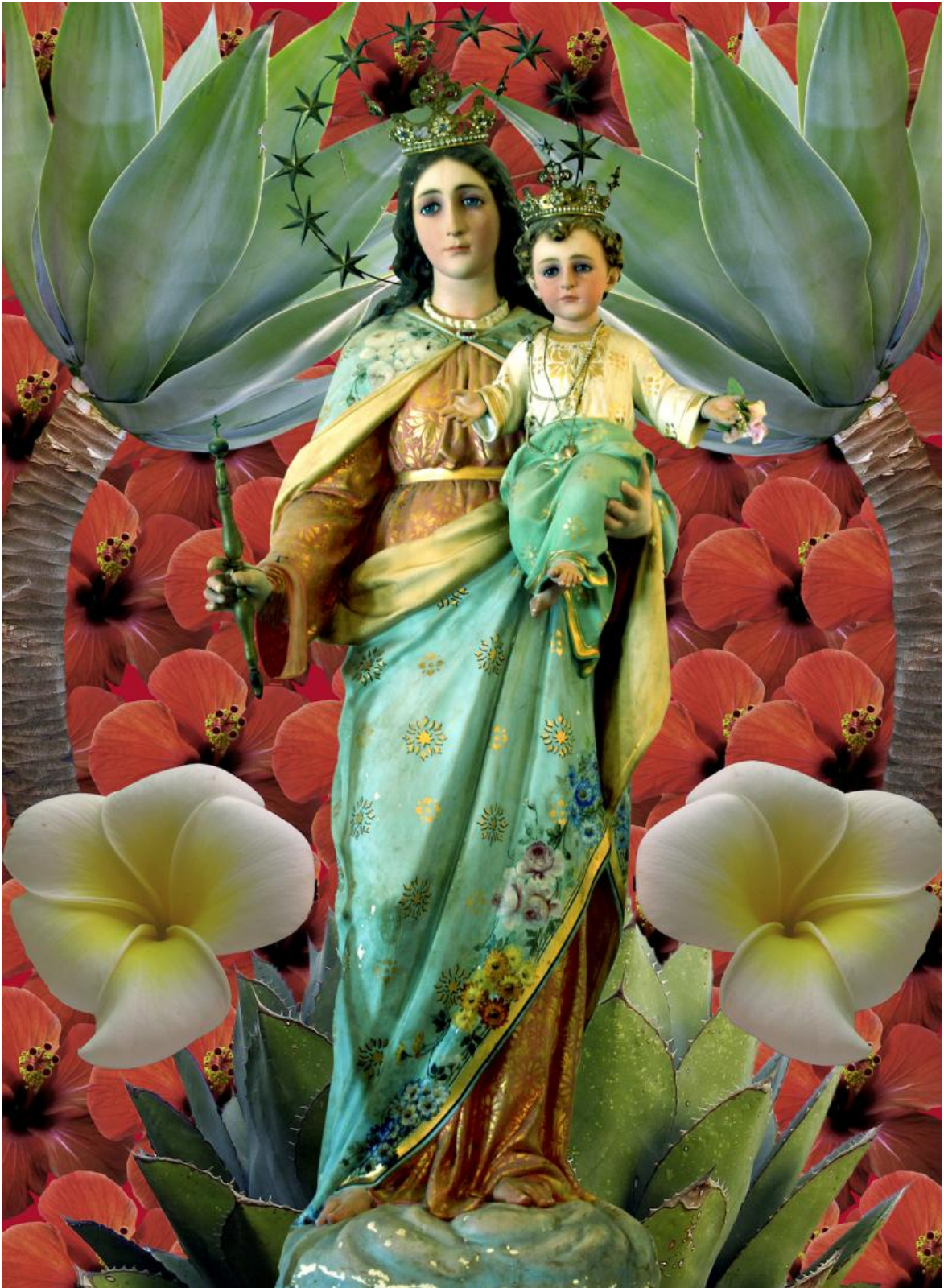
Filicudi, 2008, © Maria Vittoria Backhaus.

A me aveva incuriosito anche la relazione che c'è tra moda e sacro. Mi piacerebbe che tu mi dicessi qualcosa su questo.