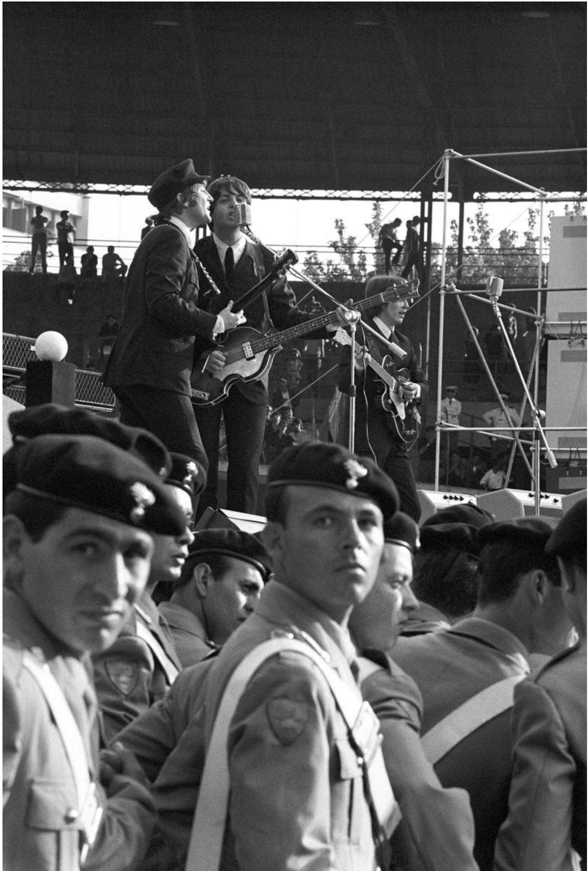
I Beatles a Milano, 1965, © Maria Vittoria Backhaus.

Le tue foto hanno una vena onirica e surreale. Guardandole ho pensato al l'incontro fortuito sopra un tavolo di anatomia tra una macchina per cucire e un