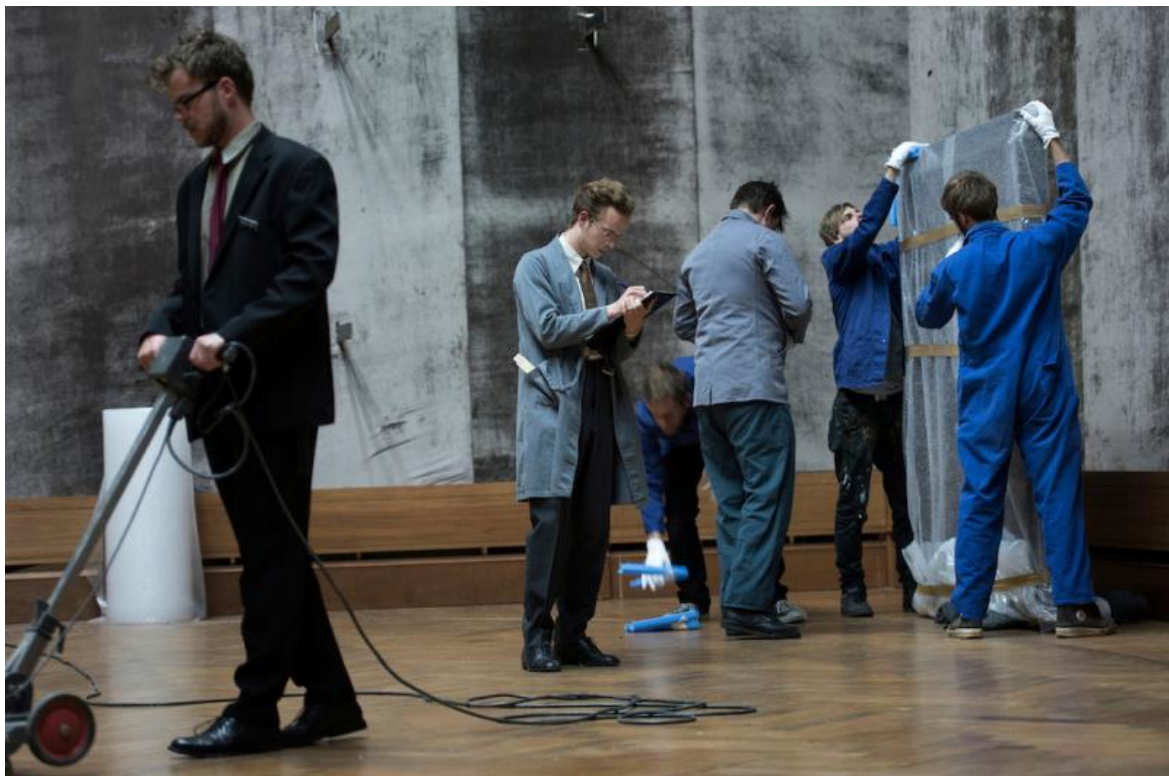
La terra di Nod, FC Bergman

Il titolo intanto. Per sapere dove mai sia la terra di Nod bisogna prendere in mano la Bibbia, per la precisione il suo primo libro, quello della Genesi. Al capitolo 4, 16 si scoprirà che "Caino si allontanò dal Signore e abitò nella regione di Nod, a oriente di Eden". Dunque siamo nel paese del fratricida, che tuttavia - scrive nelle sue Antichità giudaiche lo scrittore e storico ebreo Yosef ben Matityahu, più noto come Giuseppe Flavio, nato a Gerusalemme nel 37 d. C., ma cittadino di Roma - "continuò a far del male, ricorrendo alla violenza e al furto, introducendo unità di misura e confini e costruendo città fortificate".