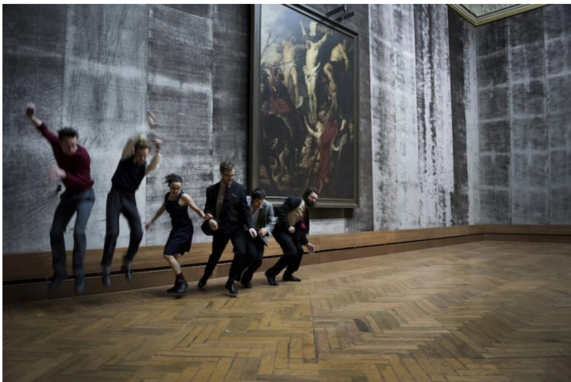
La terra di Nod, FC Bergman, ph. Kurt Van der Elst.

Quando nella scena finale dell'opera di Punzo tre performer prendono a ruotare come dervisci, lo stato di trance verso cui si dirigono è anche nostro. Sulle spalle, a mo' di croce o di ali, un attore porta una delle ingombranti strutture a griglia, due stringono in pugno un cubo cavo. Il regista/performer e la musica li spingono a vorticare più in fretta, in un crescendo tenero e violento. Ed è lì che lo spartiacque noi/loro definitivamente collassa, nel punto esatto in cui il loro vertice si rispecchia nel nostro fondo.