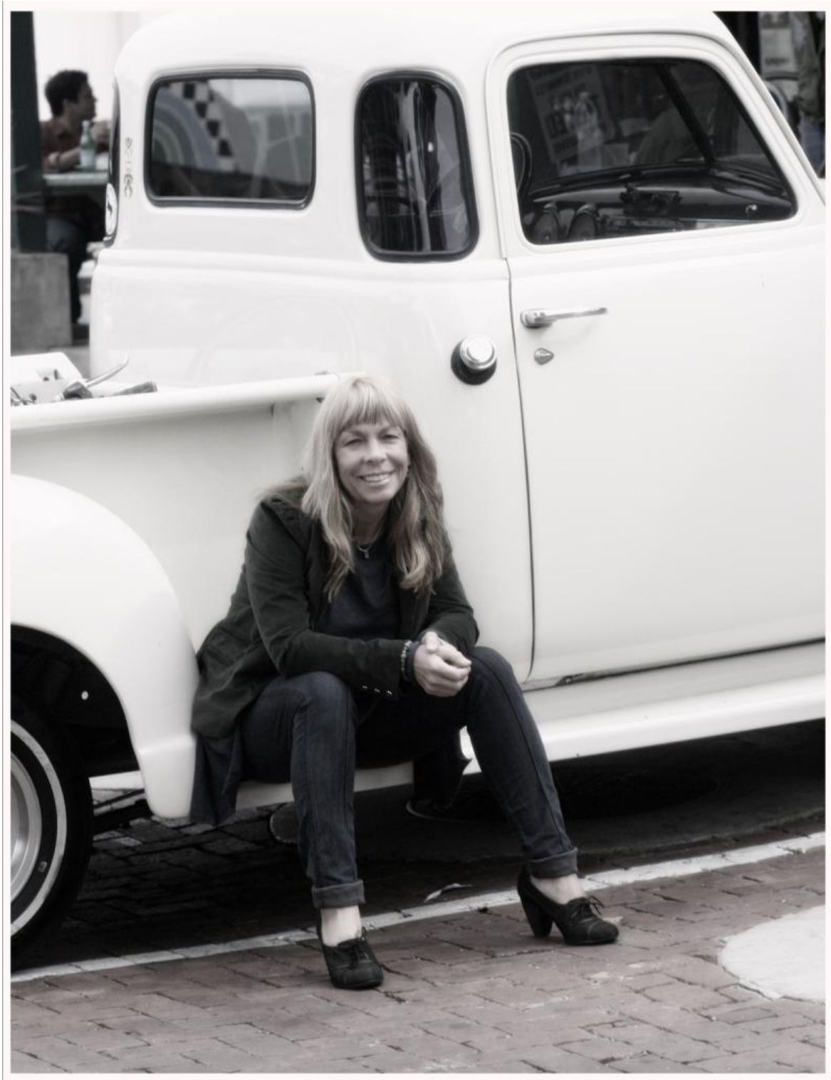
Rickie Lee Jones

fine anni '70 ci fu una ragazza che cavò della poesia dal logo di un'azienda petrolifera. Sarà certamente ricordata per i suoi dischi e per le sue canzoni, ma è possibile che Rickie Lee Jones sarà pure ricordata come l'ultima stella della Texaco, una ragazza diventata donna macinando asfalto, quando fare un pieno di benzina poteva ancora essere considerato non solo un gesto anticonformista, ma un atto poetico.