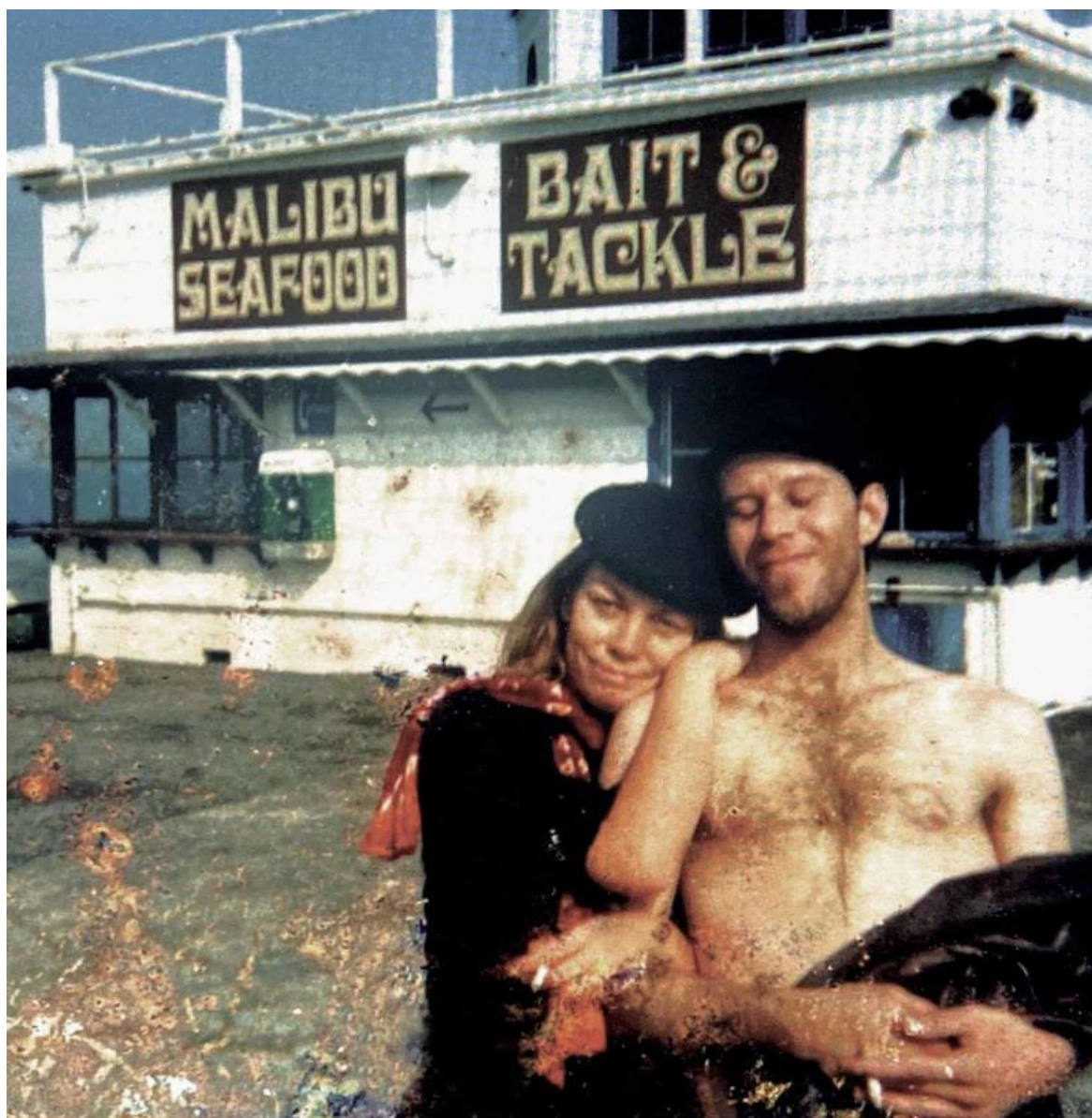
Rickie Lee Jones e Tom Waits, Atlantic Books.