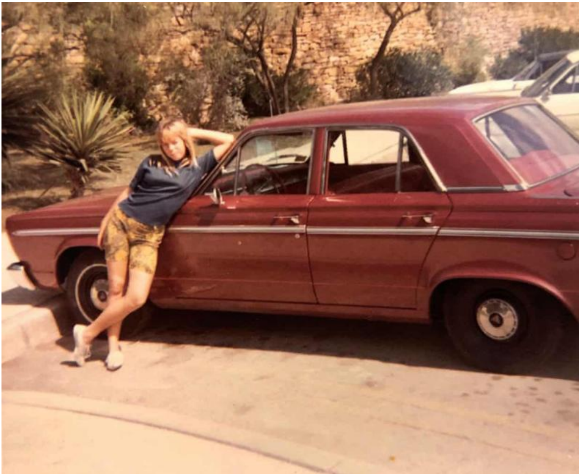
Rickie Lee Jones - Atlantic Books.

rivendicazione del suo essere diversa: I am the girl in the red beret , ripeteva a sé stessa, sono la ragazza col berretto rosso. The last chance Texaco racconta sì di viaggi, di libertà e di avventura, ma racconta soprattutto di una donna perennemente fuori tempo, una donna in cerca di un'ultima possibilità, la possibilità di potersi infine fidare dell'uomo con la stella appuntata sul petto. È senza ombra di dubbio una delle più belle canzoni che siano mai state scritte sull'America on the road , scritta da una donna che aveva alzato il pollice per ragioni diverse rispetto a Jack Kerouac. Viaggiare, stare on the road , per Rickie Lee Jones non era un modo alternativo di stare al mondo: era, semplicemente, l'unico modo in cui fosse mai stata al mondo.