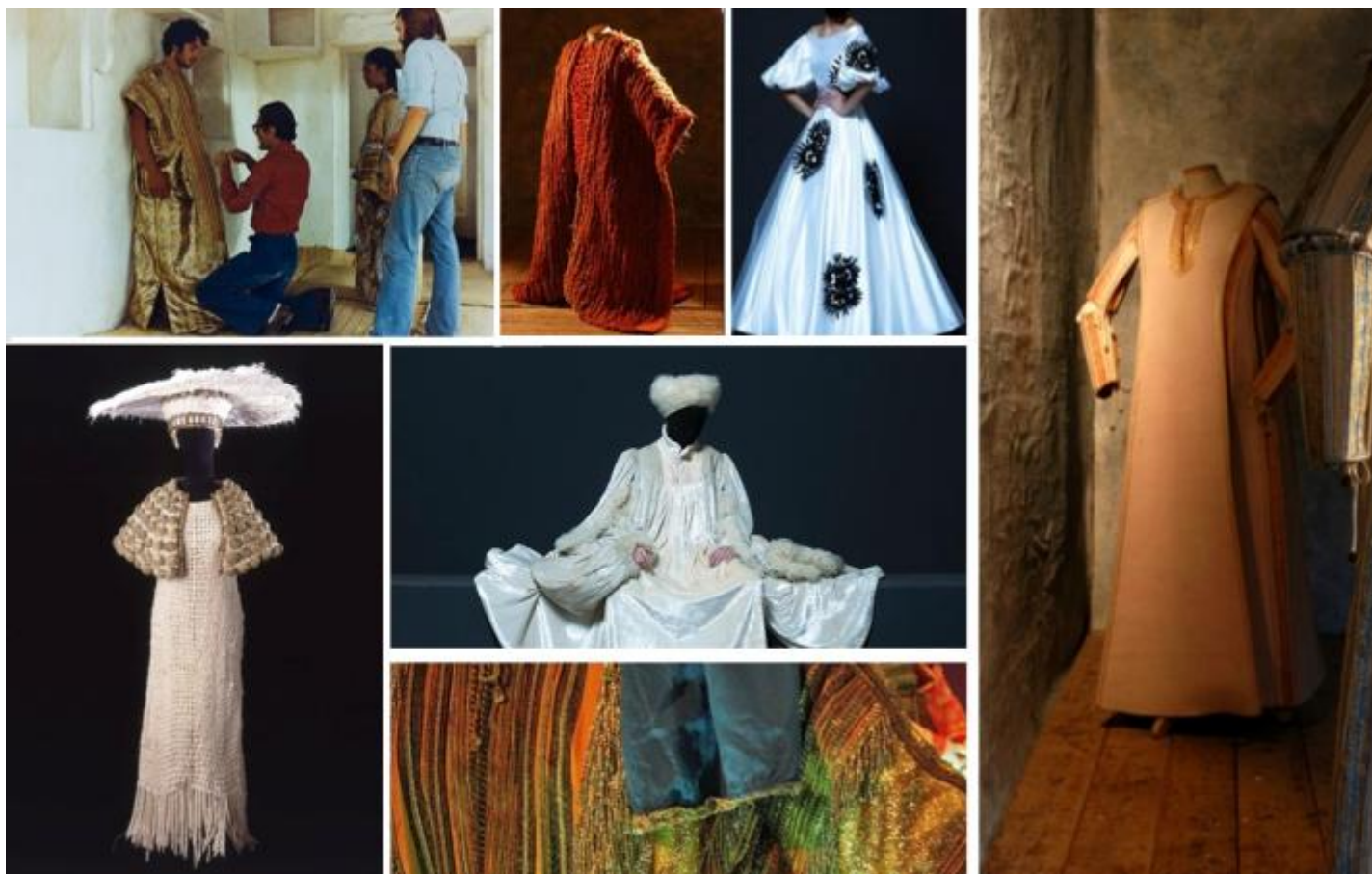
Pier Paolo Pasolini mentre aggiusta un costume di scena di Danilo Donati. Sotto: costume di Giocasta per Edipo Re ; Al centro, in alto: costume per Edipo Re e costume per Salò o le 120

Farani racconta: “Nell' Edipo credo non sia stato adoperato neanche un metro di stoffa normale, fatta a macchina comprata dalle manifatture, tutta è stata lavorata a mano, in maniera artigianale. I materiali usati erano diversissimi: c'era la pelle, il rame battuto, la lana. Usavamo anche il sughero per certi copricapi, usavamo per altri abiti tessuti larghi sempre fatti a mano e poi c'erano collane pesantissime di piombo e conchiglie.”