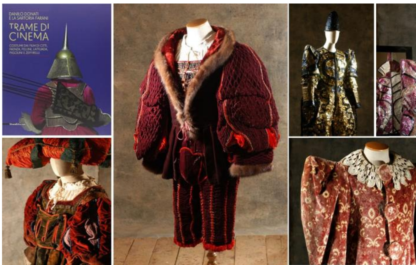
Trame di Cinema , copertina del volume edito da Silvana Editoriale e alcune foto di Mustafa Sabbagh. Da sinistra: costumi per La bisbetica domata di Zeffirelli. A destra: costumi per I

“L'estro creativo di Donati è stato talmente esplosivo da contraddistinguere ogni film, ogni spettacolo con un segno preciso ed unico. Basti pensare che per il Satyricon di Federico Fellini venne creata una enorme pressa (da noi, in sartoria, ribattezzata la macchina infernale ) utilizzata per plissettare a mano chilometri di cotone e seta, una vera fucina d'altri tempi. Per quanto riguarda il Casanova , sempre di Fellini, che ha vinto l'Oscar per i costumi nel '77, è interessante notare come nello stesso film convivono mondi diversi per fogge e colori. La scena a casa della marchesa d'Urfè è raccontata con impalpabili taffetà nei toni pastello, i costumi della gara di sesso nella casa romana, ancora di sapore seicentesco rispetto agli altri, sono di vistosi velluti e rasi colorati, decorati a motivi geometrici. E ancora la cena di Parma tutta giocata sui neri, forme essenziali decorate con enormi rouches di paillettes.”