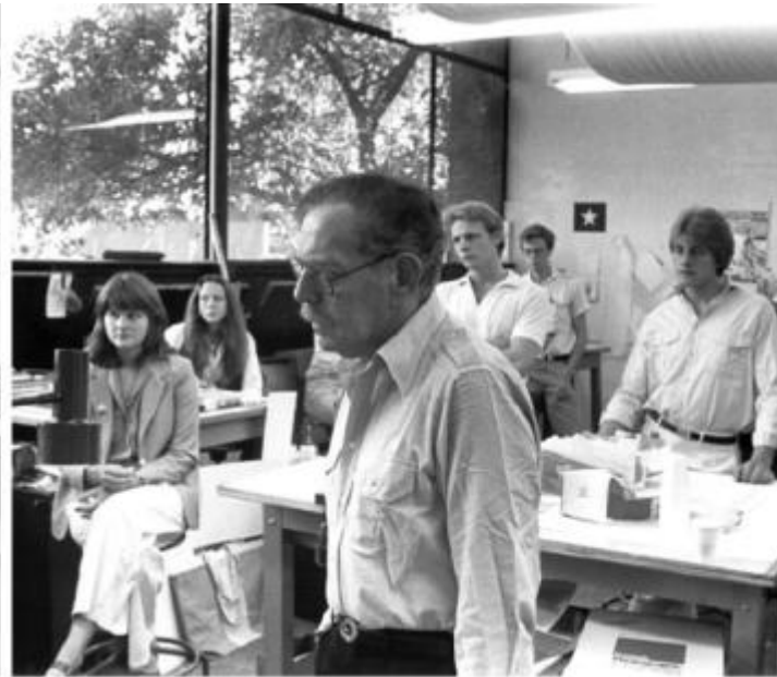
Victor Papanek mentre gira il programma televisivo Design Dimension a Buffalo, 1961-1963; una sua lezione al Kansas City Art Institute, dove è stato a capo della Scuola di Design dal 1976 al 1981.

Come un sacerdote di questa nuova religione, che avrebbe avuto e che ancora conta numerosi accoliti, nel suo libro Papanek predica l'urgenza di porre un argine alla deriva che, invece, a partire dal secondo dopoguerra, ha condotto il design, soprattutto quello americano, dominato dallo styling e dalla ricerca della modernità a tutti i costi, a farsi strumento del consumismo più esasperato per arricchire le sole industrie produttrici creando oggetti inutili, spesso sciocchi e comunque sempre costosissimi e i designer a essere interessati, il più delle volte, ai facili guadagni a discapito dell'ambiente.