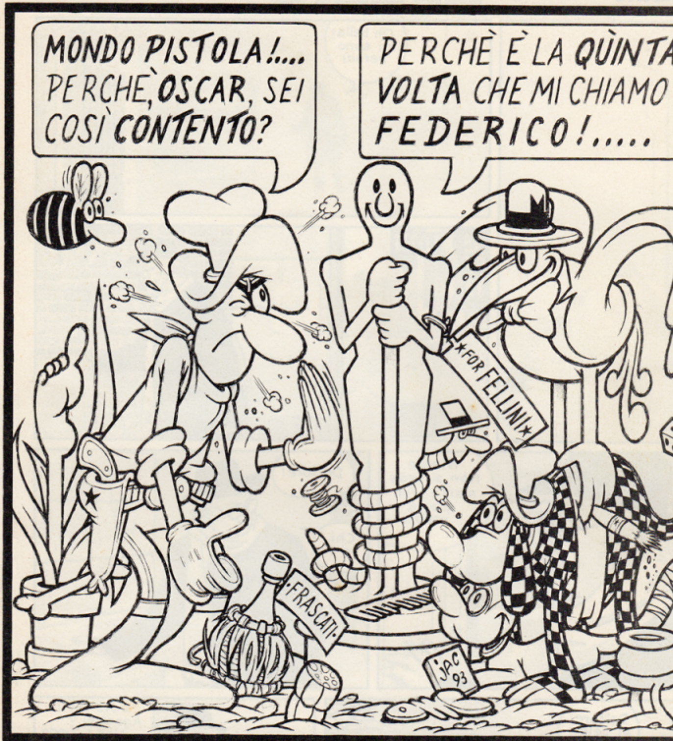
Disegno di Jacovitti per il numero speciale della rivista "Il Grifo" dedicato a Fellini (1993).

Come chiosa Goffredo Fofi, Jacovitti è stato il Fellini del nostro fumetto, e la sua arte merita di essere riconosciuta, studiata e goduta ora che il pregiudizio che lo ha colpito in vita è definitivamente svanito, valutandone criticamente le svolte e le contraddizioni. È con Fellini che Jacovitti ha potuto verificare una