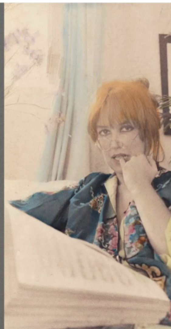
Do You Remember Valentino? Eve Babitz e il dattiloscritto originale di "The Sheik"