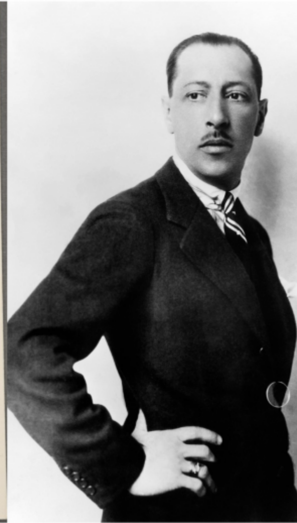
Eve Babitz e il suo padrino, il compositore russo Igor Stravinskij.