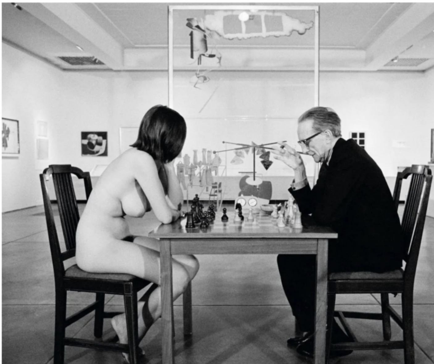
Eve Babitz gioca a scacchi con Marcel Duchamp.