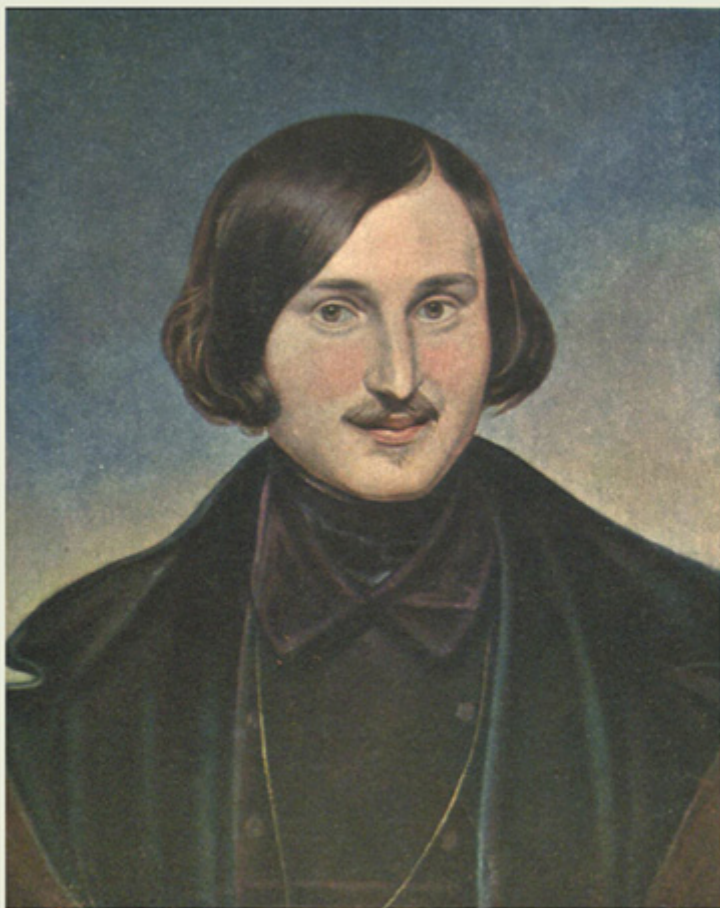
Gogol' ritratto da F. A. Moller (1840).

Al ritorno da Lubecca tenta la carriera di attore, invece ottiene un impiego al ministero degli Interni. Qualche anno dopo, nel 1834, proverà anche a insegnare all'università, ma dopo la prima avvincente lezione in cui conquista gli studenti, deluderà sempre più le aspettative con lezioni fiacche e noiose. «Non potevamo credere che fosse lo stesso Gogol' che la settimana precedente aveva dissertato in modo così brillante» scrive nel suo ricordo N. I. Ivanickij (p. 102). L'anno dopo viene licenziato dall'università di Pietroburgo per «riorganizzazione del personale» e perde la cattedra che aveva ottenuto grazie all'intercessione di Puškin e Žukovskij, i poeti che erano stati fondamentali anche per il suo inserimento negli ambienti letterari pietroburghesi. È Puškin, peraltro, a fornirgli i soggetti di Le anime morte e di Il revisore , diventando un punto di riferimento così importante per Gogol' che alcuni reputano la morte del poeta, avvenuta nel 1837, l'origine delle «manifestazioni morbose» (p. 123) dello scrittore, inclusa la svolta mistica e reazionaria degli ultimi anni.