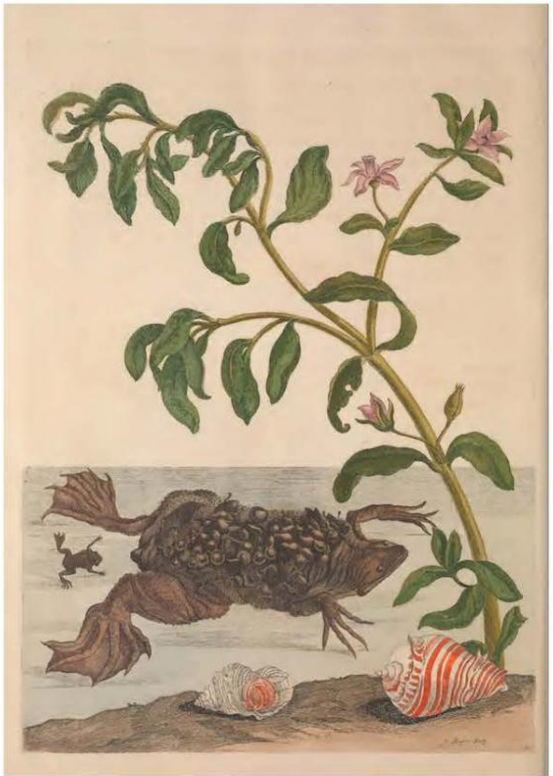
Fig. 44 – Maria Sibylla Merian, Metamorphosis insectorum Surinamensium , 1705, Tav. LIX