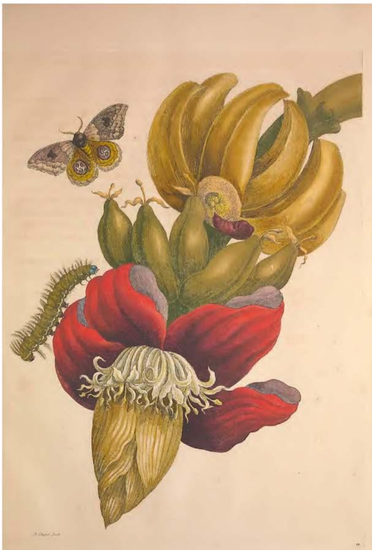
Fig. 32 – Maria Sibylla Merian, Metamorphosis insectorum Surinamensium , 1705, Tav. XII