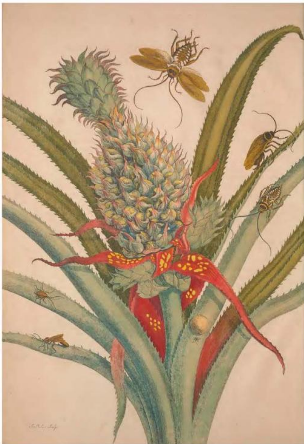
Fig. 42 – Maria Sibylla Merian, Metamorphosis insectorum Surinamensium , 1705, Tav. I

A Francoforte rimane poco: nel 1685 si trasferisce in Frisia presso una corrente radicale di protestanti, i labadisti, che predicano la comunione dei beni e la separazione dal mondo secolare. Scrive ancora Torresin: “Unirsi ai labadisti significa allontanarsi dal mondo, vivere secondo le Scritture, rinunciare a ogni forma di vanità, di lusso, di arte, conferire i propri beni e piegarsi alle regole di una comunità severamente gerarchizzata e disciplinata”. Grazie all’incontro con i labadisti viene a sapere dell’insediamento di alcuni di loro in Suriname, e di conseguenza decide di intraprendere il viaggio nelle Americhe.