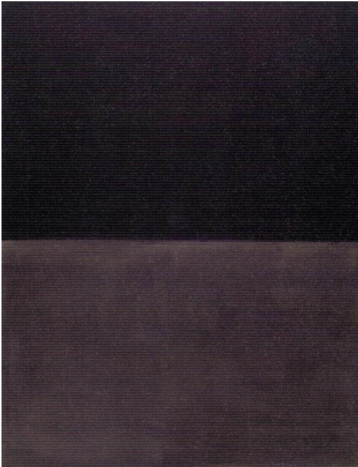
Mark Rothko, Untitled (Black on Grey) , acrilico su tela, 1969-1970, Solomon R. Guggenheim Museum, NY.