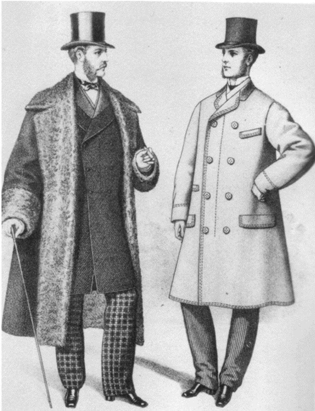
Variazioni del costume.

Batilla aggiunge che, durante la rivoluzione industriale, tessuti, ricami, silhouette, vengono correlati al genere per creare categorie merceologiche. I pantaloni, ad esempio, vengono realizzati con il cavallo basso, ampio, nascondente, per eliminare le forme peculiari della mascolinità, che si rivedranno in televisione dopo un secolo con Elvis Presley e i suoi jeans da "censura". La ribellione degli artisti si estrinseca nel rifiuto della rigidità dei codici vestimentari, di capi scomodi atti a esprimere posizioni di dominanza e individualismo.