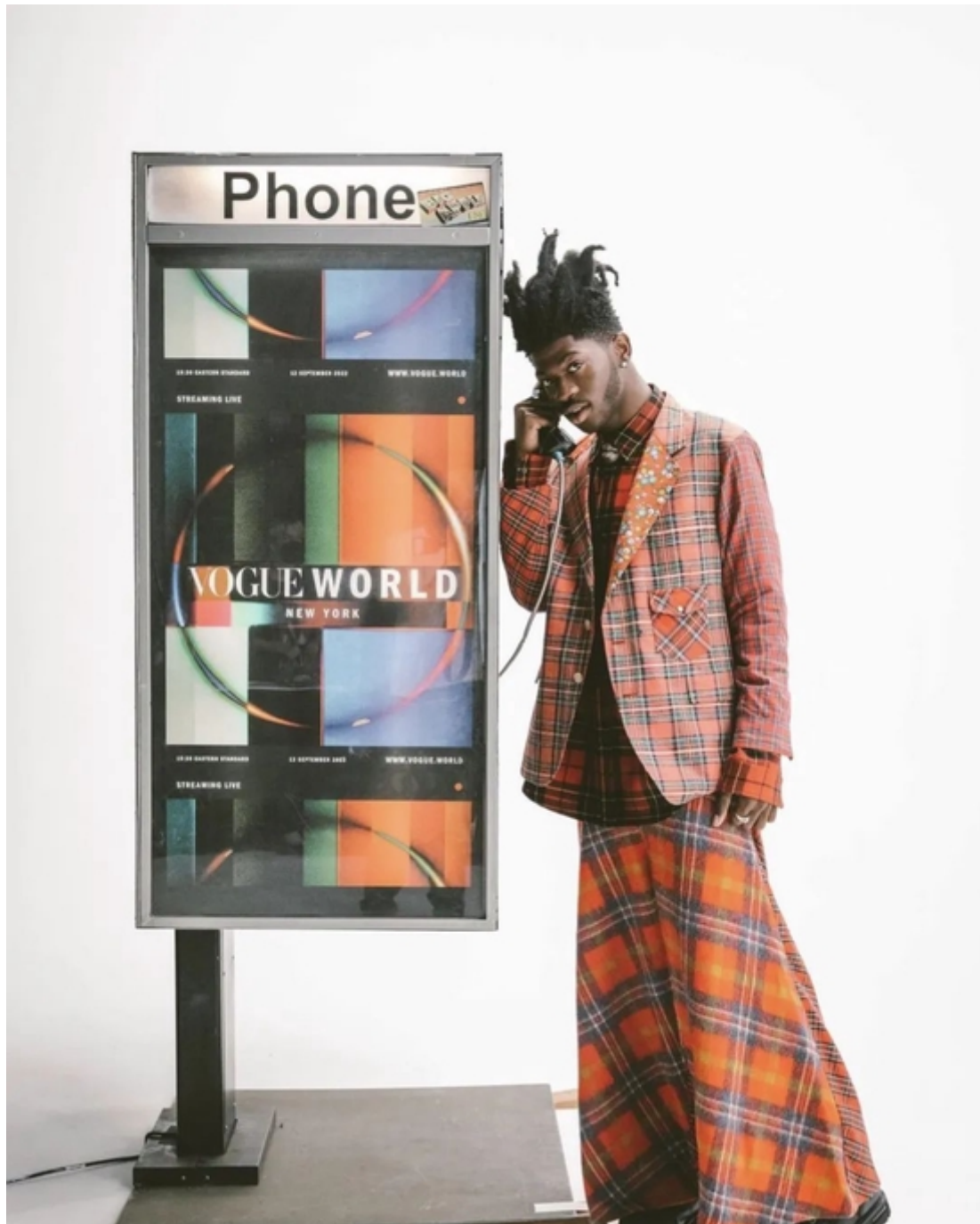
Lil Nas X promuove 130 anni di Vogue (agosto 2022).

Batilla riconduce il maggior peso dei cantanti nel sistema della moda alla capacità delle tendenze musicali contemporanee - nonostante il retroterra omofobico dell'hip-hop - di creare "una cultura estetica inclusiva, in grado di raccontare nello stesso modo generi diversi (o nessun genere) perché, in maniera forse inconsapevole, eliminano tutti i segni di riferimento classici al maschile e al femminile. Il grunge, nato a Seattle come fenomeno musicale, ha inglobato e incarnato molti di questi stimoli e contiene in sé riferimenti culturali che richiamano la Beat Generation".