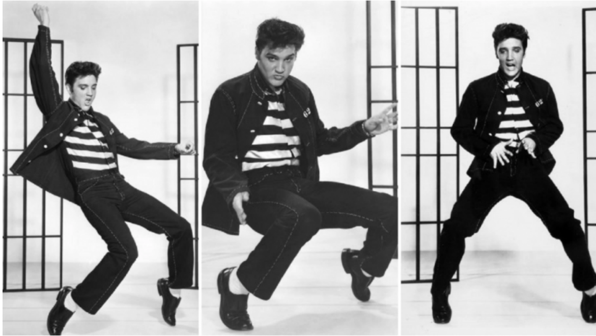
Elvis Presley, Jailhouse Rock - 1957.

La musica è un'arte soggetta alle leggi della moda, semplifica i modi di vivere e offre un modo per esprimere le identità, distinguendosi dall'alterità, in un modo attrattivo e semplice da praticare. Il valore aggiunto è che i testi dei brani riflettono le situazioni sociali e sollecitano l'introspezione. Rispetto al passato, i cantanti hanno uno strumento potente come i social media che amplifica e accelera il loro status di fashion icon , costruendo, al contempo, l'immagine pubblica attraverso gli oggetti di moda indossati. Si tratta di ciò che - cito testualmente - Rolling Stones ha definito "conversation starters", look individuali differenti dalla moda "canonica" perché parte di una personalissima visione del mondo che, rispecchiata in capi e accessori, diventa materia di discussione in tutto il mondo.