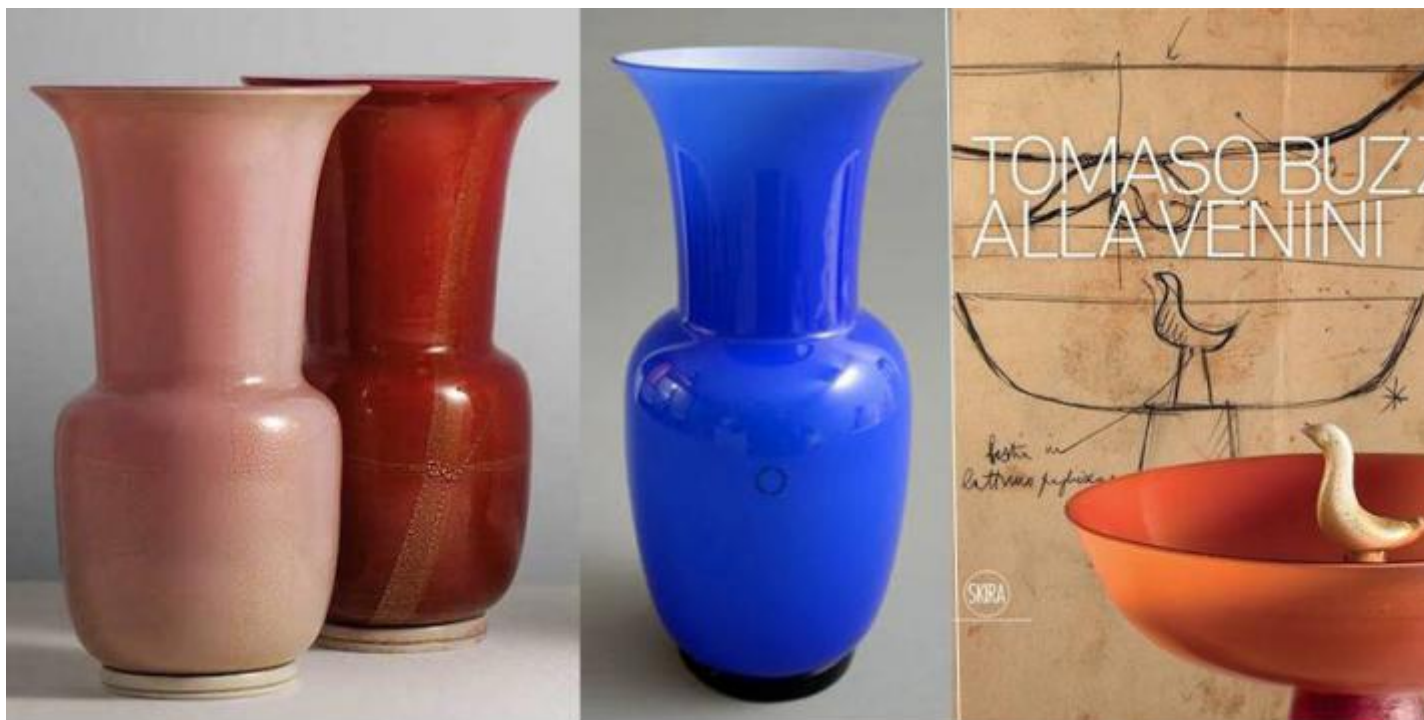
Tomaso Buzzi per Venini, "grandi vasi in vetro laguna a più strati di colore, i primi due con applicazione di foglia d'oro, 1932-33, con lungo collo svasato e bocca espansa. Piede ad anello, con filo vitreo avvolto", dal catalogo ragionato della produzione di vetri di Tomaso Buzzi per Venini, a cura di Marino Barovier e Carla Sonego, Skira Edizioni, 2014. Qui copertina.