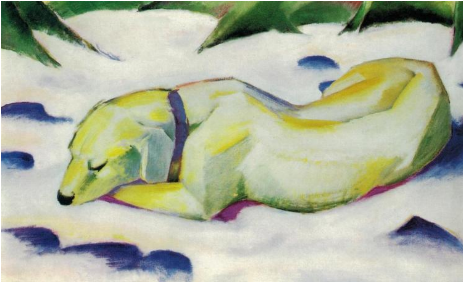
Franz Marc, Cane sdraiato nella neve , 1910.

Allo stesso modo i nuovi colori della moda parigina di allora, il color crema o il fraise écraisé , non sono ancora entrati nella lingua degli scrittori e dei poeti, non sono ancora diventati metafore inconsce come tutte le altre parole del linguaggio ( Beiträge , ed. 1999, II, pp 683-689). La parola intesa come metafora, come nel testo di Nietzsche Verità e menzogna e forse derivata proprio dalla lettura di questo scritto (o della comune lettura dell'opera di Gustav Gerber sul linguaggio come arte), lascia intravedere uno sguardo derisorio e scettico che propone un esempio curioso a dimostrazione dell'inganno del linguaggio: «wenn Blaubeeren grün sind, sind sie rot» ( Beiträge , ed. 1999, II, p. 492). Per liberarsi dalla gabbia del linguaggio l'uomo dovrà andare oltre la parola, lo scetticismo di Mauthner lo porterà a una mistica senza Dio , nella quale, come non vi sono nomi adeguati per le cose del mondo, non vi è nome per un Dio.