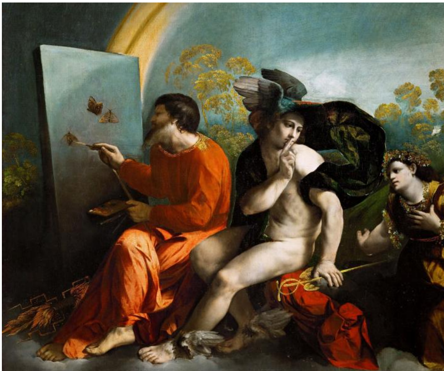
Dosso Dossi, Giove pittore di farfalle , olio su tela, 1524, Castello reale del Wawel, Cracovia, Polonia.

Nei Beiträge zu einer Kritik der Sprache , pubblicati nel 1901 e 1902 a Berlino, Fritz Mauthner, scrittore ebreo-boemo di lingua tedesca, utilizza l'esempio del colore per sostenere l'impossibilità della parola di catalogare in qualche modo il mondo, di collegare insieme in modo stabile le nostre sensazioni, di andare oltre la metafora e il malinteso. La mancanza della parola blu nella lingua e nella rappresentazione dei popoli antichi – nei Veda e negli Avesta, nella Bibbia, nel Corano e nei poemi omerici – testimonia il carattere storico e, secondo lui, casuale della formazione dei nostri concetti di colore.