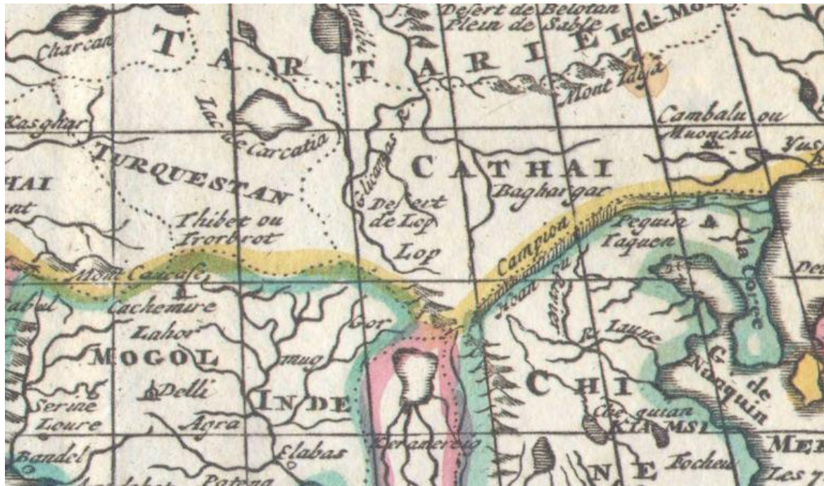
Dettaglio di una mappa dell'Asia pubblicata da Daniel de La Feuille (1706 ca.).

Il lettore paziente scoprirà a poco a poco che all'interno di un libro di frammenti apparentemente isolati, composto da frasi e parole che si sgretolano come pugni di sabbia, si nasconde un libro complementare, di melodie e voci che soffiano come il vento quando accarezza le dune: un libro-oracolo di forme e immagini da disseppellire e osservare con attenzione, nell'eco con cui si richiamano da tempi e luoghi diversi. Lo scoprirà soprattutto seguendo Louper nel suo viaggio più importante, in una Cina che rinnova le meraviglie delle cronache di Marco Polo (dallo splendore delle grotte dei mille Buddha di Bezeklik al nitore delle costellazioni che sovrastano la notte del deserto come pianure), ma si accorgerà anche che questa scoperta e la stessa meraviglia pervadono l'intero racconto, fin dai capitoli iniziali che in un primo momento, forse, l'avevano colpito al contrario per la loro asciuttezza.