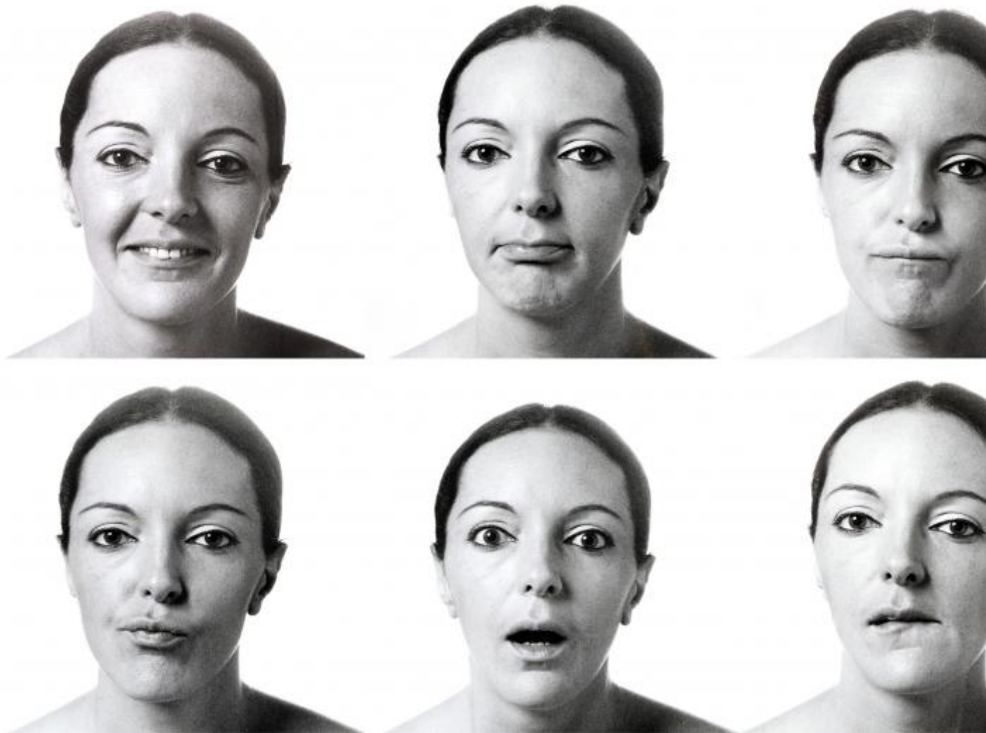
Ketty La Rocca, Senza titolo, libro d'artista, 1974 (particolare) © Archivio Ketty La Rocca | Michelangelo Vasta.

La fotografia è declinata in varie direzioni nel percorso di La Rocca: assume carattere documentativo, per quanto riguarda le immagini che registrano le performance dell'artista; performativo, quando l'artista si ritrae a letto con una sua scultura a forma di "J" iniziando a sviscerare quelle dinamiche del rapporto io-tu che tanta importanza avranno poi nella sua poetica; espressivo, sicuramente incarnando i risultati più interessanti da un punto di vista prettamente fotografico, in quanto La Rocca va a toccare con mano e disegnare letteralmente il meccanismo della visione e della comunicazione con l'altro, sentendo necessaria una radicale semplificazione del linguaggio per regredire al gesto primario del contatto, delle mani che toccano, indicano, cercano qualcuno di estraneo da sé.