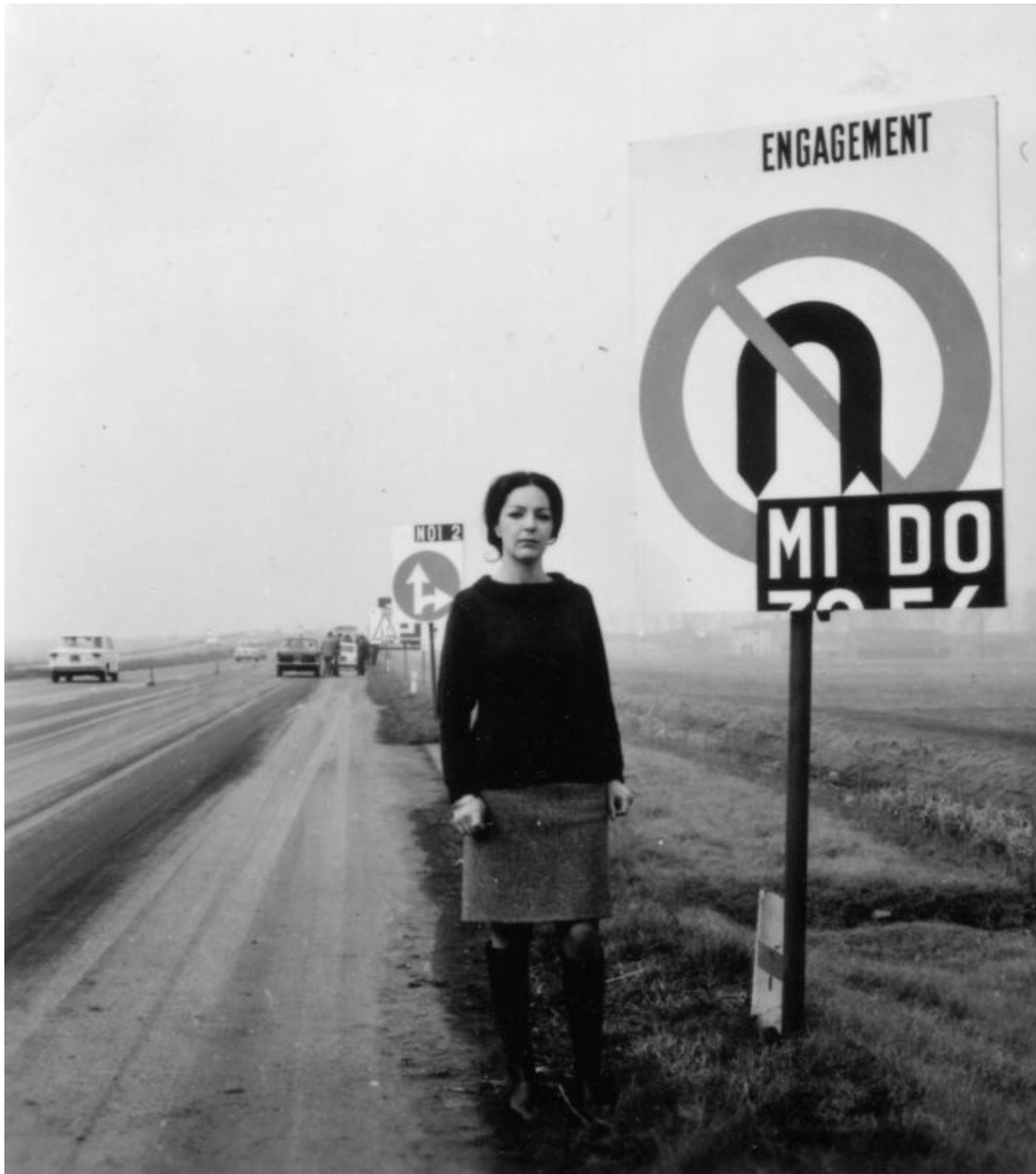
Ketty La Rocca, Fotografie dell'azione Approdo, Autostrada A1 per Firenze Nord, 1967

Il bisogno stesso di percepire qualcun altro, che comunque ci rimane intrappolato addosso, sulle dita, perché siamo noi a creare quel tu a cui rivolgersi, come chimera autogenerata dalla natura stessa dell'uomo. È una tensione irrisolvibile quella di far uscire l'altro da sé per abbandonarsi davvero e finalmente raggiungerlo, toccarlo con quelle stesse dita cui vorremmo attribuire il gesto definitivo di liberazione per poter sfiorare l'altro.