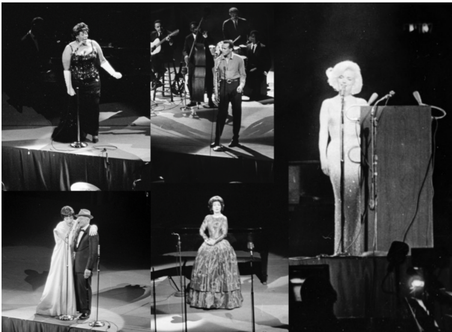
Ella Fitzgerald, Harry Belafonte, Shirley MacLaine con Jimmy Durante, Maria Callas, erano alcune delle star presenti sul palco del Madison Square Garden di New York la sera del 19 maggio 1962, che si esibirono in occasione del 45esimo compleanno del Presidente Kennedy. Tutte e tutti furono oscurati dalla presenza di Marilyn Monroe e dalla sua interpretazione di "Happy Birthday Mr. President".